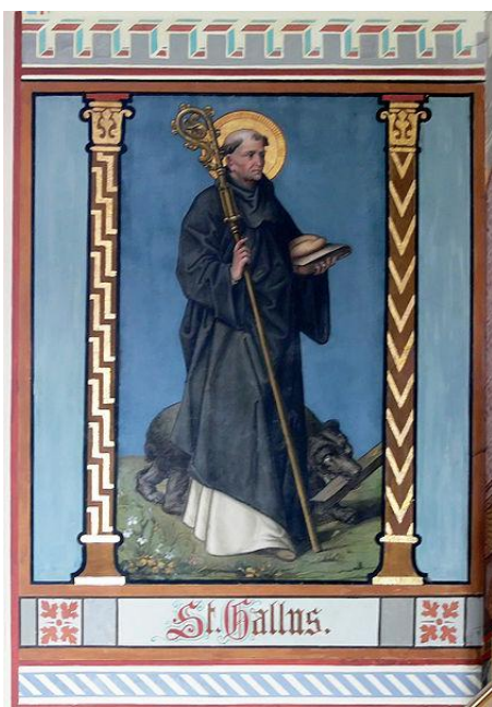
Tableau 1 : peinture murale présente dans l'église de Saint-Venance de Pfarrenbach, qui représente Saint Gall et son ours ( http://fr.wikipedia.org/wiki/Ours_dans_la_culture#Pastoureau_2007 )

hostile. Le péché que représente la colère ne semble donc plus véritablement, dans la littérature de jeunesse, être associé au plantigrade. D'autre part, dans l'album Une chanson d'ours de Benjamin Chaud (Héliou, 2011), Petit Ours décide de suivre une abeille, dans la forêt et dans la ville, car qui dit abeille, dit miel. Le stéréotype de l'ours gourmand et friand de miel est donc, au contraire, encore bien ancré dans l'imaginaire collectif et transmis à l'enfant-lecteur dès son plus jeune âge. Le stéréotype de l'ours dormeur et paresseux trouve également sa réalisation dans certains albums. La première illustration d' Un hiver dans la vie de Gros Ours (Grasset, 1986) de J.-C. Brisville nous présente Gros-Ours en train de dormir paisiblement dans sa caverne. Le narrateur le décrit à ce propos comme l'ours « qui passait ses journées à dormir, au chaud dans sa maison ». De même, la première page de l'album Une chanson d'ours de Benjamin Chaud (Héliou, 2011) nous expose un Papa Ours tranquillement endormi au fin fond de la forêt. Ainsi, cette représentation stéréotypée de l'ours est transmise aux enfants dès leur plus jeune âge et semble être le fruit d'un héritage culturel et historique très ancien.