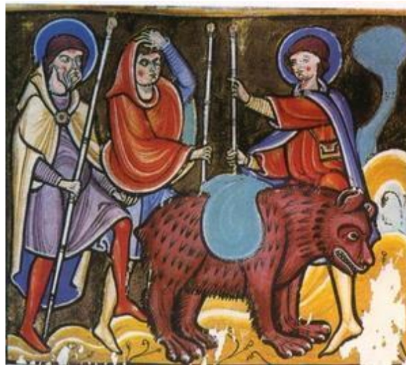
Tableau 2 : miniature d'un manuscrit de la Vie de Saint Amand (1160) qui met en évidence un ours portant les bagages de ce dernier ( http://fr.wikipedia.org/wiki/Ours_dans_la_culture#Pastoureau_2007 )