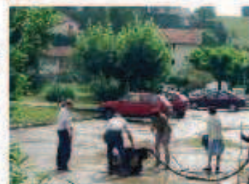
Tout le monde s'est mobilisé pour venir en aide aux sinistrés.