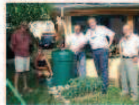
Des récupérateurs d'eau de pluie installés avec le soutien de la Ville.