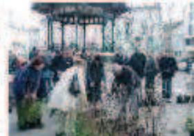
1000 arbres, 1000 haies pour embellir les jardins avec l'aide de la Ville.

Suite à l'épave qui s'abattit sur la partie amont du Savouat dans la nuit du 5 au 6 juin, (débit de 8 m 3 /seconde, c'est-à-dire très largement supérieur à une crue décennale et proche d'une crue qui survient tous les 50 ans), la reconnaissance d'état de catastrophe naturelle est effective pour notre ville et surtout les victimes des inondations. La réparation de la route de Plan, en bordure du ruisseau débute fin janvier. Le projet de création en 2009 d'un bassin de rétention de 18 000 m 3 en amont de la soule actuelle (18 fois supérieur à l'actuel ; coût 600 000 €), nécessite un dossier dit « loi sur l'eau » ainsi qu'une étude d'impact qui sont actuellement en cours de réalisation.