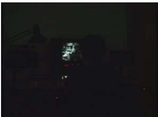
Citation dans l'écran de la table de montage dans Où gît votre sourire enfoui ?

certaines citations apparaissent pendant que les cinéastes sont en train de monter les films cités. Elles sont diffusées soit en plein écran, comme dans John Cassavetes par exemple, soit sur l'écran de la table de montage. Ce qui est intéressant ici, ce n'est pas la citation en tant que telle, mais le travail qui y amène, c'est-à-dire le processus de création. Dans Où gît votre sourire enfoui ? , Pedro Costa décide de filmer les rushes du prochain film de Straub et Huillet