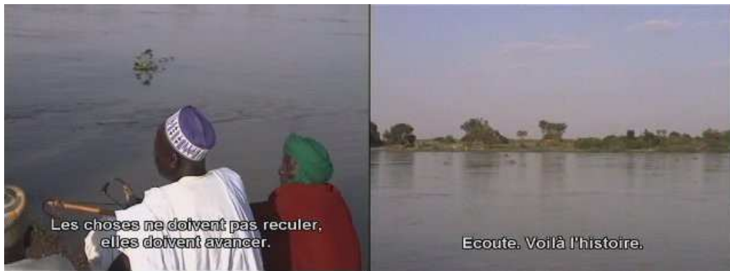
Un seul plan de Mosso, Mosso (Jean Rouch comme si...)

Par exemple, dans Mosso Mosso (Jean Rouch comme si...), Jean Rouch essaie de faire rejouer les scènes d'un de ses films. Au début du plan, il s'agit d'un document sur la manière dont travaille Jean Rouch. À la fin de ce même plan, les acteurs jouent. Dans une même image, le témoignage devient une citation et le réalisateur transforme le document en fiction. Le spectateur est passé d'un univers filmique à un autre par la simple reconstitution d'une scène. C'est sur ce type d'ouverture que les réalisateurs de la collection réfléchissent.