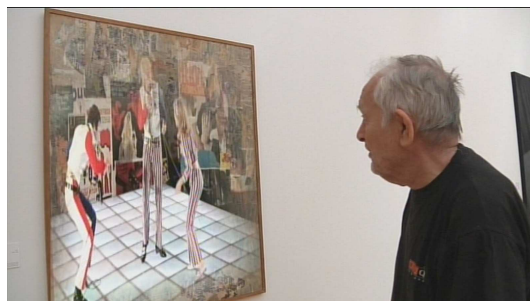
Écran second dans Marc'o

L'écran second « est une délimitation spatiale, une restriction visuelle, un marquage de champ, une figure de l'image, et il a toujours, comme tel, quelque chose de muet, il agit le redoublement sans le parler, il l'accomplit sans le déclarer 39 ». Dans L'archipel du cas'o , Sébastien Juy utilise les cadres des peintures pour citer les films de Marc'o. Dans un musée, le cinéaste regarde un tableau quand, tout à coup, un extrait de film apparaît dans le cadre, à la place de la toile. Les