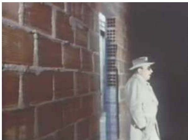
Personnage Jean-Pierre Melville

L'illusion s'insère dans la réalité : le documentariste filme un décor réel mais le personnage est "fictif". De cette manière, le réalisateur montre