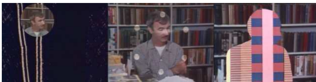
Différents assemblages entre la citation et le témoignage de Norman McLaren dans Né en 1914, Norman McLaren .

Né en 1914, Norman McLaren , par exemple, détruit les limites entre les plans. Les images ne cessent de se superposer les unes aux autres. Les films de Norman McLaren sont au second plan tandis que le cinéaste témoigne dans un rond au premier plan. Plus tard, l'effet s'inverse. C'est Norman McLaren qui est au second plan et des extraits de films au premier plan. Ou alors la bande son du film s'invite sur les plans sur le cinéaste étudié et inversement. À un moment, un extrait de film est même diffusé sur la silhouette du réalisateur. La citation et le témoignage ne sont plus seulement des images liées entre elles, elles sont mélangées et assemblées dans un même plan. Mais bien qu'elles s'interpénètrent comme s'il n'y avait jamais eu de barrière entre elles, le spectateur arrive toujours à distinguer le témoignage de la citation dans le plan. Leurs fonctions, totalement différentes l'une de l'autre, ne changent pas. Ce sont deux matériaux qui peuvent cohabiter dans un même plan. Ils ne sont pas contradictoires. C'est pourquoi nous ne pouvons pas dire que les fonctions des deux matériaux fusionnent, et qu'elles créent quelque chose d'autre dans l'image. Il y a toujours à la fois une citation et un témoignage dans ce type de plan.