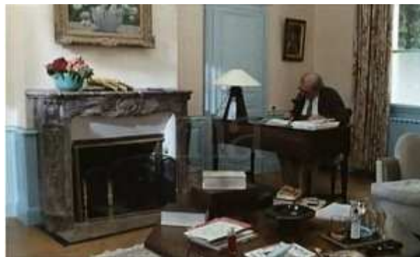
1 ère séquence Claude Chabrol, l'entomologiste .

Dans Claude Chabrol l'entomologiste , il y a deux sortes de témoignages : le témoignage du début où l'auteur de films joue son propre rôle pendant que sa voix over narre sa méthode de travail, et ceux