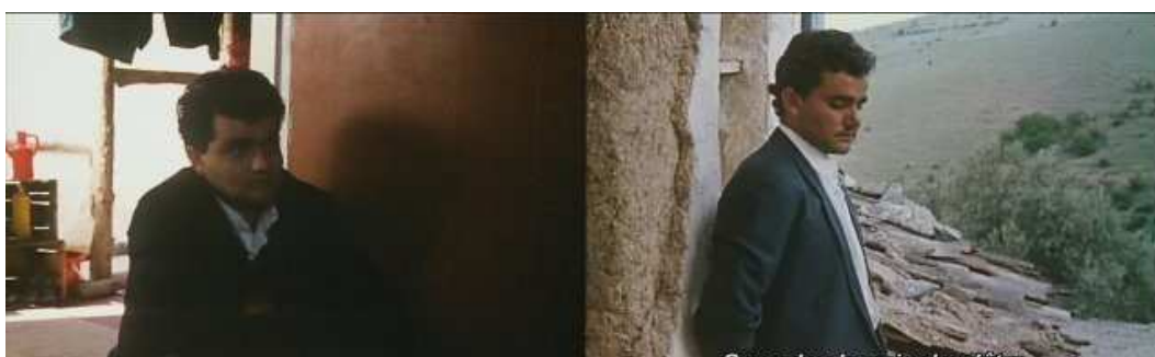
Plan 1 (témoignage)

Le réalisateur peut utiliser la présence d'une même personne dans la citation et l'entretien. Le personnage du film cité se retrouve au plan suivant en tant qu'acteur. Le film René Clair utilise ce procédé : un extrait de Porte des Lilas où Dany Carrel joue, est suivi d'un plan en couleur sur René Clair et l'actrice qui s'arrêtent de marcher, puis d'un autre plan où ils parlent du quartier des Halles. Le documentariste d' Abbas Kiarostami , vérités et songes emploie également souvent ce procédé avec des acteurs comme Babak Ahmed Poor ou encore Hossein Rezai.