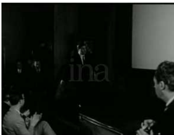
Entrée de Jerry Lewis dans une salle remplie d'étudiants

Cinéma, de notre temps . La caméra filme l'échange qu'il y a entre les étudiants et le cinéaste. Jerry Lewis fait son show . Au fil de l'entretien, le spectateur découvre Jerry Lewis alors que ce dernier est entouré