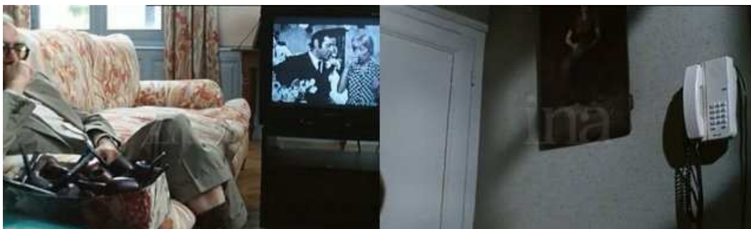
Décor de l'entretien

Plus tard, Claude Chabrol est assis dans son canapé. Il répond aux questions de Jean Douchet. Une télévision, installée près d'eux, diffuse les films du réalisateur. Le décor est remanié spécialement pour le film. L'entretien se déroule d'une manière assez classique quand, tout à coup, le téléphone sonne. Ce détail, s'il n'était pas prévu au départ, va finalement être utilisé pour créer l'ambiance du film. C'est quand la caméra délaisse une première fois les deux hommes pour aller vers le téléphone, puis quand elle filme Claude Chabrol entrain de partir pour aller répondre au deuxième appel, que l'appareil téléphonique prend de l'importance dans le documentaire. Il devient un élément de mise en scène.