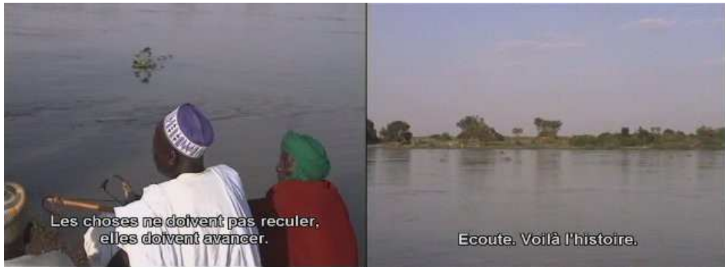
Un seul plan de Mosso, Mosso (Jean Rouch comme si...)

Par exemple, dans Mosso Mosso (Jean Rouch comme si...), Jean Rouch essaie de faire rejouer les scènes d'un de ses films. Au début du plan, il s'agit d'un document sur la manière dont travaille Jean Rouch. À la fin de ce même plan, les acteurs jouent. Dans une même image, le témoignage devient une citation et le réalisateur transforme le document en fiction. Le spectateur est passé d'un univers filmique à un autre par la simple reconstitution d'une scène. C'est sur ce type d'ouverture que les réalisateurs de la collection réfléchissent.