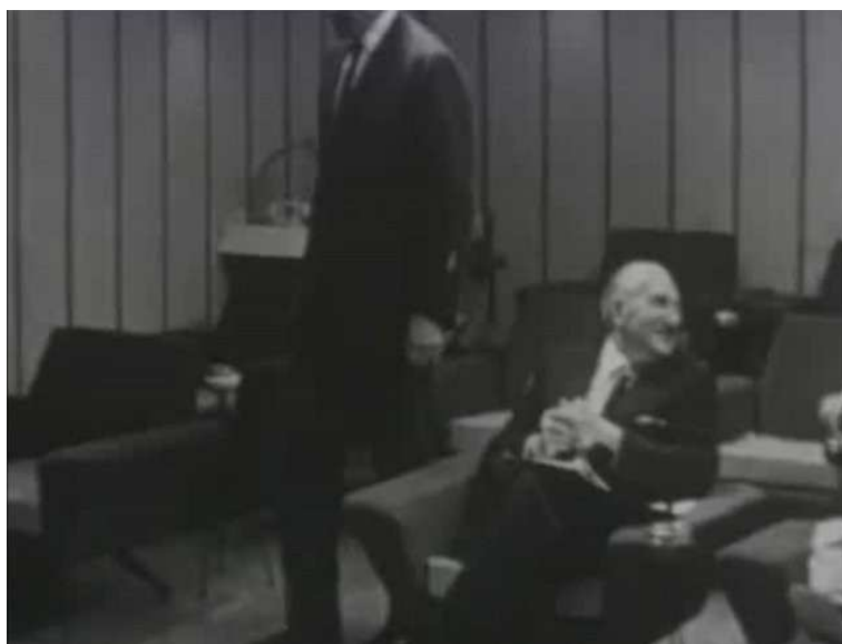
Citation Le Mépris dans Le dinosaure et le bébé, dialogue en huit parties entre Fritz Lang et Jean-Luc Godard

Parfois, le documentariste dénature l'extrait de film et se l'approprie afin que, d'une part, la liaison entre le film du cinéaste et le film sur ce cinéaste soit plus facile et d'autre part, que l'extrait transmette des idées supplémentaires liées à l'auteur de films étudié. C'est le cas notamment dans Le dinosaure et le bébé, dialogue en huit parties entre Fritz Lang et Jean-Luc Godard . Ce documentaire