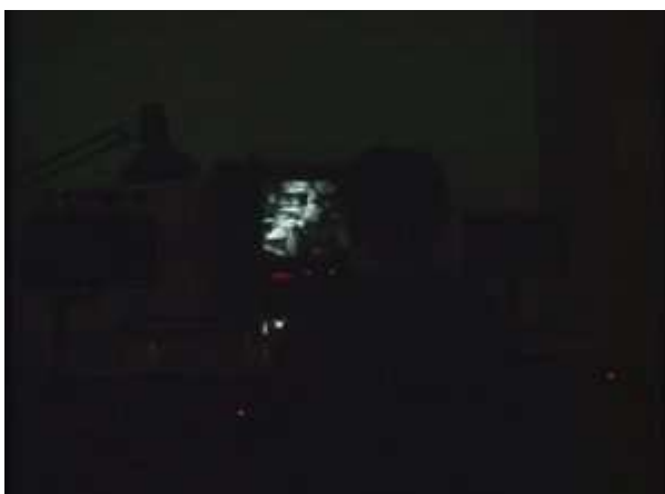
Citation dans l'écran de la table de montage dans Où gît votre sourire enfoui ?

certaines citations apparaissent pendant que les cinéastes sont en train de monter les films cités. Elles sont diffusées soit en plein écran, comme dans John Cassavetes par exemple, soit sur l'écran de la table de montage. Ce qui est intéressant ici, ce n'est pas la citation en tant que telle, mais le travail qui y amène, c'est-à-dire le processus de création. Dans Où gît votre sourire enfoui ? , Pedro Costa décide de filmer les rushes du prochain film de Straub et Huillet