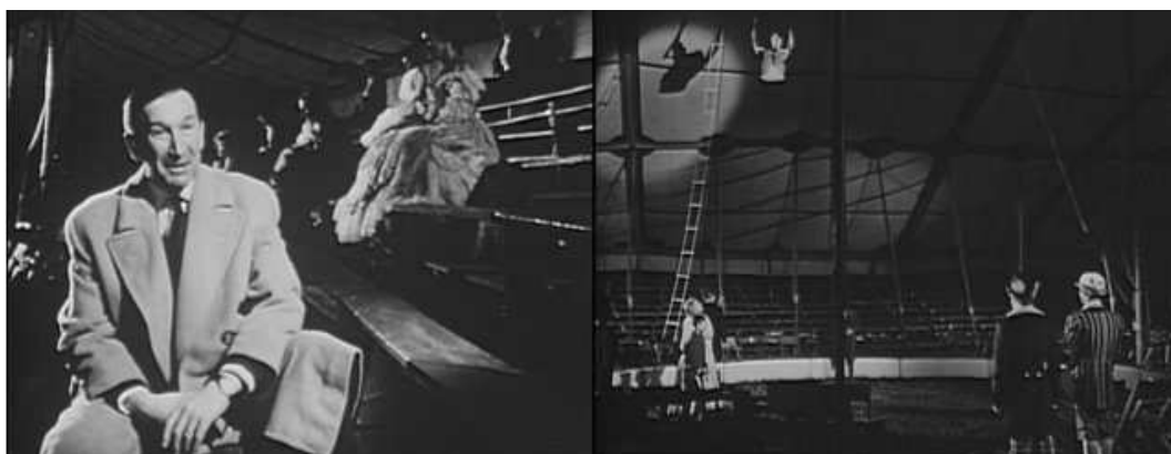
Citation derrière le témoin

pour autant que le témoignage se transforme en fiction. Pour que le témoignage soit une fiction, il faudrait que l'univers filmique du cinéaste étudié, s'il s'agit de films de fiction, remplace l'univers filmique du documentaire. Là encore, il faut changer la nature des images en passant d'un cinéma à l'autre. Parfois, le documentariste reprend le décor des films du cinéaste. Dans Max Ophuls ou la ronde , par exemple, les témoignages se déroulent soit devant des extraits de films, soit dans le décor utilisé pour réaliser Lola Montès . Dans les deux cas, deux espaces-temps se rencontrent et cohabitent dans le même plan. La citation rentre dans le témoignage et elle lui transmet une part de son univers filmique.