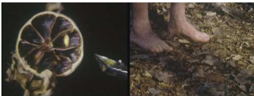
Plan 1: citation

Il était une fois André S. Labarthe , fidèle à la pensée labarthienne, a une forme très particulière qui dénote parfaitement de cette envie de détruire les limites liées à l'image. Les images filmées par Estelle Fredet ont différents grains. Une de ses images a la même qualité que celles de certains films d'André S. Labarthe. C'est pourquoi, elle s'assemble parfaitement avec les citations intégrales. Le spectateur a l'impression que les plans filmés par André S. Labarthe et ceux filmés par Estelle Fredet sont issues des mêmes sources filmiques.