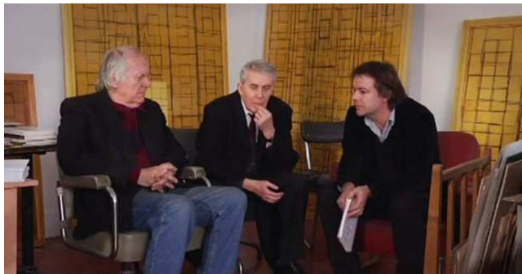
NO COMMENT (à propos de film socialisme de Jean-Luc Godard), André S. Labarthe, 2012.