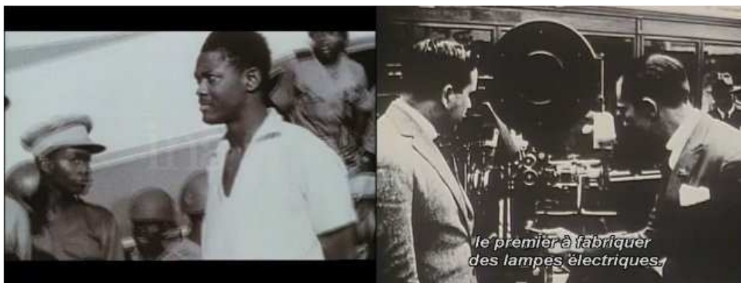
Film d'archive dans Souleymane Cissé Film d'archive dans Oliveira, l'architecte

Dans les deux documentaires, ces images ont été extraites de films d'archives. Si nous suivons la définition de la citation 37 , rien ne nous permet de contredire le fait que les images d'archives puissent être des citations. Il n'est pas nécessaire que la personne qui filme ces événements soit un auteur de films, ni que ces images soient les passages d'une œuvre filmique, pour qu'il y ait citation. Il suffit simplement que ces images proviennent d'un film antérieur.