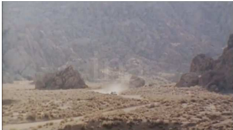
Boetticher Rides Again , Claude Ventura avec la collaboration de Philippe Garnier, 1995.