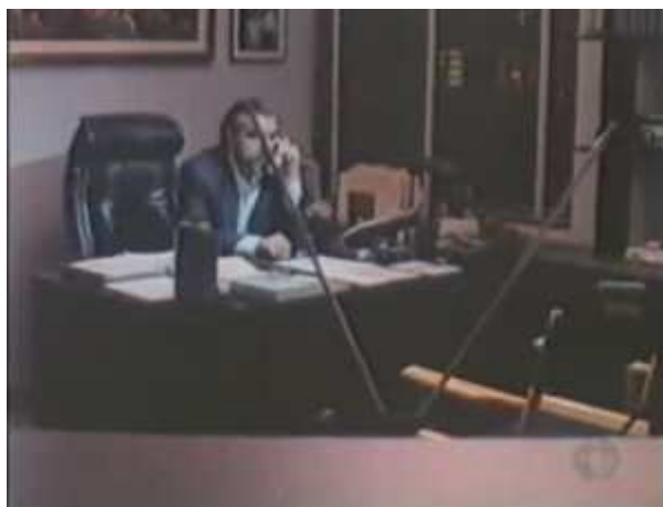
Martin Scorsese dans son bureau

changements. Le documentariste avertit le spectateur de la supercherie en soulignant fortement les traits fictifs du personnage. Ainsi, le public ne prend jamais le comportement de Jean-Pierre Melville ni certaines de ses actions comme des choses réelles et naturelles. Il regarde le documentaire avec un certain recul. Une image cinématographique, même quand il s'agit d'un documentaire, n'est pas réelle. Elle ne peut, tout au plus, qu'être une imitation des faits de la nature. Grâce à sa mise en scène, André S. Labarthe rappelle donc ce fait au spectateur.