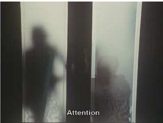
Plan 3 : citation