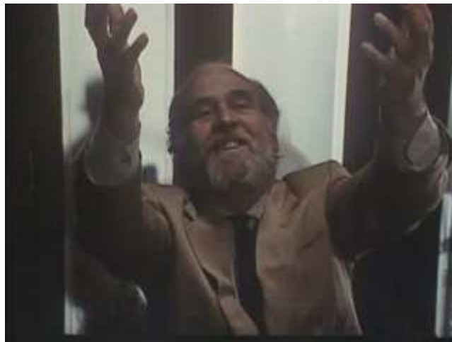
Plan 5 : citation

Marie-France Chambat-Houillon appelle ce type de reconstitutions, une « citation-performance » : « la répétition ne transite plus dès lors par la conservation de la matérialité initiale de l'œuvre citée, mais par une re-création de celle-ci, sous l'impulsion productive du contexte de l'émission. [...] La citation ne