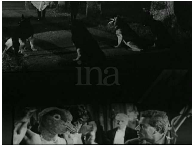
Georges Franju, le visionnaire, André S. Labarthe, 1996.