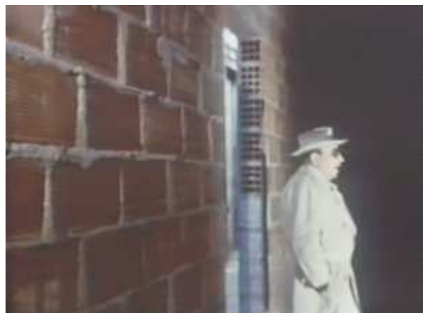
Personnage Jean-Pierre Melville

L'illusion s'insère dans la réalité : le documentariste filme un décor réel mais le personnage est "fictif". De cette manière, le réalisateur montre