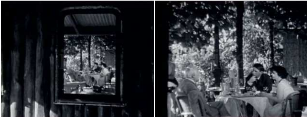
Avant le zoom