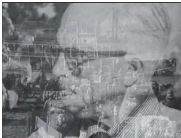
Fondu enchaîné dans King Vidor entre un extrait d' Hallelujah et un plan sur King Vidor

temps, un film sur King Vidor et un film de King Vidor. De plus, le fondu enchaîné lie les deux séquences, comme une conséquence ( Hallelujah ) qui se rattache à sa cause (King Vidor).