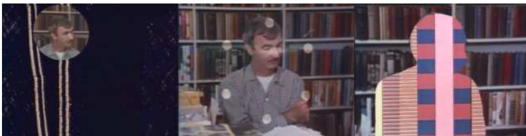
Différents assemblages entre la citation et le témoignage de Norman McLaren dans Né en 1914, Norman McLaren .

Né en 1914, Norman McLaren , par exemple, détruit les limites entre les plans. Les images ne cessent de se superposer les unes aux autres. Les films de Norman McLaren sont au second plan tandis que le cinéaste témoigne dans un rond au premier plan. Plus tard, l'effet s'inverse. C'est Norman McLaren qui est au second plan et des extraits de films au premier plan. Ou alors la bande son du film s'invite sur les plans sur le cinéaste étudié et inversement. À un moment, un extrait de film est même diffusé sur la silhouette du réalisateur. La citation et le témoignage ne sont plus seulement des images liées entre elles, elles sont mélangées et assemblées dans un même plan. Mais bien qu'elles s'interpénètrent comme s'il n'y avait jamais eu de barrière entre elles, le spectateur arrive toujours à distinguer le témoignage de la citation dans le plan. Leurs fonctions, totalement différentes l'une de l'autre, ne changent pas. Ce sont deux matériaux qui peuvent cohabiter dans un même plan. Ils ne sont pas contradictoires. C'est pourquoi nous ne pouvons pas dire que les fonctions des deux matériaux fusionnent, et qu'elles créent quelque chose d'autre dans l'image. Il y a toujours à la fois une citation et un témoignage dans ce type de plan.