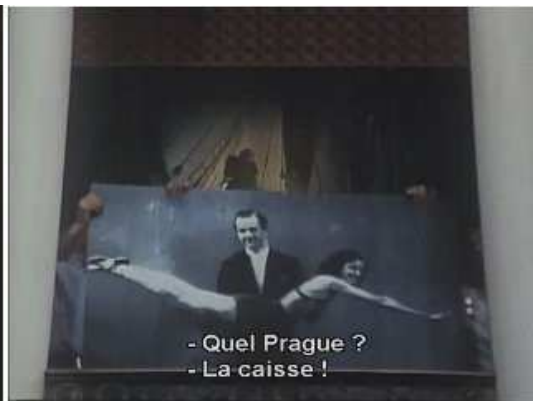
Plan 4 : citation