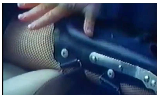
Gros plan sur un écran de télévision qui diffuse un extrait de Crash

Lorsque la caméra fait des gros plans sur les écrans de télévisions, elle rend palpable les idées développées dans les extraits de films. André S. Labarthe conçoit son documentaire comme un corps où la