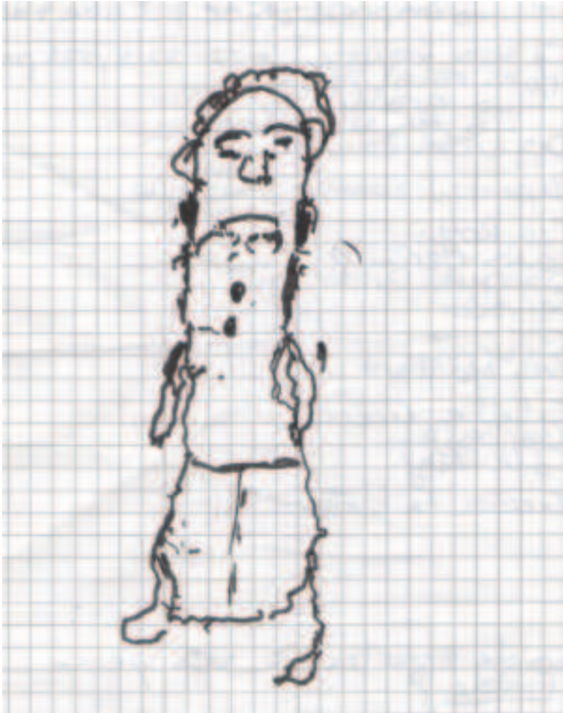
ANNEXE 2 : Fin de séance après le massage du dos avec une balle.