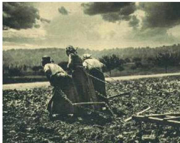
Femmes au travail dans un champ

Les femmes font preuve de volonté et de courage devant le travail agricole à réaliser : « Malgré l'adversité, les bras qui brûlent à force de travail, les journées interminables de la terrible moisson, rien, et surtout pas l'éloignement ou le défaut, ne peut interrompre la tâche 19 ». Le travail dans les champs demeure particulièrement difficile, comme nous pouvons le remarquer sur cette photographie 20 où nous voyons trois femmes tirant avec peine une charrue :