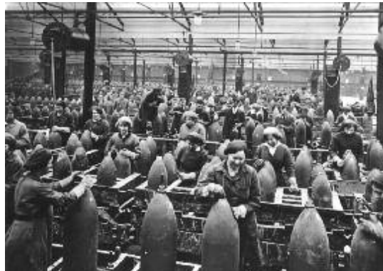
Femmes travaillant dans une usine d'armement

Les fonctions remplies par les femmes sont multiples: « [...] elles sont nombreuses dans la fabrication des obus, celle des cartouches, grenades, fusées, d'où leur surnom de munitionnettes 32 ». La photographie ci-dessous montre les nombreuses ouvrières de l'armement 33 qui travaillent à la chaîne et debout :