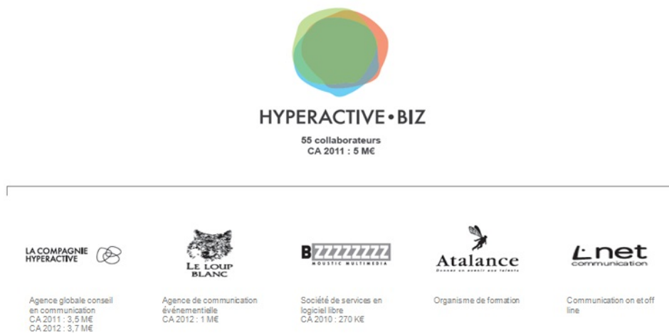
Fig 1: le groupe Hyperactive.biz

L'agence et ses collaborateurs et filiales forment aujourd'hui le groupe « Hyperactive.biz », qui comptabilise en 2012 un chiffre d'affaire d'environ 5 millions d'euros.