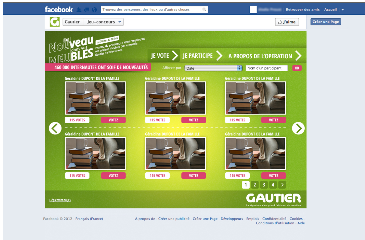
Fig 3 : Maquette du jeu concours portant la mention du nombre d'internautes ayant aimé ce jeu

Mais plus que cela, c'est un sentiment d'appartenance que ce simple chiffre fait naître chez l'utilisateur. Le simple fait de savoir que quelques centaines ou milliers de personnes ont réalisés les mêmes actions que soit nous fait automatiquement et inconsciemment appartenir à un groupe délimité. Dans une société individualiste, comme nous avons pu le voir précédemment, une telle information est capitale pour un internaute. D'où l'importance de savoir utiliser ces données créées par les « lifeloggeurs » et surtout de réussir à les mettre en scène pour créer la meilleure expérience utilisateur possible.