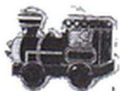
a toy : a train