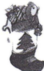
a Christmas stocking