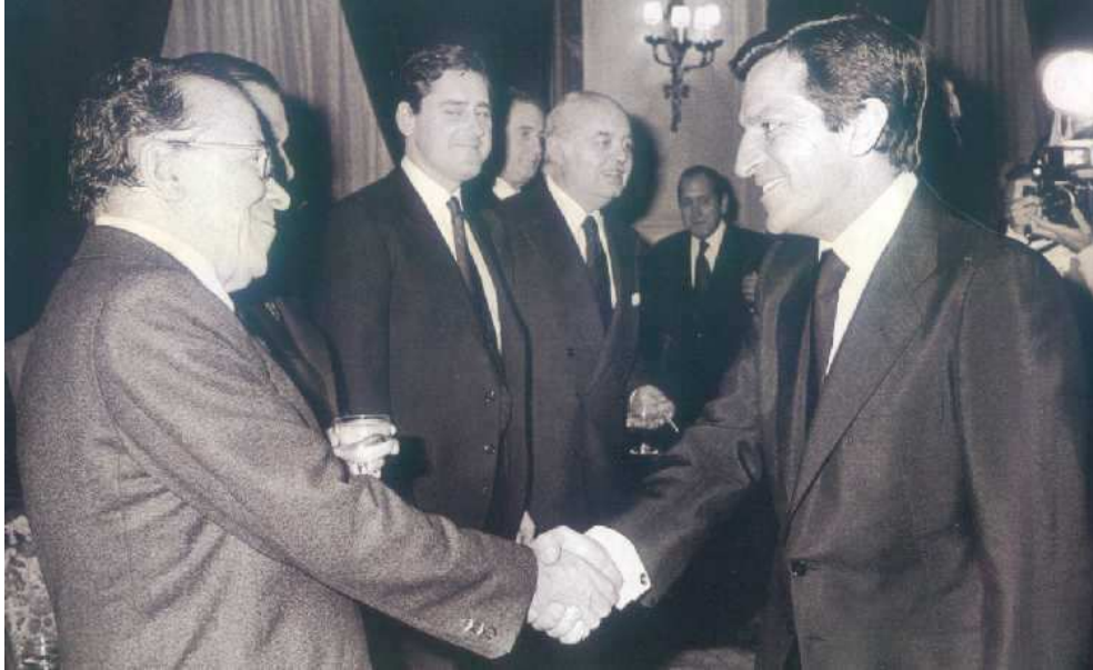
Ilustración 3 El consenso político durante la Transición 102