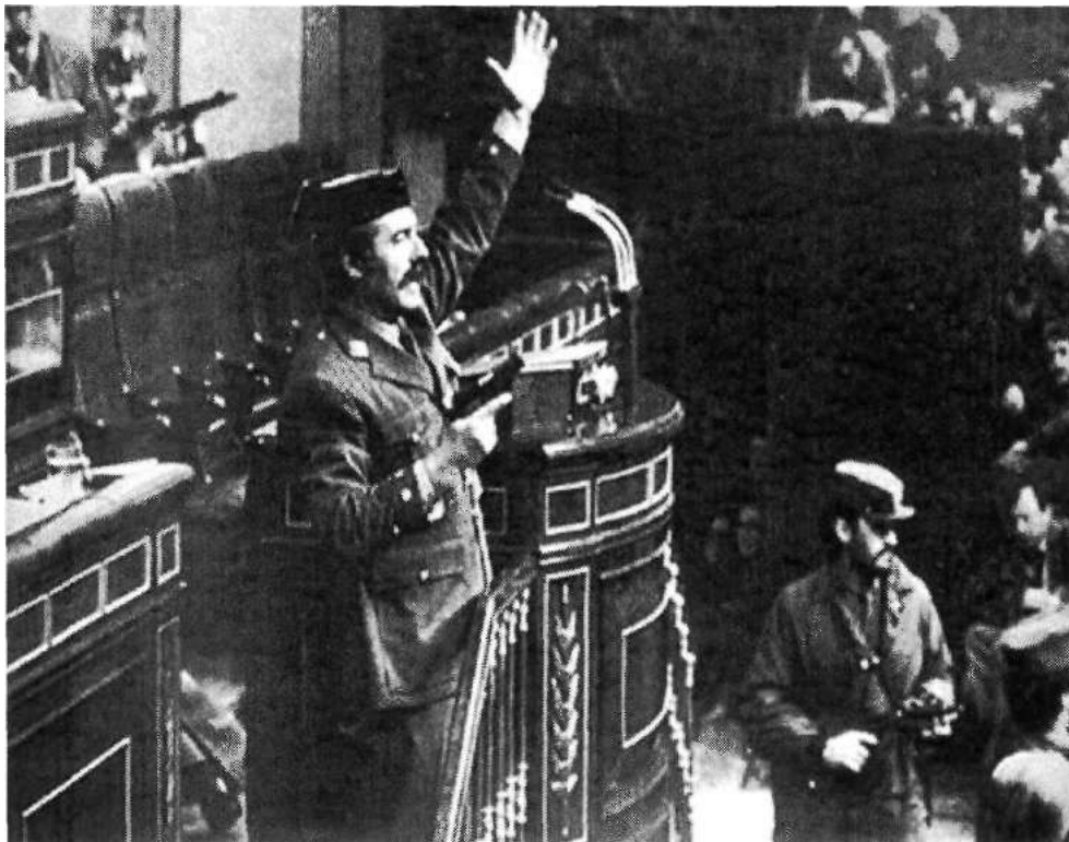
Ilustración 2 Tejero durante el intento de golpe de estado de 1981 101