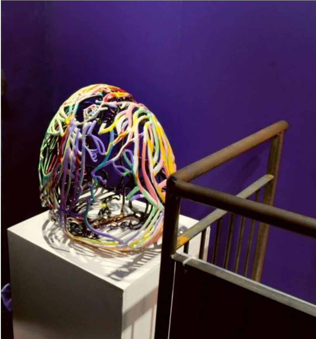
Annexe 12 Ghada Amer, Baisers #1 , 2011.