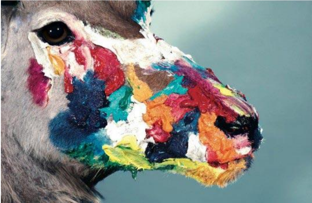
Annexe 6 Maurizio Cattelan, Immagine , 2011.