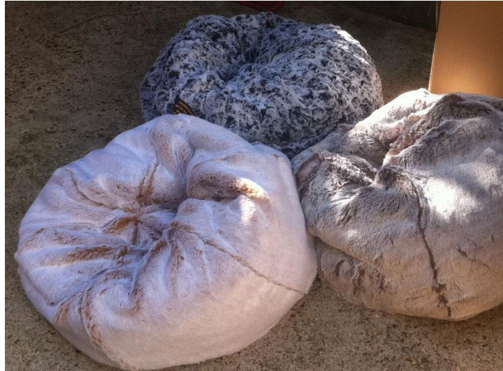
Annexe 13 Florence Doléac, Doudoucho Show , 2011.