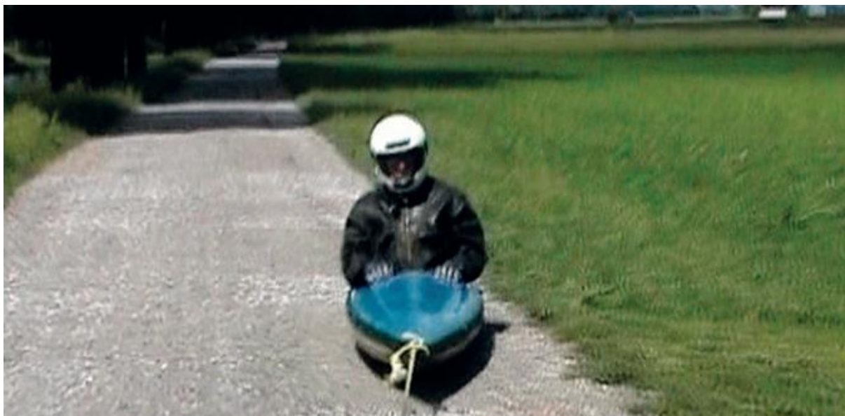
Annexe 17 Roman Signer, Kayak , 2011, vidéo (5 min 5 sec.).