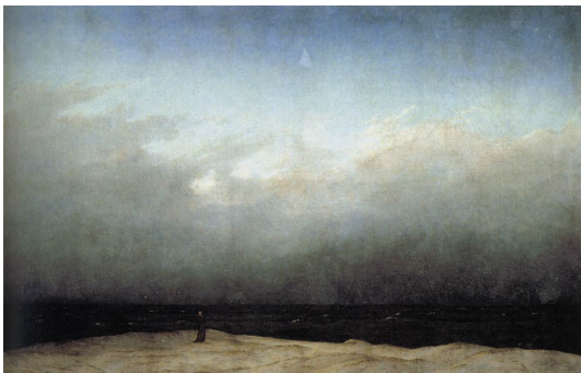
Moine au bord de la mer , C.D. Friedrich