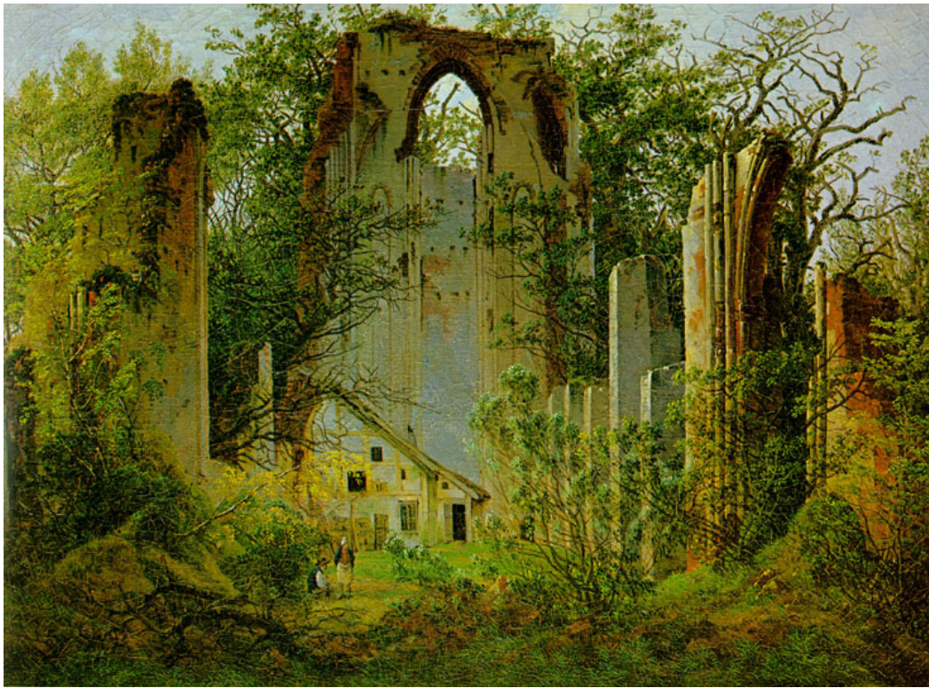
Ruine d'Eldena , C.D. Friedrich (1806)