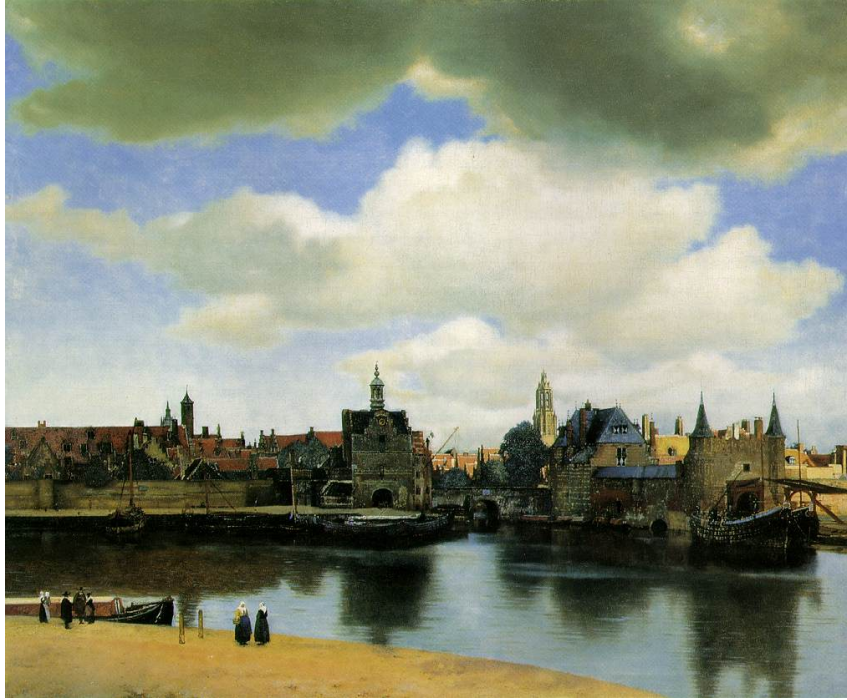
Vue de Delft , Jan Vermeer (1659-1660)