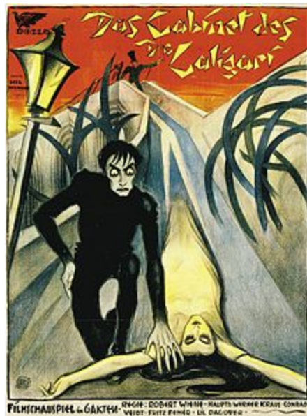
Le Cabinet du Dr. Caligari (Robert Wiene, 1920)