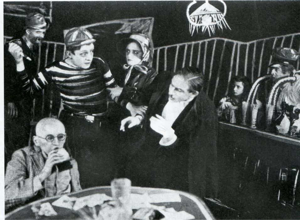
De l'aube à minuit (Karl-Heinz Martin, 1920)