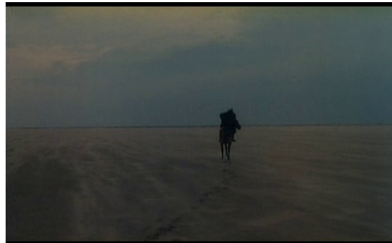
La chevauchée finale de Jonathan-Dracula