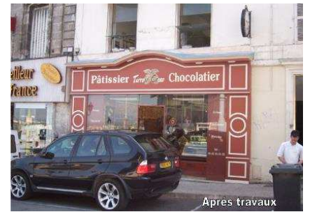
Illustration 11: Devanture commerciale avant et après travaux à Angoulême, ©Territoires Charente SAEML