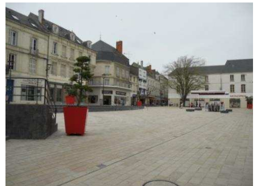
Illustration 10: Place Émile Zola, Châtellerauld avant et après réhabilitation