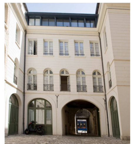
Illustration 13: 132, grande rue avant et après intervention de la SEMAD

En ce qui concerne l'OPAH-RU, la mission de « suivi-animation » a été confiée à la SEMAD. Celle-ci est chargée de :