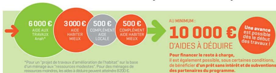
Illustration 8: Détail des aides sur un exemple de projet de travaux d'amélioration d'un montant de 12 000€ HT

Par exemple, un propriétaire peut bénéficier d'un montant d'aides de 10 000€ pour un projet de travaux d'amélioration de 12 000 euros HT, le schéma suivant permet de mieux comprendre le mécanisme.