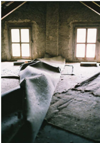
Illustration 4: Précarité énergétique

En cheminant dans les centres on s'attend à trouver des rues propices à la promenade avec une architecture de qualité et des bâtiments relativement bien entretenus. Cependant, dans certaines villes, on constate que ces quartiers sont au contraire dégradés et peu accueillants. C'est pourquoi, les collectivités réfléchissent à des programmes de réhabilitation. Des outils sont dédiés au renouvellement urbain et à la rénovation* des immeubles dégradés. Ces interventions permettent de détecter et de localiser des problèmes majeurs en matière de logement sur le territoire, parfois cachés derrière de jolies façades. Des diagnostics mettent en avant notamment les problèmes de vacance* des commerces et des logements, d'insalubrité, d'habitat précaire, indigne ou très dégradé et les marchands de sommeil. De plus, du fait de la configuration physique des lieux, il y a parfois un manque d'ouvertures et d'ensoleillement, ce qui rend encore plus difficile leur location, c'est le cas du centre de Bayonne.