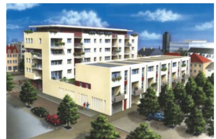
Illustration 15: ZAC Casquettes-Franklin