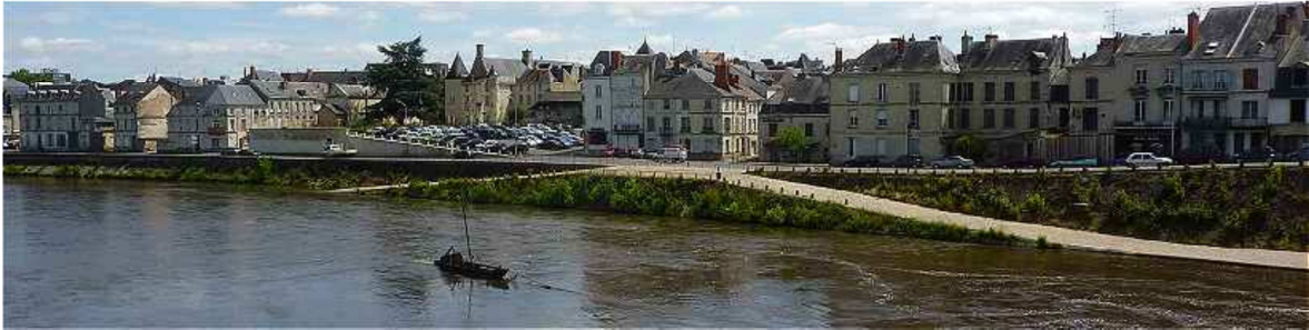
Illustration 9: Quai Napoléon Ier et Quai du Château avec l'îlot des Cordeliers à droite, îlot dans lequel des immeubles sont concernés par des ORI

principalement l'extérieur des bâtiments et surtout le ravalement des façades en se basant sur la ZPPAUP qu'elle a elle-même mise en place. Une aide communale au ravalement de façades 36 ainsi que les subventions de l'OPAH-RU viennent aider les propriétaires dans leurs obligations de travaux. Les moyens limités de la SEP ne lui permettront pas de poursuivre les procédures d'ORI jusqu'à l'expropriation. On s'aperçoit que les capacités financières des opérateurs limitent significativement l'efficacité des ORI.