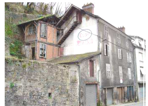
Illustration 12: Immeuble insalubre à Tulle