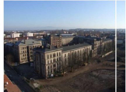
Illustration 17: ZAC Lefebvre

La SERM 68 s'occupe du portage foncier et immobilier des opérations et du suivi-animation de l'OPAH-RU et de l'ORI. Elle recherche des investisseurs pour racheter les immeubles acquis à l'amiable ou sous procédure d'expropriation. Ce projet de renouvellement s'articule avec la réalisation du tram-train qui doit desservir le centre-ville, et rendra les quartiers plus attractifs.