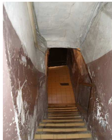
Illustration 6: Parties communes dégradées à Marseille

L'OPAH « copropriété » a été mise en place par la circulaire du 7 juillet 1994 , elle vise à requalifier les ensembles immobiliers en copropriété confrontés à des difficultés d'ordre technique, sociale ou financière. Par exemple elles visent les installations vétustes qui peuvent présenter un risque pour la santé et la sécurité des occupants et dont les copropriétaires ne peuvent financièrement pas assumer les travaux. C'est un outil de prévention ou de curetage des copropriétés en difficulté. Les travaux peuvent porter sur plusieurs immeubles pour un traitement global, sur les parties communes (depuis 2001) et privatives, cependant seuls les travaux sur les parties communes peuvent bénéficier d'une aide financière de l'ANAH, c'est le syndicat des copropriétaires, maître d'ouvrage, qui la reçoit.