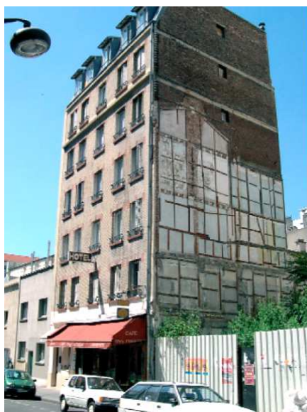
Illustration 18: Hôtel Meublé, Paris 10ème (70 chambres)

Dans les grandes agglomérations comme Paris ou Marseille, les hôtels meublés constituent un habitat social de fait, où les personnes en situation précaire ou dans l'illégalité sont logées à bas prix, souvent dans de mauvaises conditions de salubrité. Ces immeubles sont généralement dégradés et impropres à l'habitation. La multiplication de ce type d'habitat met en exergue le manque de logements sociaux dans les grandes villes.