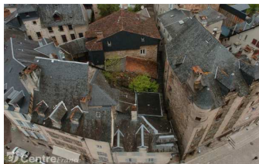
Illustration 3: Quartier de Trech à Tulle, un exemple de densité du bâti

La morphologie si particulière des centres limite leur adaptation aux modes de vie modernes et leurs perspectives d'évolution. Des moyens de circulation alternatifs doivent alors être étudiés (tramway, réseau de bus, circulation à vélo et piétonne,...) de façon à limiter la circulation et le stationnement des véhicules. Ces moyens de transport alternatifs facilitent le déplacement et améliorent la qualité de vie des résidents (moins de bruit, moins de pollution, plus de tranquillité,...).