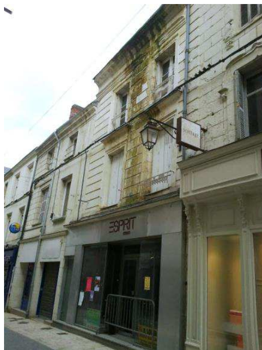
Local commercial et logements vacants, façade et logements dégradés en centre-ville

Le tableau suivant reprend les outils qui peuvent être utilisés en fonctions de la politique envisagée et des situations rencontrées.