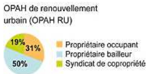
Illustration 7: Types de bénéficiaires des aides des OPAH-RU en 2010

Les propriétaires d'immeubles compris dans le périmètre d'une OPAH-RU ont le droit à des subventions pour restaurer leurs immeubles. Ces dernières contribuent à déclencher une dynamique de réinvestissement des propriétaires privés. Le graphique ci-contre met en avant un fort pourcentage de propriétaires bailleurs bénéficiaires des subventions d'OPAH-RU cela s'explique par le nombre important de logements en location dans les centres et par le fait qu'ils ne sont pas limités par des conditions de ressources.