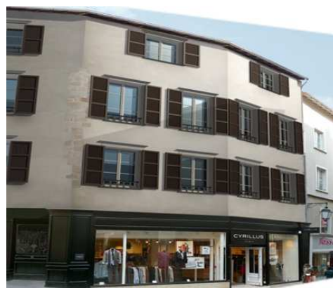
Illustration 14: Logements rénovés situés au-dessus des commerces à Limoges

En 2009, 120 logements sur 500 ont été traités avec l'OPAH-RU (2003-2008). Le PRI (2002-2007) a concerné 42 immeubles soit 160 logements. Le coût global des opérations était de 19 millions d'euros dont 11 millions ont été pris en charge par les propriétaires, 6 millions par la ville, 1 million par l'Etat (aides aux propriétaires bailleurs et FISAC), 1 million (ANAH, CCI, Chambre des métiers). 35 baux commerciaux ont été renégociés et il n'y a eu aucune expropriation, ce qui est important car les expropriations ont un coût pour la collectivité. La SELI a calculé qu'il suffirait de 3 ans pour que la ville récupère son investissement grâce à la taxe d'habitation qui pourra être récoltée une fois les logements occupés.