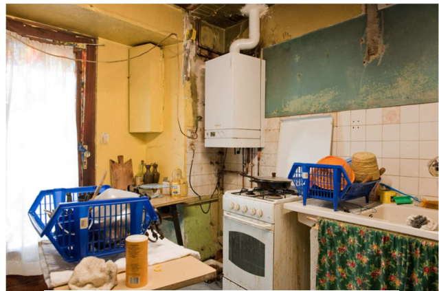
Illustration 5: Habitat indigne

Les immeubles se dégradent par manque d'entretien. Soit les propriétaires occupants ou bailleurs des centres n'ont pas les moyens financiers de réaliser des travaux, soit dans le cas de propriétaires bailleurs « malveillants », ils n'investissent pas dans des travaux de restauration, privilégiant les revenus des loyers au bien-être de leurs locataires.