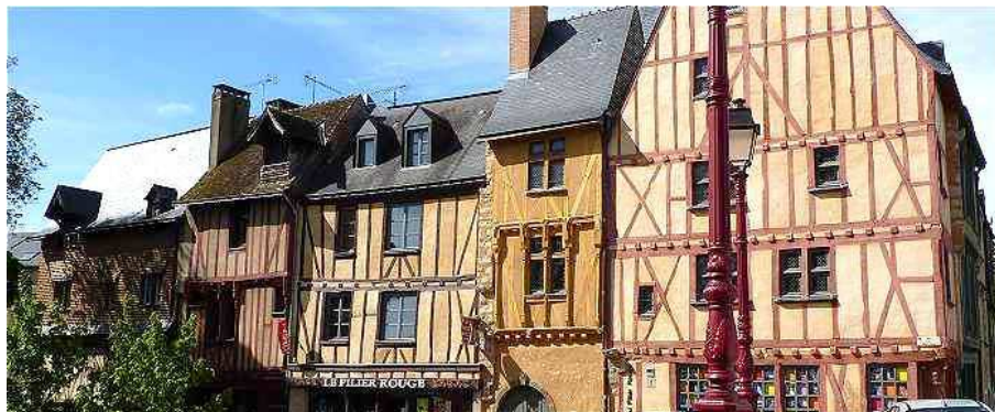
Illustration 2: La Grande Rue – La Maison au Pilier Rouge, Le Vieux Mans