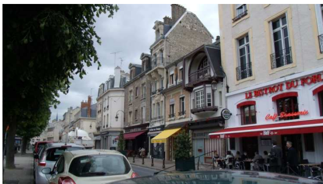
Illustration 20: Boutiques de la place du Forum à Reims

Pour faire revenir la population dans les centres et les redynamiser, il est important que les collectivités misent sur l'organisation d'événements culturels et d'animations commerciales en partenariat avec les commerçants et les associations. Ces animations peuvent être des marchés de Noël, des braderies, des expositions, des festivals, des marchés hebdomadaires,... L'objectif est de donner un nouvel élan aux commerces de proximité en faisant venir ou revenir du monde dans les rues du centre-ville dans l'espoir d'augmenter la zone de chalandise de ces commerces. Reims a redonné une fonction d'animation et de proximité à son centre ancien, en favorisant l'installation de boutiques autour de la Place du Forum datant de l'époque gallo-romaine. Elle met en place pendant toute la période estivale des festivités gratuites sur les places de la ville, c'est ce qu'elle appelle « un été dans la ville ». De son côté Strasbourg offre un marché de Noël unique en Europe qui s'étend sur 35 jours. La durée et la fréquence des événements sont des éléments importants.