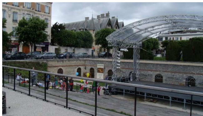
Illustration 21: Festivités d'été à Reims, Place du Forum

Pour animer un quartier, l'écoute des commerçants et des associations est constructive, il est recommandé de programmer périodiquement des réunions entre les représentants des commerçants et la municipalité pour planifier et organiser conjointement des actions. La municipalité se doit d'aider et d'épauler les commerçants dans l'organisation des manifestations, mais aussi au niveau logistique et promotionnel. Ces animations doivent aussi être favorisées par des investissements sur les espaces publics pour accueillir au mieux les visiteurs et la population (requalification des rues, réhabilitation de places, parkings,...). Un manager de centre-ville peut très bien intervenir pour aider les collectivités et les commerçants à mettre conjointement en œuvre de tels événements. Il ne faut pas oublier d'allier ces animations à une communication efficace, des associations comme « les vitrines de Roanne » proposent des formations dans le domaine de la communication et des animations commerciales et les aident dans leur réalisation.