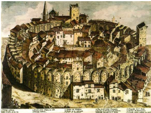
Illustration 1 : Les arènes d'Arles loties au XVIII ème siècle ©Carte postale d'une gravure scannée par Robert Schediw

L'identité des centres anciens des villes tient dans leur histoire, nous citerons ici le propos de la Commission des Monuments Historiques, en 1992 : « Les quartiers anciens résument et identifient les villes. Si Poitiers n'est pas Nancy, si Dieppe n'est pas Bayonne, ce n'est pas grâce à leurs banlieues, à leur ZUP ou à leurs lotissements, mais bien grâce à leur centre. ». Au fur et à mesure des époques les centres des villes ont évolué, ils ont peu à peu changé de fonction et d'importance. Les zones existantes ont constamment été réinvesties en préservant plus ou moins les monuments datant des époques antérieures. Certaines villes ont été reconstruites sur elles-mêmes pour s'adapter aux besoins des populations. C'est ainsi que dans une même ville l'on peut retrouver des vestiges romains, des constructions datant du Moyen-Âge, des œuvres de la Renaissance, des ouvrages du XIX ème siècle ou encore de l'époque contemporaine.