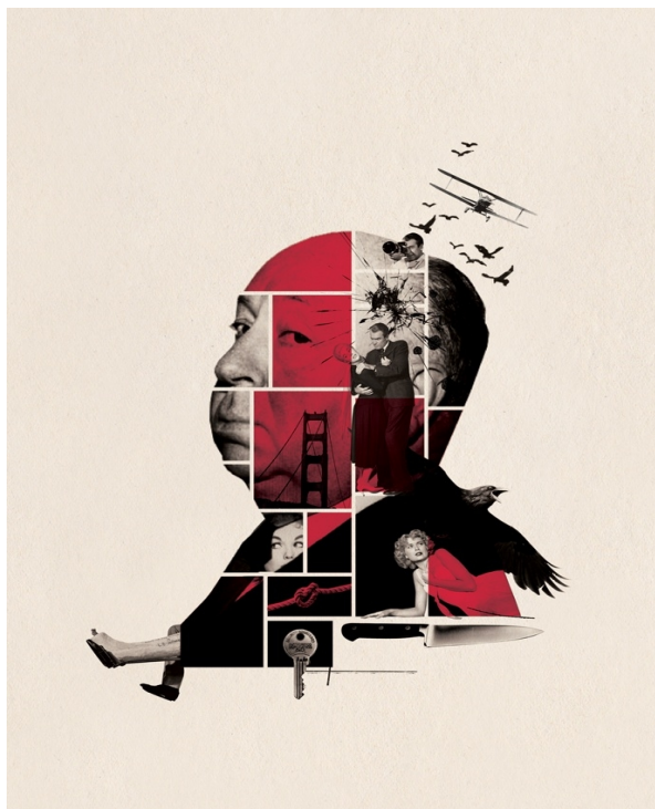
« Alfred Hitchcock : The psycho genius of Hollywood », couverture d'un numéro du daily beast.