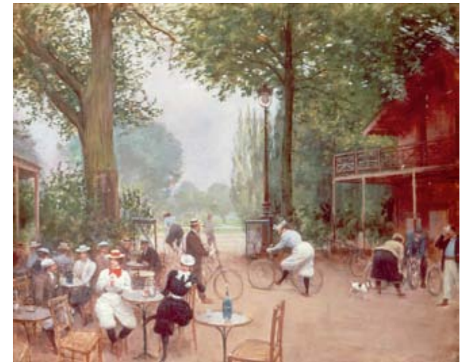
Jean Béraud, Le Chalet du cycle du Bois de Boulogne , 1901-1910, huile sur toile, 53,5 cm x 65 cm, Musée Carnavalet, Paris

Cette tradition du trousseau qui prit fin au XIX ème siècle par l'impudeur de cette exhibition publique, révélera au grand jour d'autres parades des hommes pour garder les femmes sous contrôle.