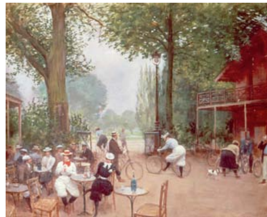
Jean Béraud, Le Chalet du cycle du Bois de Boulogne , 1901-1910, huile sur toile, 53,5 cm x 65 cm, Musée Carnavalet, Paris

Cette tradition du trousseau qui prit fin au XIX ème siècle par l'impudeur de cette exhibition publique, révélera au grand jour d'autres parades des hommes pour garder les femmes sous contrôle.