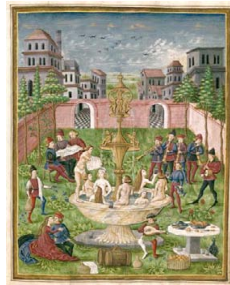
MS. Lat. 209 DX2 14 c. 10 r De Sphaera : Le jardin des amours ou La fontaine de Jouvence , Attribué à Cristoforo de Predis, Milan, vers 1440 - avant 1486, enluminure, Biblioteca Estense, Modène

Cette pensée de protection du corps se voit notamment avec le développement de la chevalerie. Les armures en métal, lourdes et contraignantes, blessaient le corps si il n'était vêtu que d'une simple chemise. Dans un écrit de 1995 s'attaquant au costume du XIIIe siècle, nous retrouvons une parfaite explication de l'apparition de la culotte : « Quelle que soit leur forme, casques et armures, ne peuvent être portés sur une simple chemise de toile. D'abord appelé 'gambason' ou 'auqueton', selon qu'il est fourré de bourre de chanvre