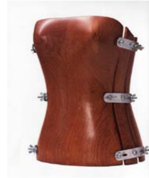
Hussein Chalayan Corset

Griffe : (ruban en coton blanc) Printemps/Été 1997