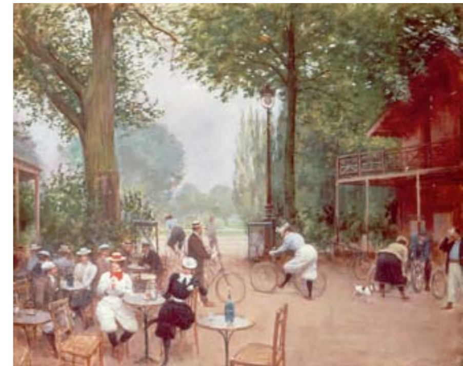
Jean Béraud, Le Chalet du cycle du Bois de Boulogne , 1901-1910, huile sur toile, 53,5 cm x 65 cm, Musée Carnavalet, Paris

Cette tradition du trousseau qui prit fin au XIX ème siècle par l'impudeur de cette exhibition publique, révélera au grand jour d'autres parades des hommes pour garder les femmes sous contrôle.