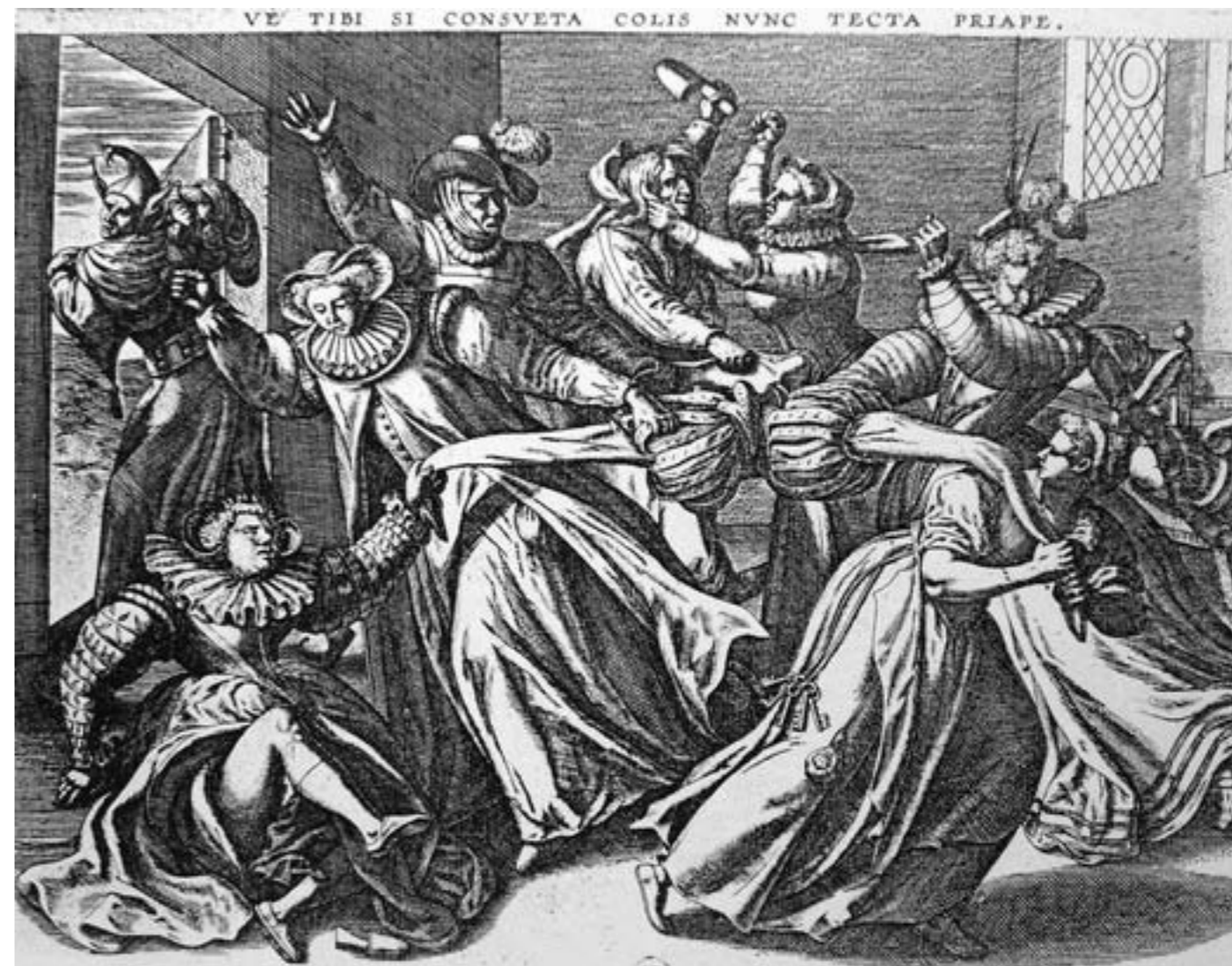
Anonyme, Combat de sept femmes pour la culotte , Paris, fin du XVI e s., Paris, BNF

L'un des premiers à s'être interrogé sur ces gravures du XV ème siècle, ayant pour thème la lutte pour la culotte, fut Aby Warburg qui reconnut dans ces images un passage biblique malgré la différence du nombre de femmes entre l'image que nous venons de voir et le récit d'Isaïe. « Le prophète y clame que la Jérusalem