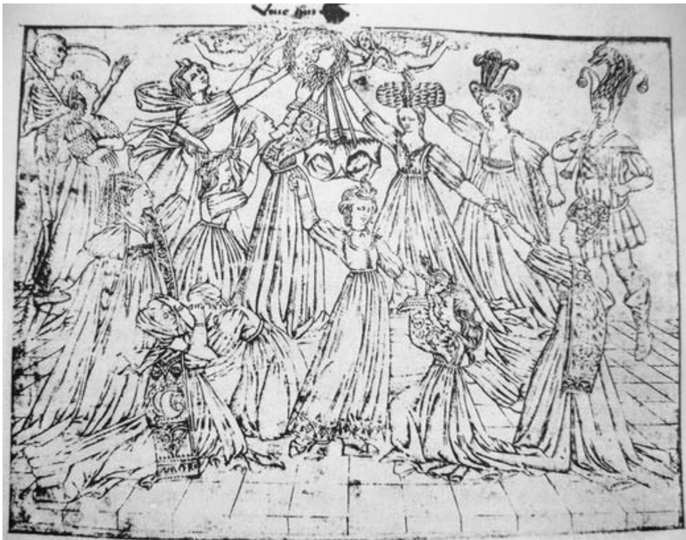
Baccio Baldini, Lutte pour la culotte . Florence, av. 1464. Munich, Staatliche Graphische Sammlungen

des distinctions sociales. Il souligne le pouvoir égalisateur de la mort. Dans ces fresques, toutes les strates de la société moyen-âgeuse y sont représentées dans une danse partagée avec les morts. Morts et vivants sont donc là pour faire une critique d'une société hiérarchisée dont la pratique du pouvoir en est la première cause. Cette apparition de la mort comme un thème de prédilection dans le Moyen-Âge trouve un même sens dans les gravures satiriques du port de la culotte. En effet, on tend à représenter la vanité humaine dans cette course à la reconnaissance sociale. D'ailleurs, cet appel à la mort pour démontrer cette recherche de reconnaissance donnera plus tard ce courant pictural de la vanité dont le crâne humain est le symbole.