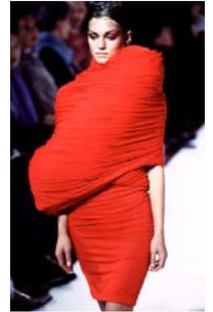
Rei Kawakubo Robe

Griffe : (marque courbée) P'Ben 95 Automne/Hiver 1995