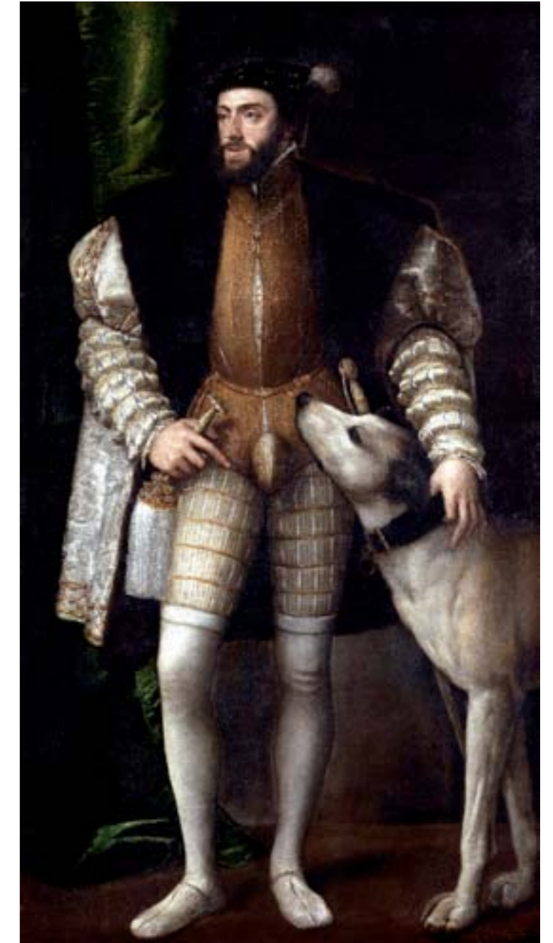
Titien, Portrait en pied de Charles Quint et son chien , 1533, Musée du Prado, Madrid, huile sur toile, 192 x 111 cm

Si nous regardons l'exemple de cette toile de Titien, nous pouvons déjà constater la similitude du costume de la Renaissance avec la description des dessous chevaleresques. Mais ce qui nous intéresse ici, et c'est ce qui fera la particularité de la culotte masculine, c'est ce marquage de la virilité masculine. La culotte, à cette époque-ci va servir de support à la braguette. Ce vêtement constitué de tissu rembourré se place par-dessus la culotte. Il faut savoir que jusqu'à la fin du XIX ème siècle la culotte reste fendue à l'entre-jambe. Donc, en plus de la nécessité de dissimuler cette fente, elle permet aussi de mettre en avant ce symbole de pouvoir évident