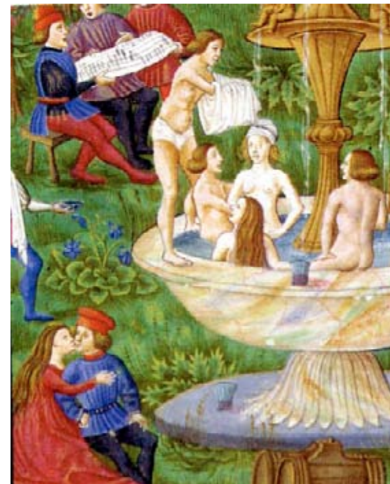
MS. Lat. 209 DX2 14 c. 10 r De Sphaera : Le jardin des amours ou La fontaine de Jouvence (détail), Attribué à Cristoforo de Predis, Milan, vers 1440 - avant 1486, enluminure, Biblioteca Estense, Modène