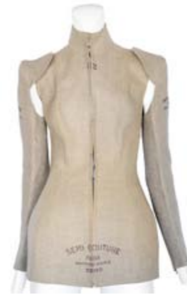
Martin Margiela Veste

Hiver 1995, composé de quatre pièces en bois attachées par des boulons en métal. Fini le temps des tissus brillants, luxueux... Durant cette décennie, on défait le corps de son appareil érotisant et de son aspect lisse et sans défaut. La femme éprouve une lassitude du jeu de séduction qui s'est déroulé durant les vingt années précédentes. Mais ceci marque peut-être aussi cette frustration face à un genre masculin ayant un désir en déclin depuis moins d'un siècle.