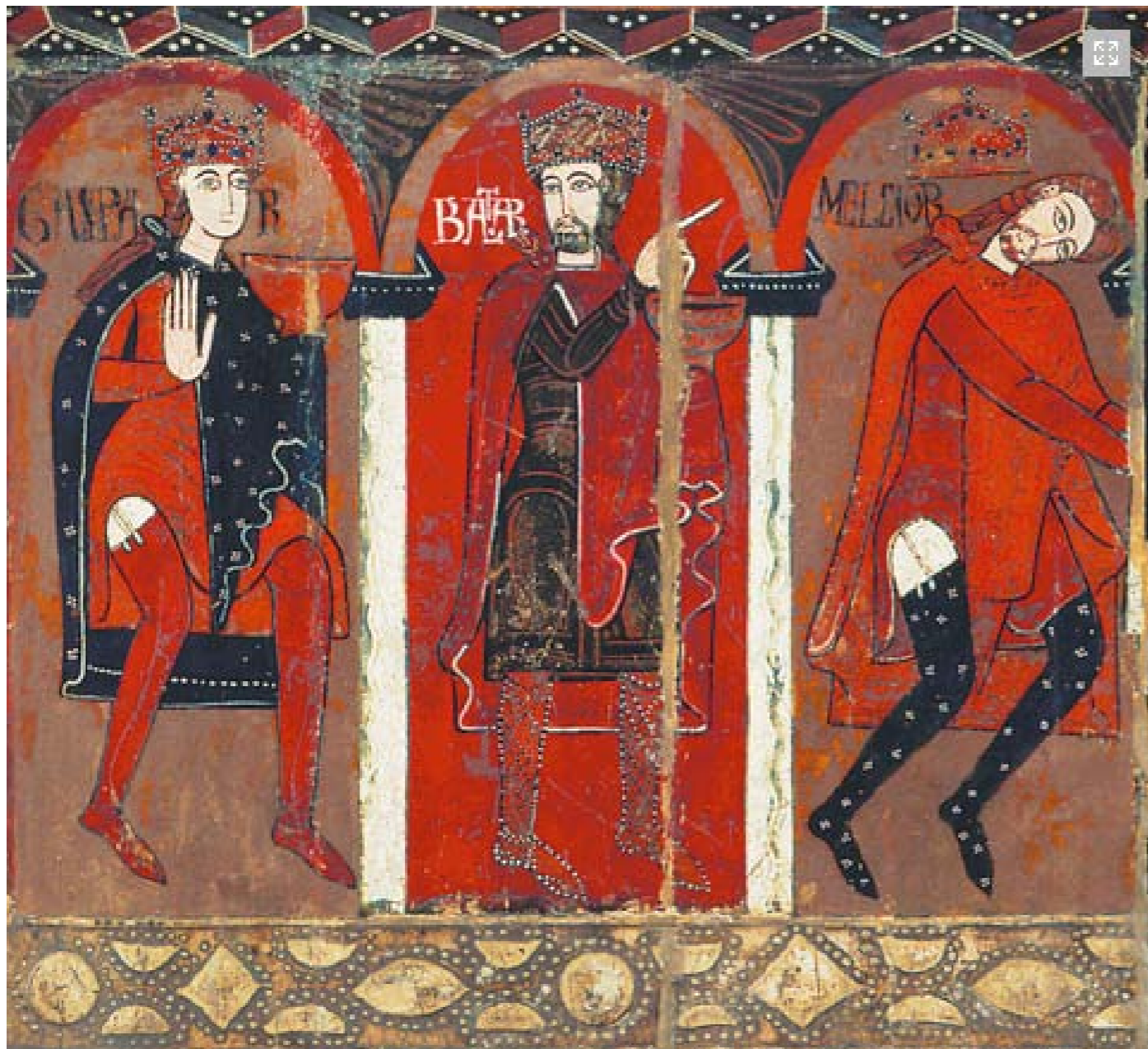
Anonyme, Devant d'autel de Saint Vincent d'Espinelves, vers 1187, tempera sur bois de peuplier, 87,5 x 147 x 8 cm, Musée Episcopal de Vic, Vic, Catalogne, Espagne

ou de coton, il est nommé ensuite 'pourpoint', c'est-à-dire 'surpiqué' (...) Compte tenu de l'ajustement des nouveaux types d'armures, ces vêtements doivent s'adapter étroitement à la forme du corps (...) En outre, les jambes sont protégées par de longues chausses de toiles fines ou de draps qui viennent s'attacher au pourpoint » 1 . Cette citation est d'autant plus intéressante qu'elle nous renseigne à la fois sur le port d'un seul et unique « sous-vêtement », au sens littéral du terme, mais aussi de son évolution dû aux exigences du costume guerrier. De plus, elle révèle cette volonté qu'ont eue les hommes d'aspirer à faire de leurs dessous, un linge de corps qui épouse au plus près la peau. Il est d'autant plus intéressant de le constater qu'aujourd'hui encore nous préférons cette « seconde peau » à un vêtement trop large. Et pour finir, elle confirme ce que nous avons avancé précédemment sur les jarretelles faisant le lien entre le bas, la culotte et le pourpoint.