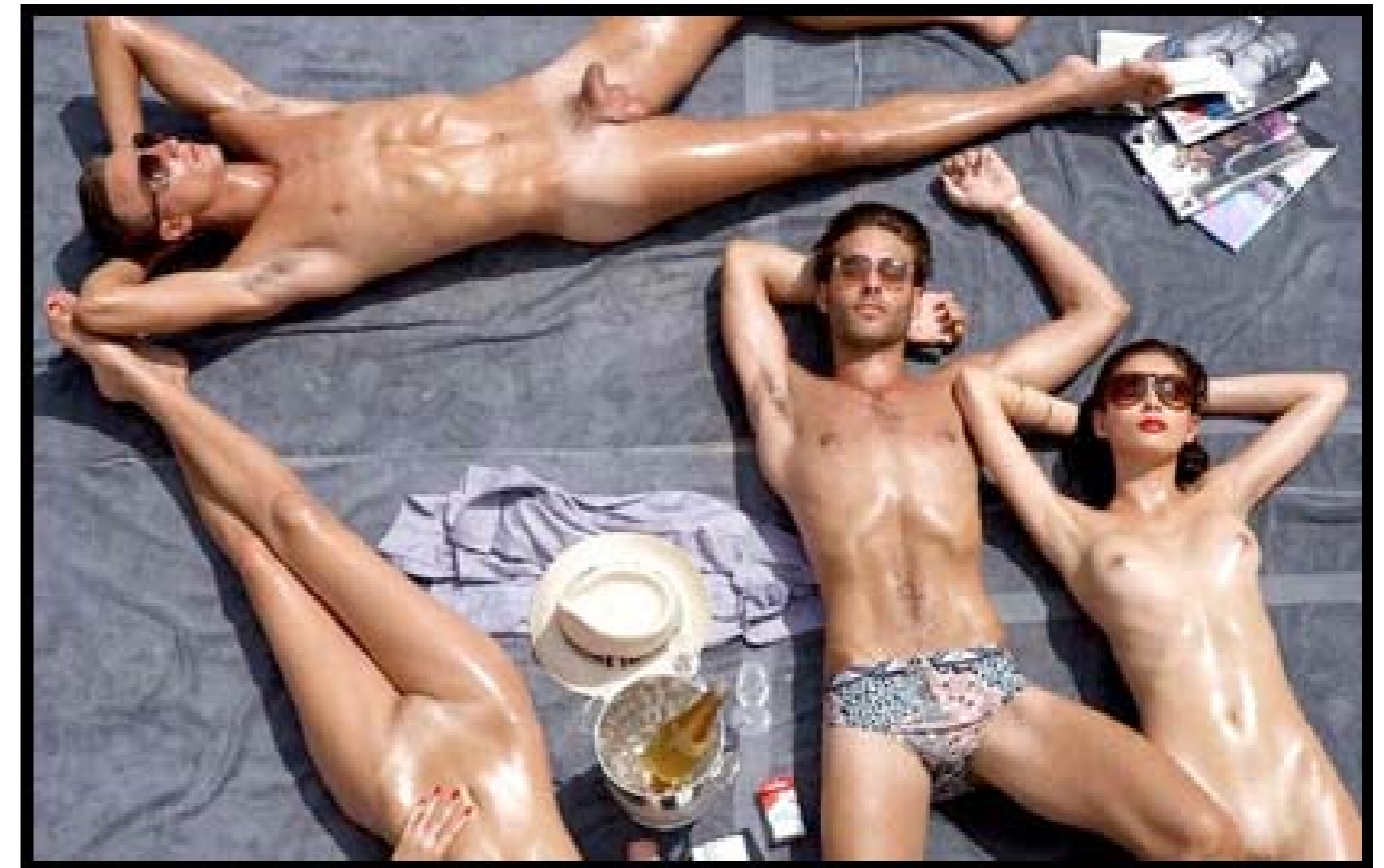
Terry Richardson, Campagne publicitaire pour Tom Ford, printemps/été 2008