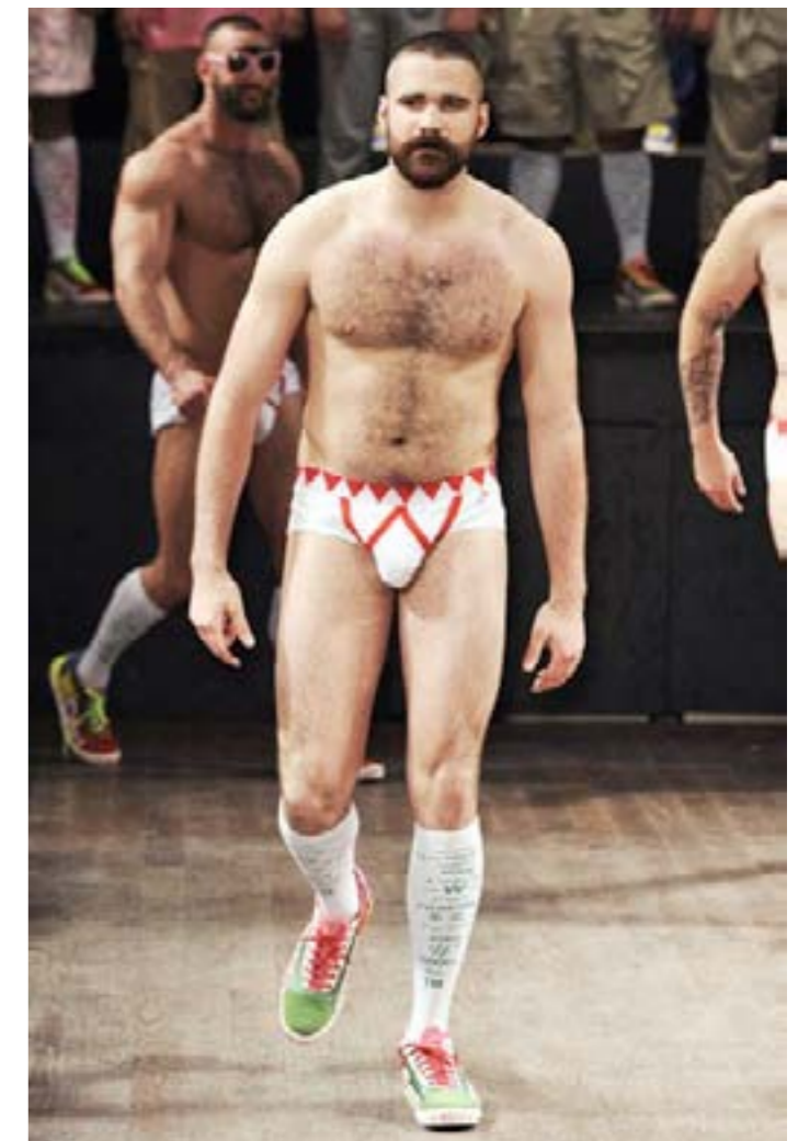
Fin du défilé Printemps/Été homme 2010 de Walter Van Beirendonck

Finalement, la démonstration de toute virilité passe