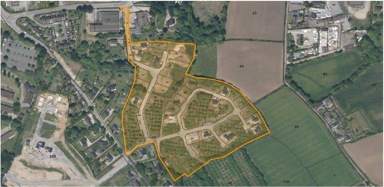
Photo aérienne du site (sources : Portail Géofoncier, Géoportail IGN / Sans échelle)