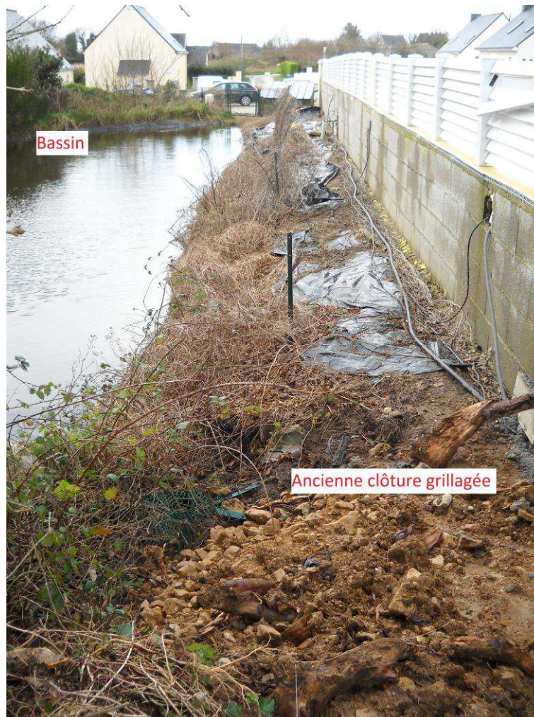
Prise de vue à l'arrière du bassin en février 2013