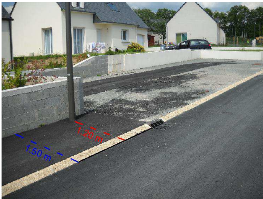
Exemple d'un rétrécissement du cheminement piétonnier dû à la présence des candélabres

Or il s'avère qu'à différents endroits du lotissement, cette largeur n'est pas respectée par la présence des candélabres sur le cheminement. Ainsi, les trottoirs initialement prévus à 1.50 m de large se retrouvent par endroit réduits à 1.20 m. La norme d'accessibilité PMR n'est pas respectée. Le chantier a donc été stoppé en avril 2013.