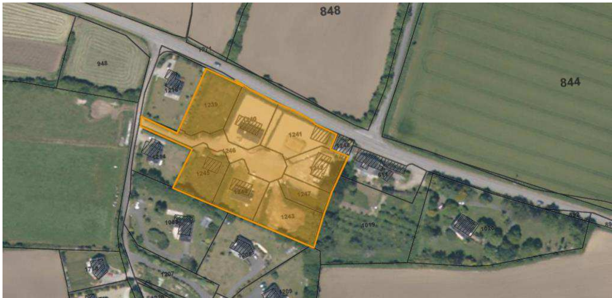
Photo aérienne du site (sources : Portail Géofoncier, Géoportail IGN / sans échelle)

L'opération, située au sein d'un hameau sur la commune d'Elliant, ville du pays de Quimper, s'étend sur une superficie de 8300 m 2 . Après diverses études, un projet de création de sept lots à bâtir a été déposé en mairie.