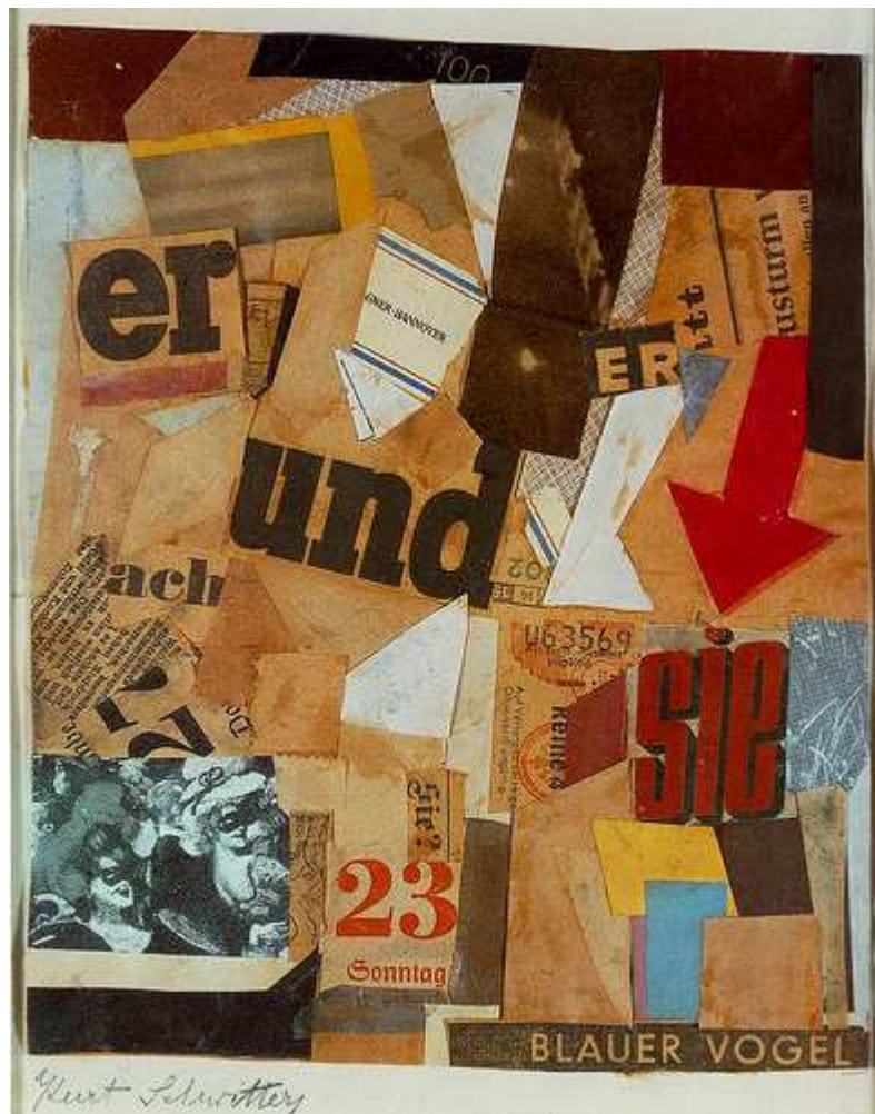
Bild 4- Kurt Schwitters, Blauer Vogel , 1922.

Die Collagetechnik wurde zuerst im Kubismus, dann im Dadaismus und noch später im Surrealismus oder in der Merzbewegung gebraucht. Weiter unten als Beispiel das Werk „Blauer Vogel“ (1922) des deutschen Merzkünstlers Kurt Schwitters (1887-1948), der in seiner Collage Buchstaben, Zeichen und verschiedene Papierstoffe gebraucht hat: