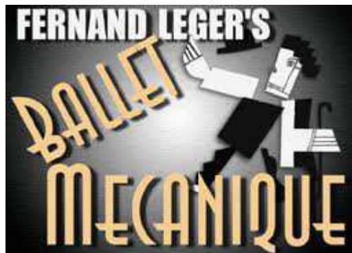
Bild 3- Fernand Léger, Ballet mécanique , 1924.

von Nur da wo du bist da ist nichts geht es um die Puppe Annette, die sich in einem Puppentheaterspiel vorstellt; sie spielt also die Rolle einer Frau, obwohl sie keine ist: „Wenn sie ein Mensch wäre, dann hätte sie doch einen Vater. Aber Annette ist von dem Uhrmacher Mario gebaut worden. Sie ist doch eine Puppe“ 77 . Dieser Satz kann an die Erzählung Der Sandmann (1816) von E.T.A. Hoffmann erinnern, wo der Junge Nathanael sich in das Mädchen Olimpia verliebt, das tatsächlich eine von ihrem „Vater“ Spalanzani hergestellte Holzpuppe ist. Die Puppen widerspiegeln das menschliche Leben: Sie sprechen und sie sehen wie Menschen aus, aber sie können nicht denken, sie bleiben deshalb nur Werkzeuge für den Menschen, um das Leben anders darzustellen. Die Beschreibung erinnert auch an die Körper aus dem Film Ballet Mécanique , wo Fernand Léger ausgereckte Figuren gezeichnet hat: