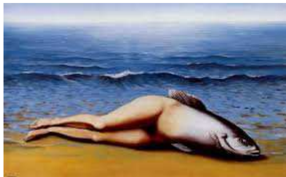
Bild 5- René Magritte, Sirène , 1935.

Außerdem hat das Tier ein weibliches Aussehen: „Der weiße, angeschwollene Bauch des Fisches sah aus wie der Oberschenkel einer Frau“ 172 . Es wird von dem „Rücken“, dem „Rückgrat“, dem „Kopf“ und dem „Skelett des Fisches“ 173 gesprochen. Die Beschreibung erinnert an ein Bild von René Magritte, Sirène (1935), wo die Meerjungfrau tot auf dem Strand liegt: