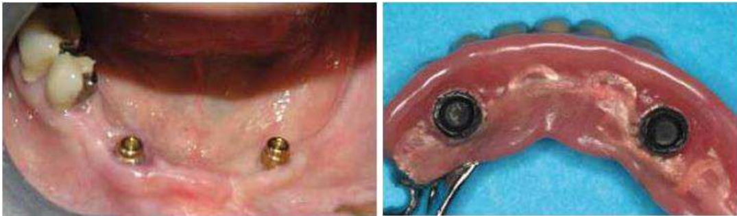
Figure 2: Cas d'édentement bilatéral en extension (Fouilloux et Begin, 2012 [6] )