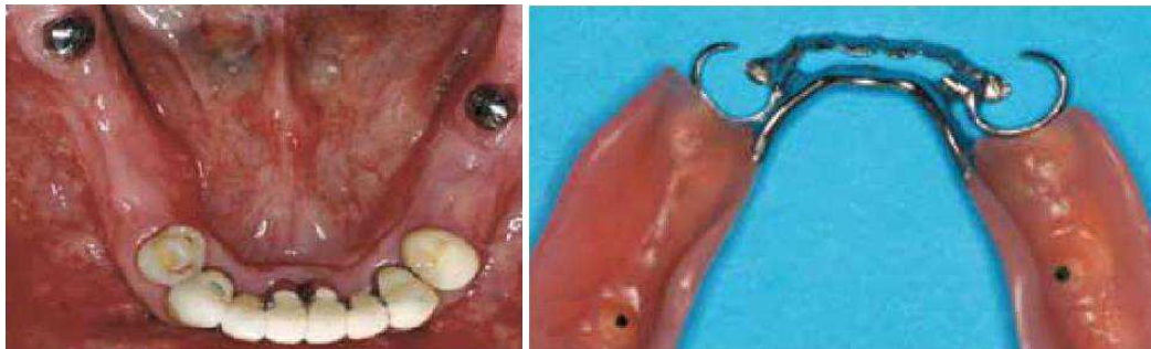
Figure 3: Cas d'édentement antérieur de grande étendue (Fouilloux et Begin, 2012 [6] )