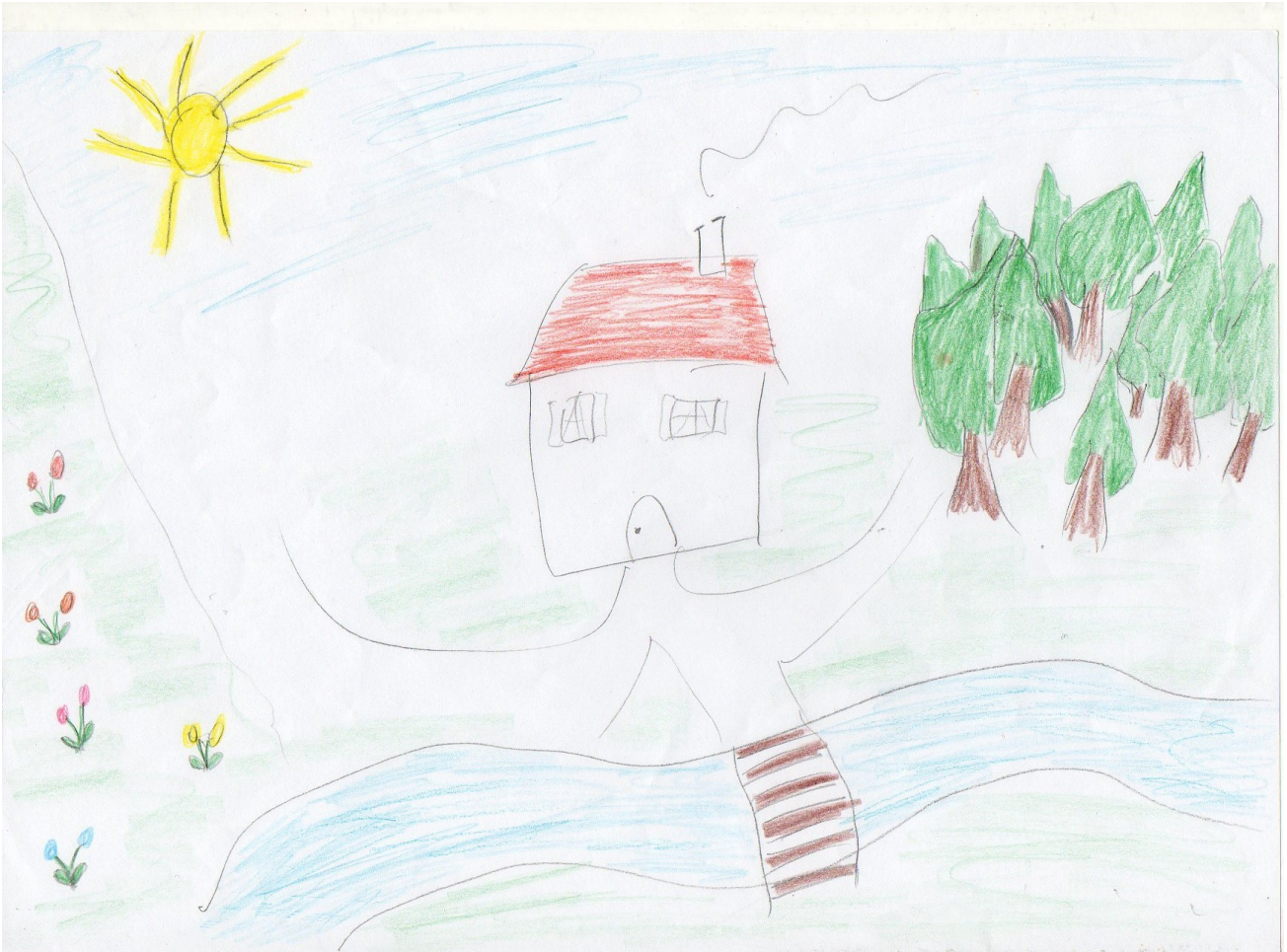
Dessin de Mme B.