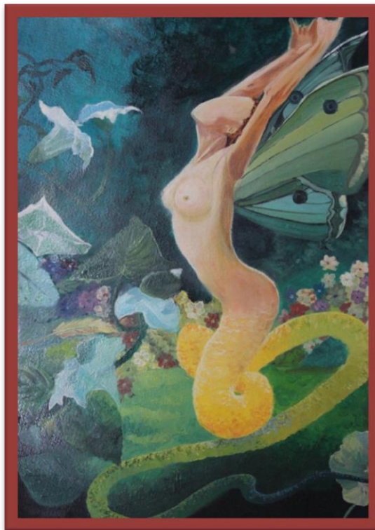
Illustration Marie NIVESSE

La danse vise une transcendance : « il s'agit de se porter au-delà de ses propres contingences, de se mettre au contact de motifs qui touchent parfois à l'archétypal. » 78