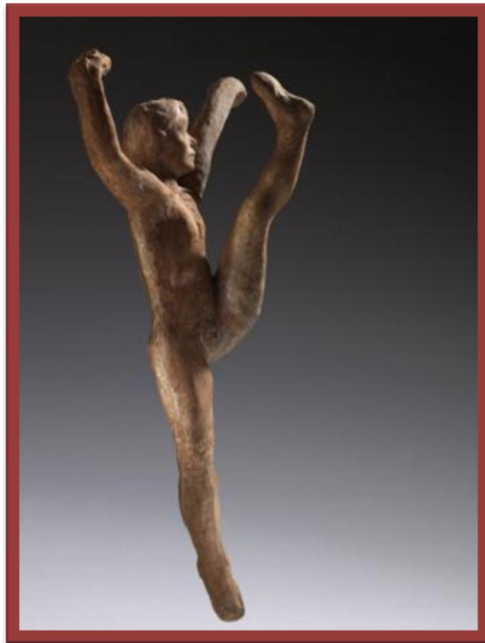
« Mouvement de danse C », Auguste Rodin (1840 -1917).