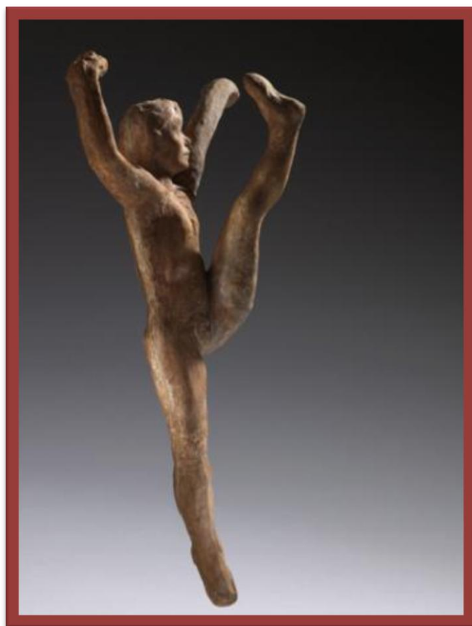
« Mouvement de danse C », Auguste Rodin (1840 -1917).