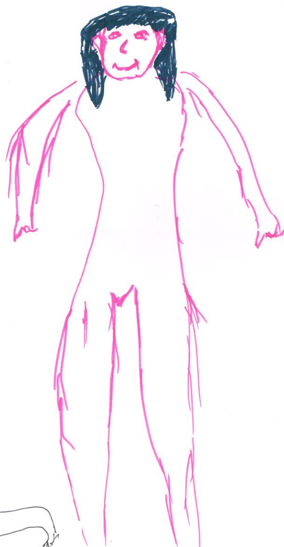
Dessin de Léonie