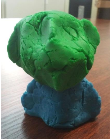
Personnage en pâte à modeler

là et s'est dit que ça pouvait être intéressant, son problème c'est qu'il faudrait qu'elle retrouve ses pieds et surtout ses jambes pour pouvoir marcher librement et vivre sans souci. » Elle termine en disant qu'elle aimerait modifier le visage de son personnage, qu'elle ne trouve pas très réussi mais qu'il a quand même « l'air d'être bien. »