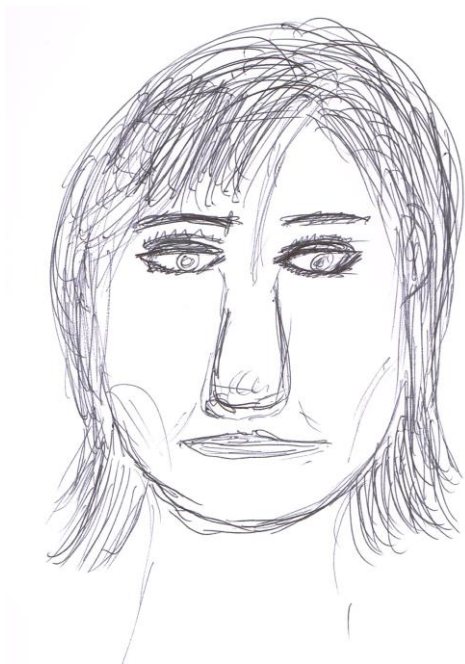
Dessin de Nadia