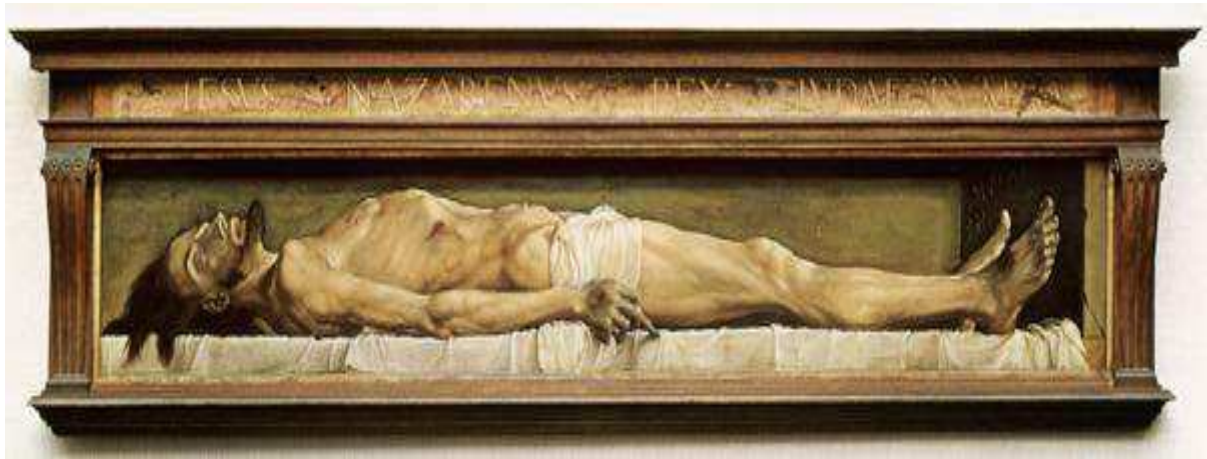
Annexe 1. Le Christ mort , Hans Holbein.