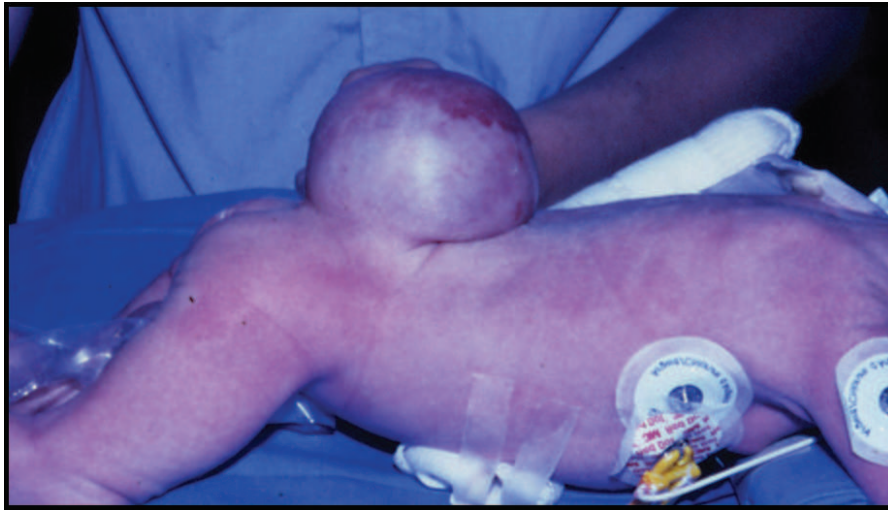
Figure 3 : enfant porteur d'une myéломéningocèle épidermée.

lésion épidermée et de petite taille peut éventuellement être prise en charge de manière différée.