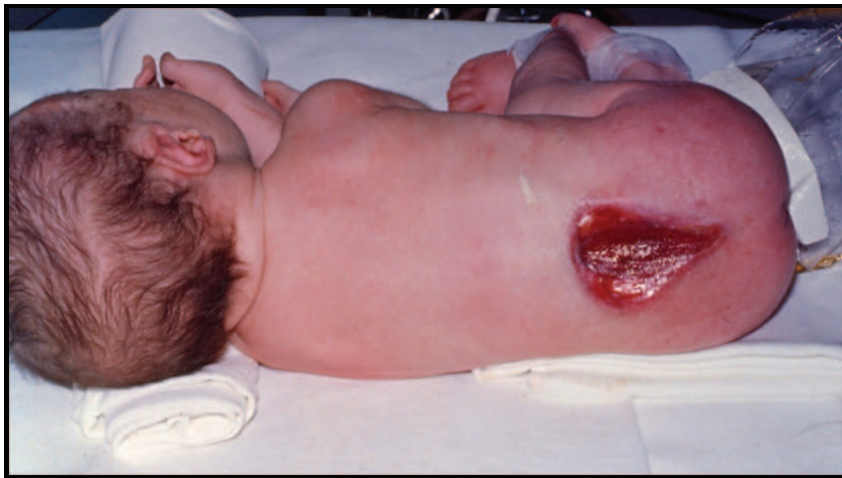
Figure 2 : Nouveau-né présentant une lésion de myéloschisis.

Le myéloschisis est la forme la plus sévère de myéломéningocèle. Dans cette malformation, la moelle s'ouvre à la peau sous la forme d'une plaque d'où partent les racines à destinée postérieure. Sans aucun revêtement méningé ou cutané, la plaque est exposée dès la naissance sous la forme d'une lésion plane, rougeâtre, qui correspond en fait à la moelle épinière qui ne s'est pas refermée.