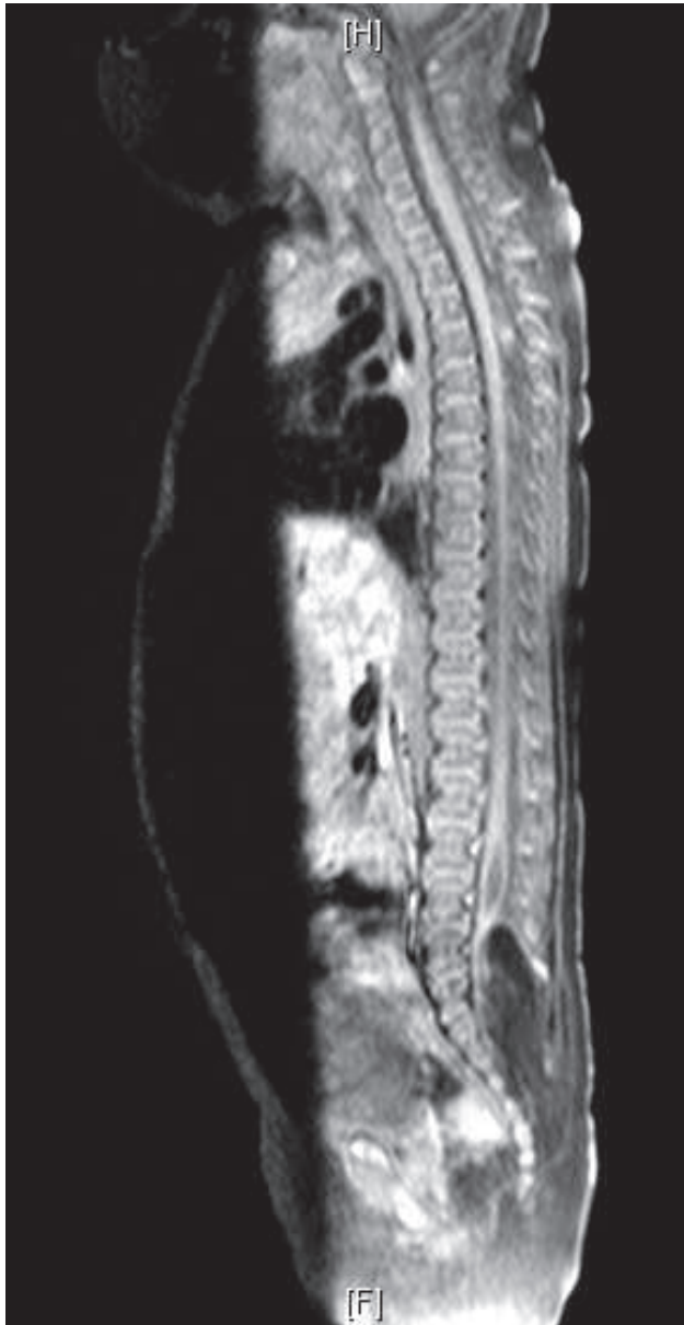
Figure 6 : IRM médullaire montrant une moelle attachée sur un lipome, avec cavité syringomyélique.