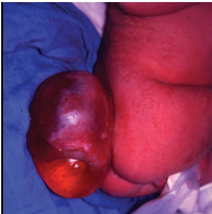
Figure 4 : Myéломéningocèle non épidermée.