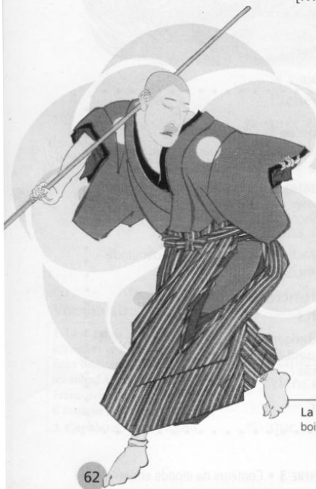
La danse du vieux bossu japonais, bois gravé (xix e s.), musée Cernuschi, Paris.

– Cette bosse... Quelle bosse ? répondit le démon, qui dans l'affolement avait compris de travers. Ah oui ! Je vois. C'est cette chose précieuse que nous conservons de l'autre vieillard. Mais bon, si vous la désirez tant, je peux vous la donner. À la condition toutefois que vous