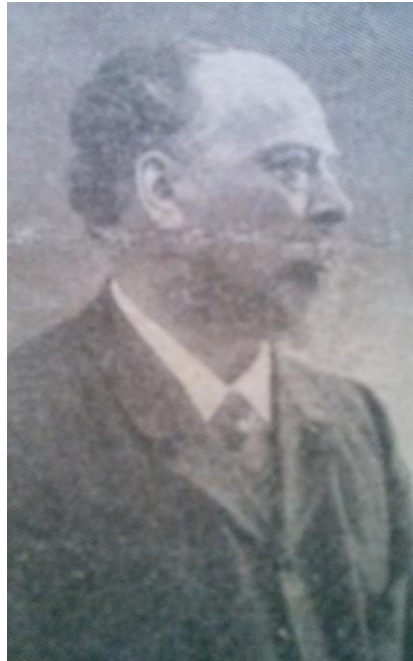
Le Réveil Paysan du 22 novembre 1936