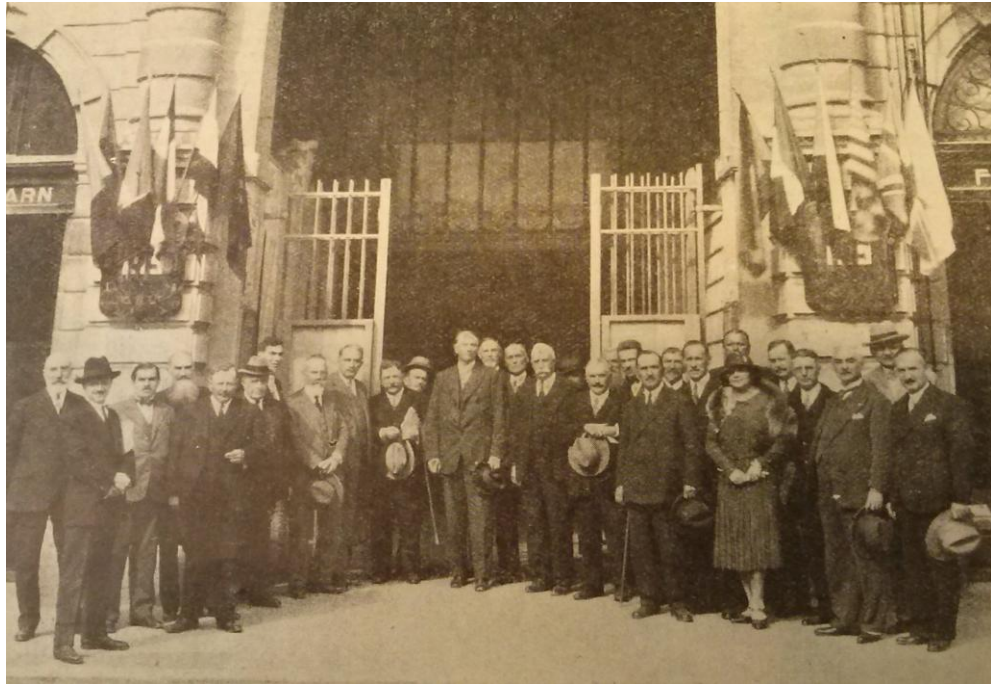
Comptes-rendus du 1 er congrès international du maïs à Pau en 1930 Compagnie des chemins de fer du Midi, avril 1933, tome 1, photographies

Les participants au premier congrès international du maïs, devant la mairie de Pau, le 3 octobre 1930