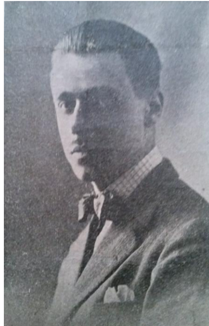
Le Réveil paysan du 22 novembre 1936