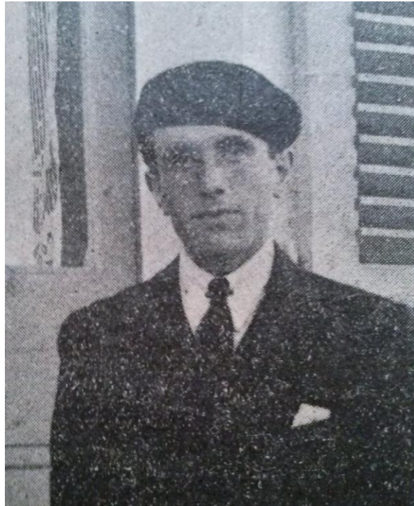
Le Réveil paysan du 1 er mars 1936