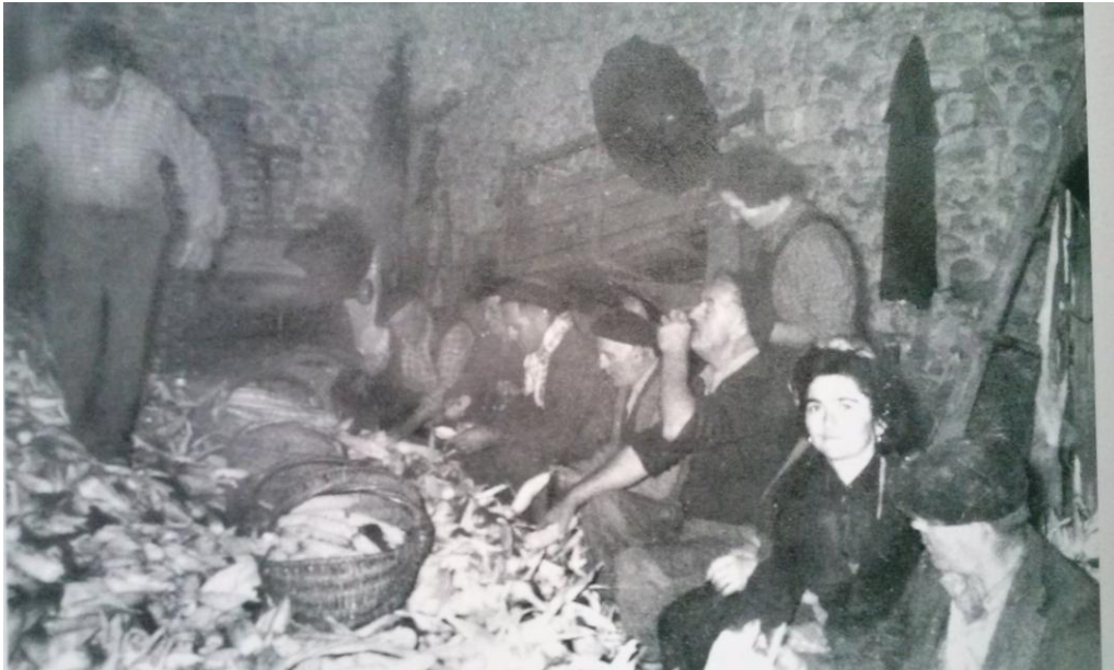
Josette Lansalot, Passé simple – Chronique d'un village en Béarn : Ouillon, Pau, AMCB, 2004, p. 84-86

Les épis ont été transportés la veille ou le jour même à la grange, au moyen d'un char tracté par des bœufs.