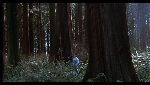
Soleil sous la pluie (Rêves)