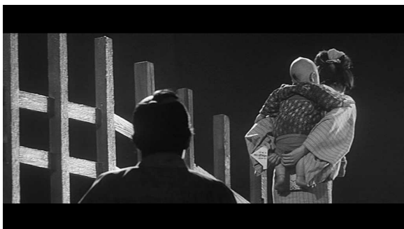
Il se retourne une dernière fois