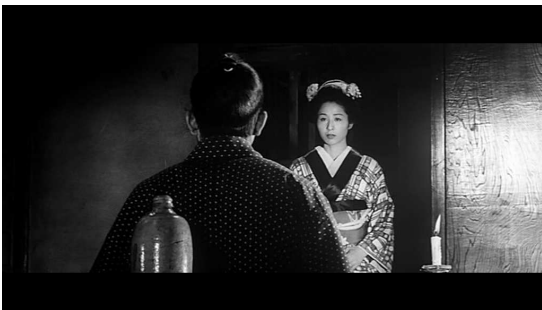
Plan en longue focale ( Barberousse )