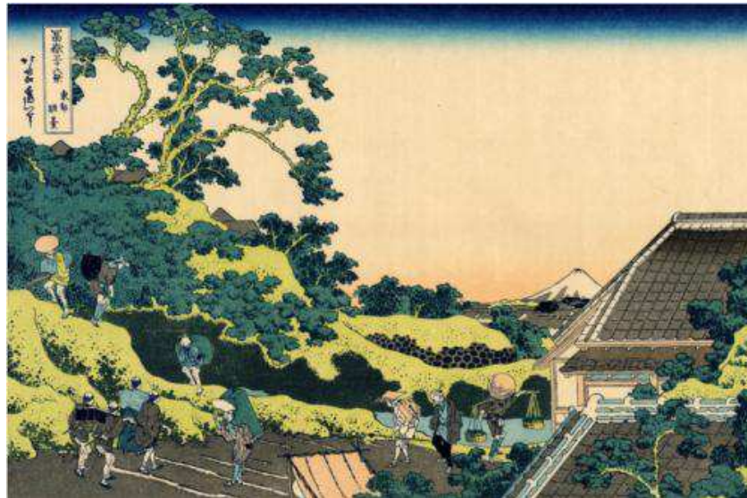
Surugadai à Edo de Hokusai 49

La référence à l'art pictural est évidente dans Rêves à travers le court-métrage sur la peinture de Van Gogh. Kurosawa n'a jamais caché son attrait pour le célèbre peintre et l'influence est présente dans nombreux de ses films. En particulier, en regardant ses story-boards, où le jeu sur les couleurs et l'aspect expressionniste rappellent fortement l'oeuvre de van Gogh. Dans le