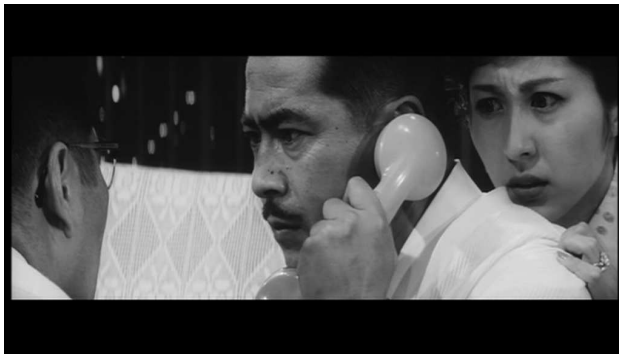
Une longue focale ( Entre le ciel et l'enfer )