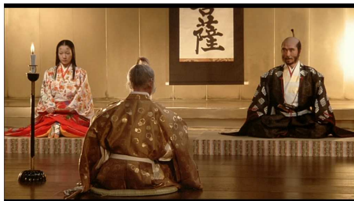
Hidetora, encerclé ( Ran )

Il est dominé dans le plan par le couple en face de lui, il tourne le dos à la caméra et la femme et l'homme l'encerclent de chaque côté du cadre. L'espace offert dans la largeur du cadre