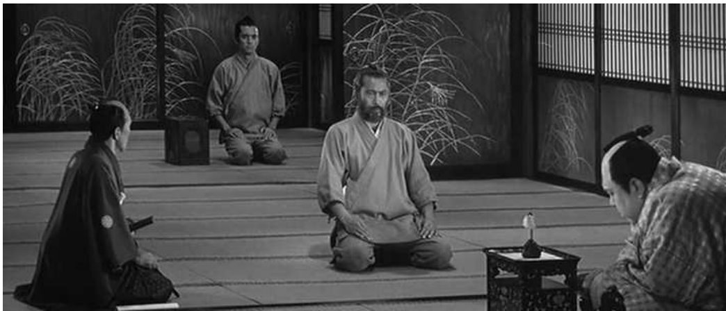
Toshiro Mifune au centre de toutes les attentions ( Barberousse )

Le seigneur se situe au premier plan sur la droite de la composition, de profil qui plus est. Le serviteur du maître des lieux est quant-à lui à gauche de la composition, de profil également, le regard en direction de Toshiro Mifune, Barberousse, au centre. Le jeune médecin est au troisième plan, face caméra comme Mifune. Par le placement dans la largeur du cadre et la profondeur, Kurosawa établit des rapports de force. Les personnages de l'hospice sont tournés vers l'objectif de la caméra, les membres du château sont au contraire de profils. La courte focale permet de donner un sens narratif (le rapport entre les personnages, qui est le maître, qui est le serviteur, etc.) Ce plan en particulier montre la toute puissance du personnage de Barberousse sur le seigneur, ce dernier étant à peine visible sur le bord du cadre. Seul un plan moyen lui donne un quelconque intérêt par la suite, mais Kurosawa présente clairement la situation dans le sens de