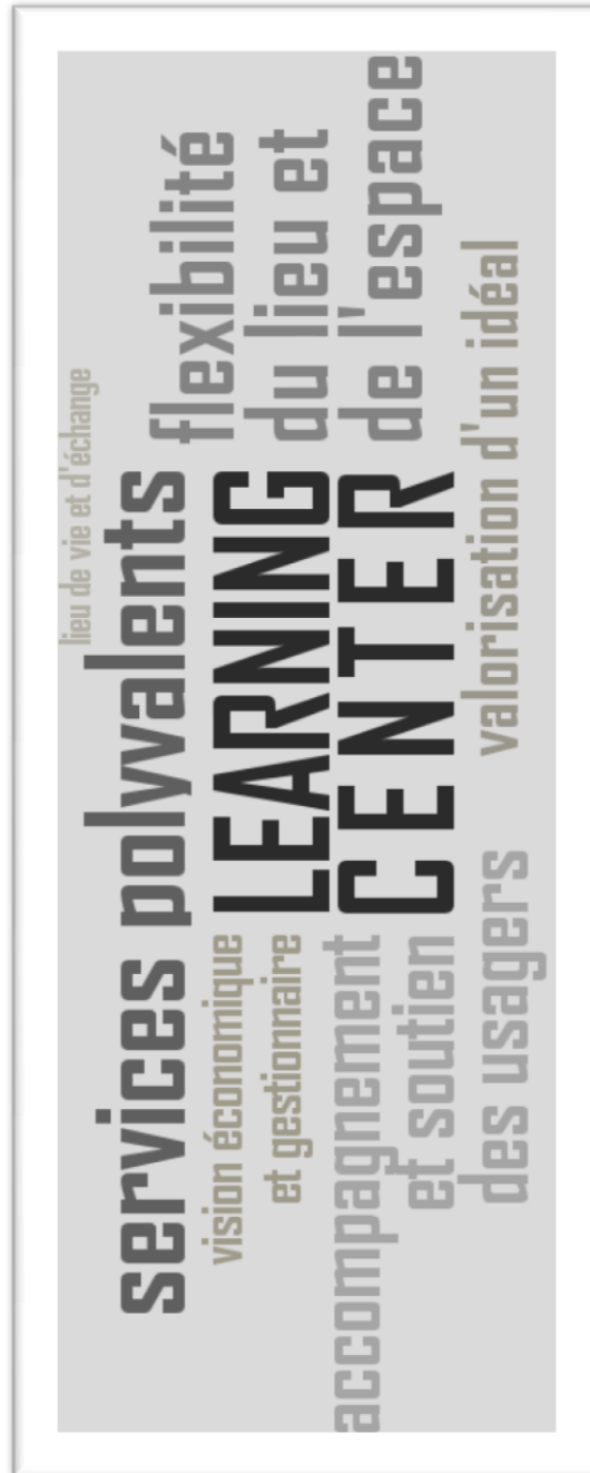
Schéma hiérarchique des six thèmes du Learning center