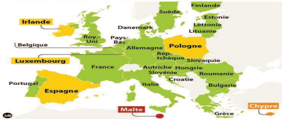
Figure 2 : La carte du droit à l'avortement en Europe (Idé)