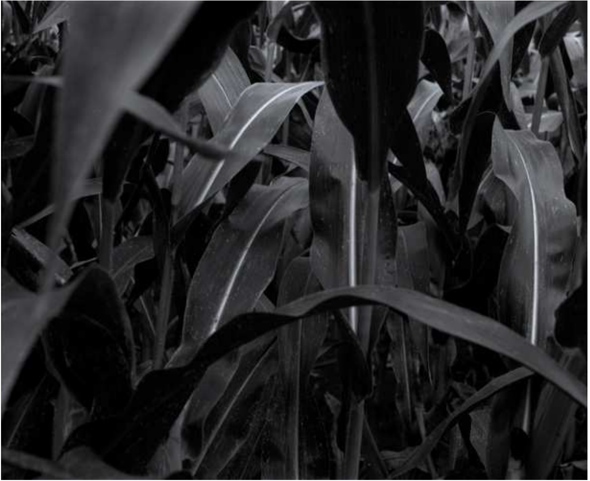
Figure 4 Grégoire Bienvenu - Sans Titre - 2012 - photographie argentique/tirage C-Print 100 cm x 85 cm