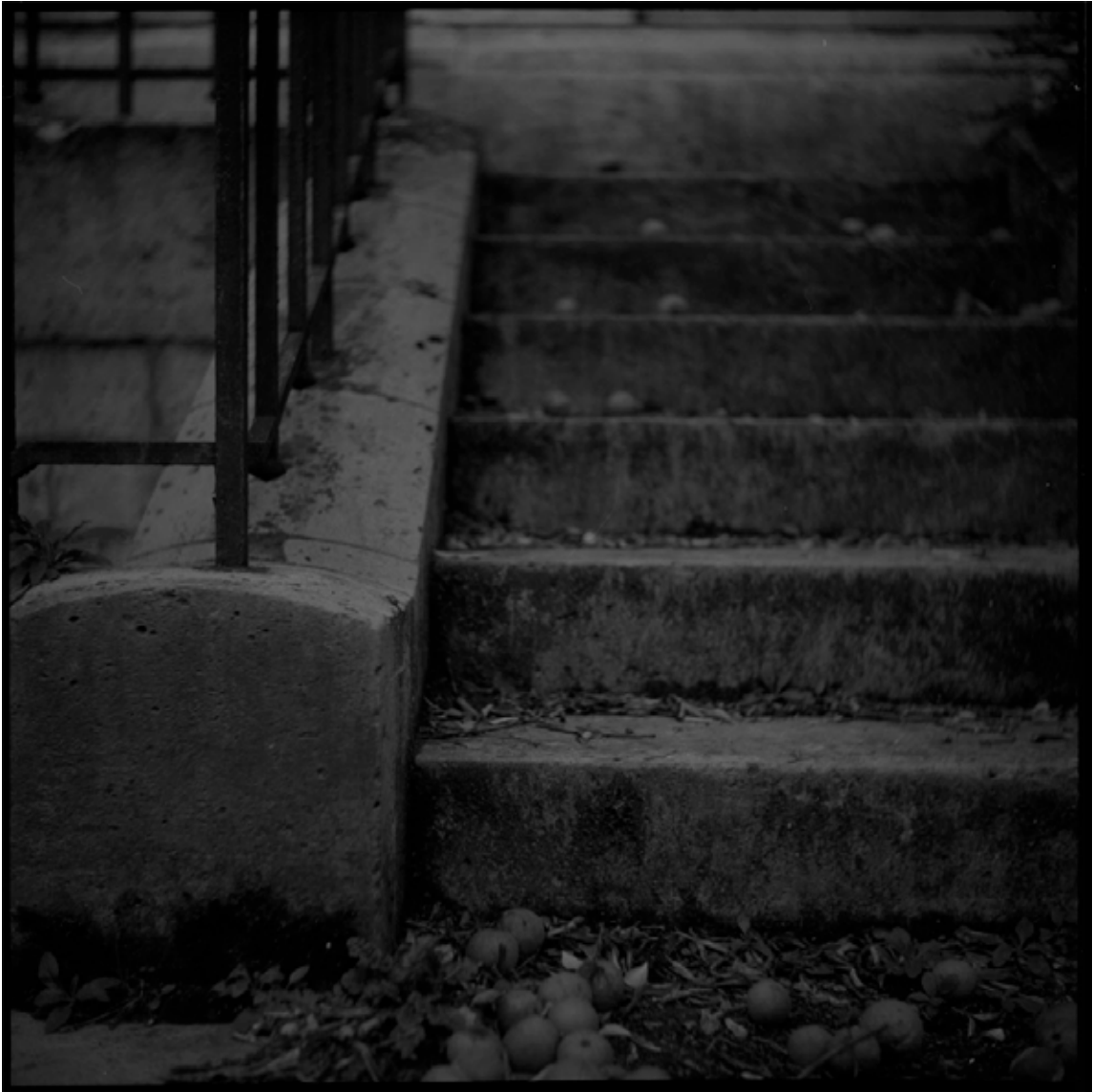
Figure 3 Grégoire Bienvenu - Sans Titre - 2013 - photographie argentique/tirage C-Print 100 cm x 100 cm