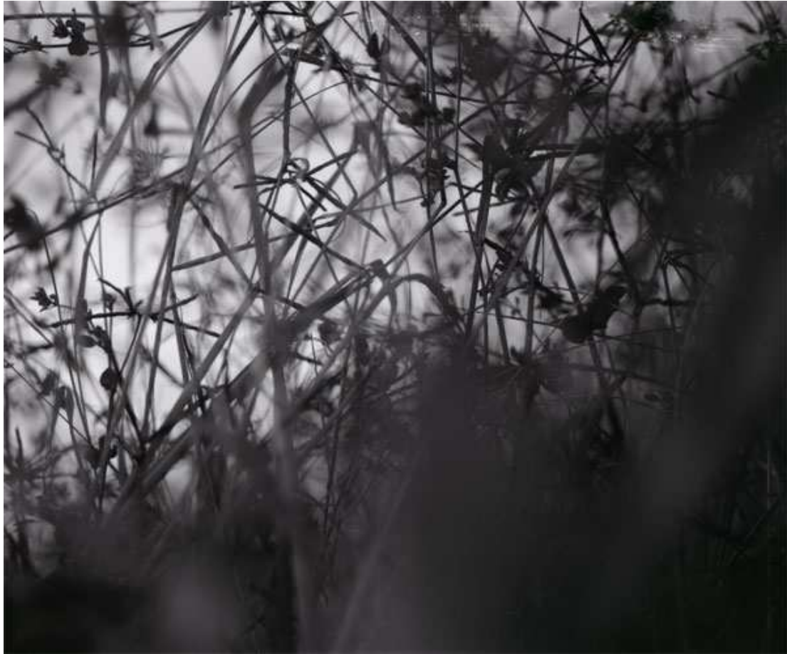
Figure 2 Grégoire Bienvenu - Sans titre - 2012 - photographie argentique/tirage C-Print 100 cm x 85 cm