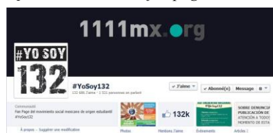
Capture d'écran de la fan page Facebook de #YoSoy 132