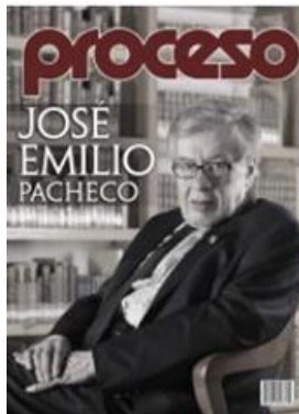
Proceso , daté de la semaine du 27 janvier au 2 février 2014

Son site web, conçu en 1997, offre un fil d'information en continu et donne accès aux principales rubriques que l'on retrouve dans l'édition papier. Le site permet aussi à l'internaute de consulter les archives de l'hebdo.