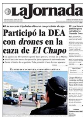
La Jornada , daté du lundi 24 février 2014

Son site web apparaît en 1995 et il est hébergé par l'Université nationale autonome du Mexique (UNAM).