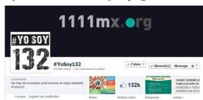
Capture d'écran de la fan page Facebook de #YoSoy 132