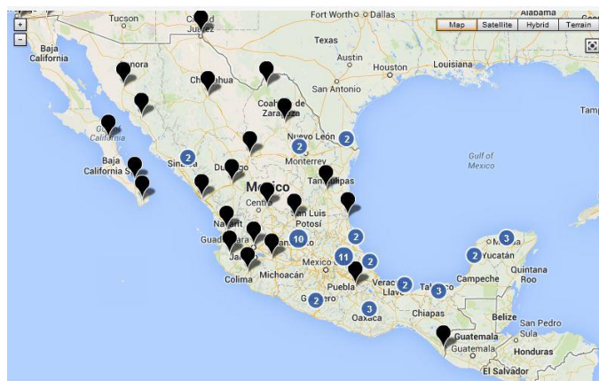
Carte de localisation des différents comités de #YoSoy 132 à travers le Mexique 82

Ces comités se trouvent en nombre inégal d'un Etat mexicain à un autre 81 , mais le mouvement lui-même affirme être présent dans 20 Etats au total, au travers de ces comités. Chacun de ces derniers dispose à la fois d'une page Facebook et d'un compte Twitter, où sont relayées et exposées les actions organisées. Ainsi, le mouvement s'est découpé en plusieurs entités indépendantes les unes des autres mais cependant rattachées au mouvement général #YoSoy 132 et à sa portée nationale.