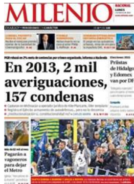
Milenio , daté du 3 février 2014