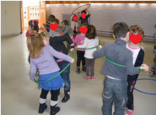
« Simon says, in the hoop ! »