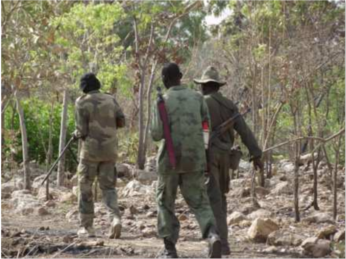
Figure n°9 : Les trois écogardes en poste à Koudou, en retour de mission. On constate que leurs uniformes ne sont pas assortis. On constate également que deux d'entre eux sont armés de fusils, ce que la loi ne permet normalement pas.