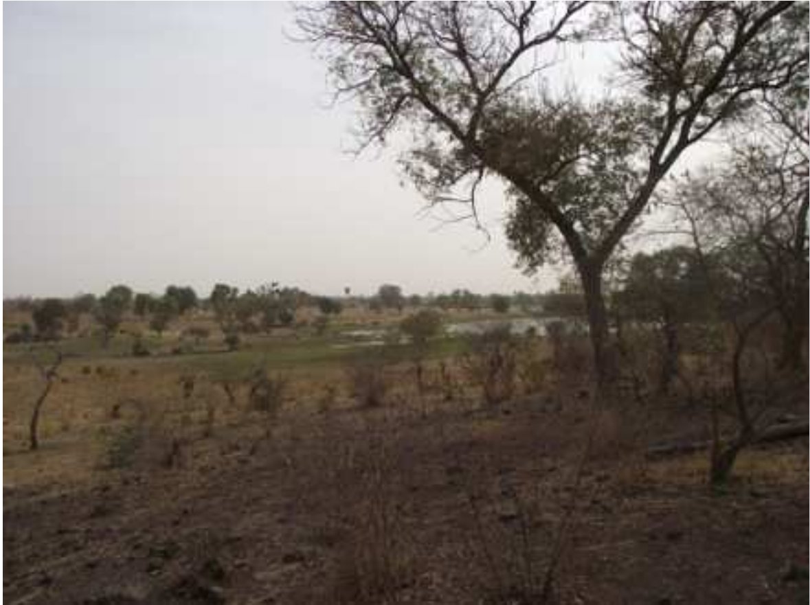
Figure n°7 : La limite du parc du W, village de Bonwalou, Commune de Karimama. L'entrée du parc se trouve au pied de la colline. Aucune matérialisation n'est donc visible. Les troupeaux peuvent donc s'introduire dans le parc à l'insu de leurs propriétaires, ce qui expose ces derniers à de fortes amendes.

Source : Photographie prise par l'auteure. 19 mars 2014.