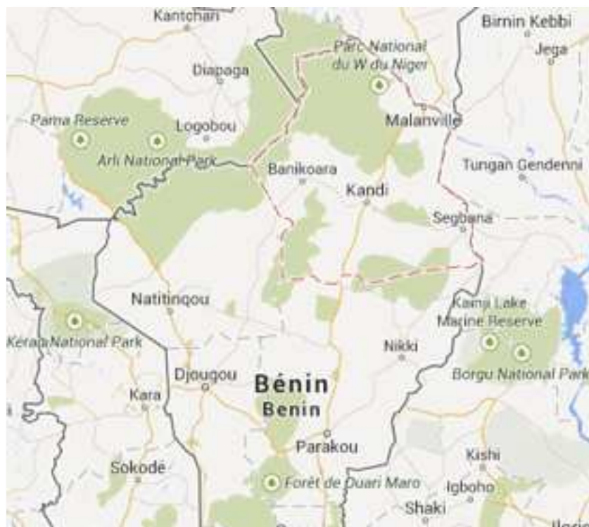
Figure n°1 : Le Nord Bénin et le département de l'Alibori.