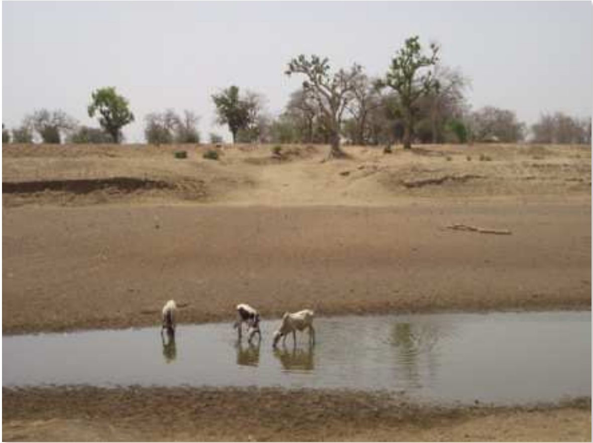
Figure n°4 : La rivière Alibori, limite du parc du W à Kofounou, Commune de Karimama. Des champs sont visibles de l'autre côté, sur la gauche de l'image. 18 mars 2014.