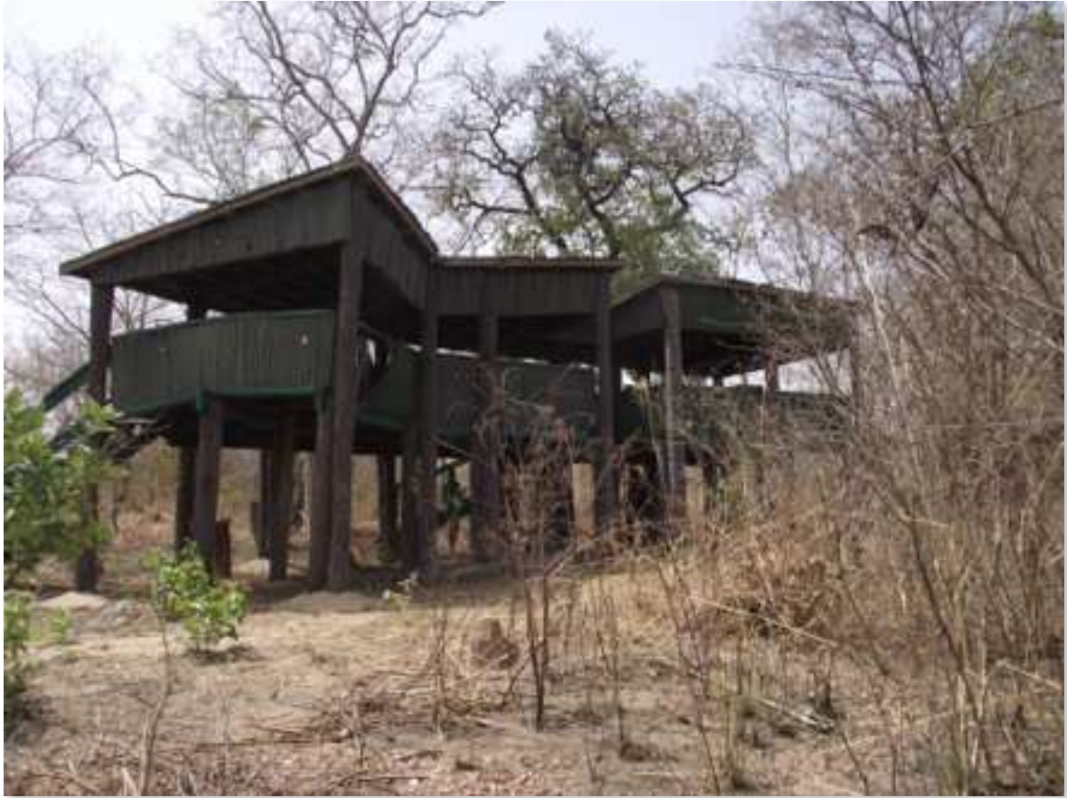
Figure n°6 : Les miradors de la mare aux éléphants d'Alfakoara, construits du temps d'ECOPAS, menaçant ruine.