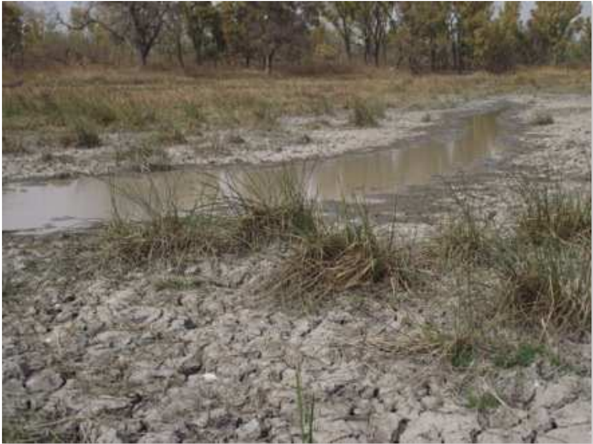
Figure n°5 : La mare de Sapiengou, dans le parc du W, en train de s'assécher à cause du manque d'entretien. Cette mare fait partie de tout un dispositif d'infrastructures destinées à attirer la faune sauvage dans cette partie du parc. Ici, la mare est alimentée grâce à une pompe fonctionnant à l'énergie solaire.

Source : photographie prise par l'auteur. 24 février 2014.