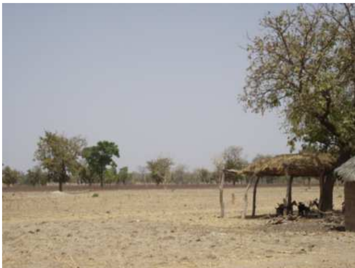
Figure n°3 : Champs de coton en zone tampon. Sampeto, Arrondissement de Founougo, Commune de Banikoara.

Source : photographie prise par l'auteure. 6 mars 2014.