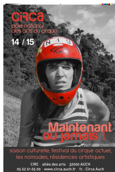
Affiche de la saison 2014-2015 de CIRC a qui embrasse l'identité générale de la structure, Festival et Saison culturelle compris

Cette démarche se veut un contrepoint à l'identité visuelle décrite plus haut et une manière d'embrasser, sur un mode différent, les différentes activités assumées par CIRC a . Reste à déterminer si ce contrepoint ne présente pas un risque de brouillage