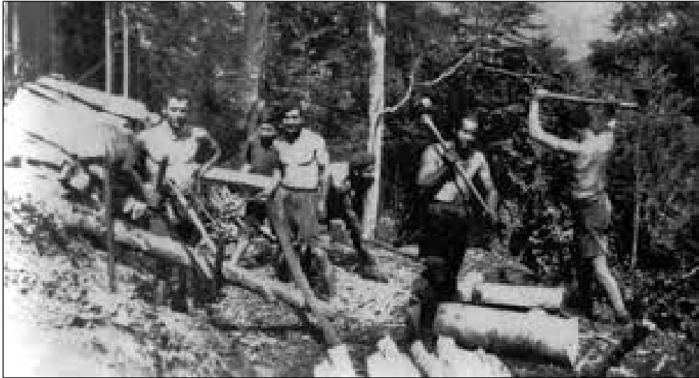
Figure 1: Groupe de Guérilleros dans un bois du Béarn.