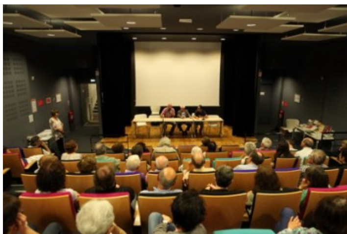
Conférence du 31 mai 2014 lors des journées de la Coordination Caminar.