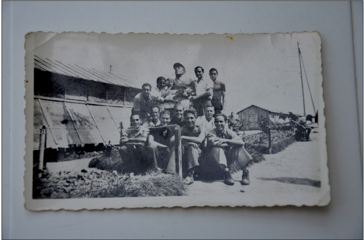
Figure 11: Photo originale du Camp de Gurs.

Annexe 1 : Photos et documents issus de la collection de madame Roson.