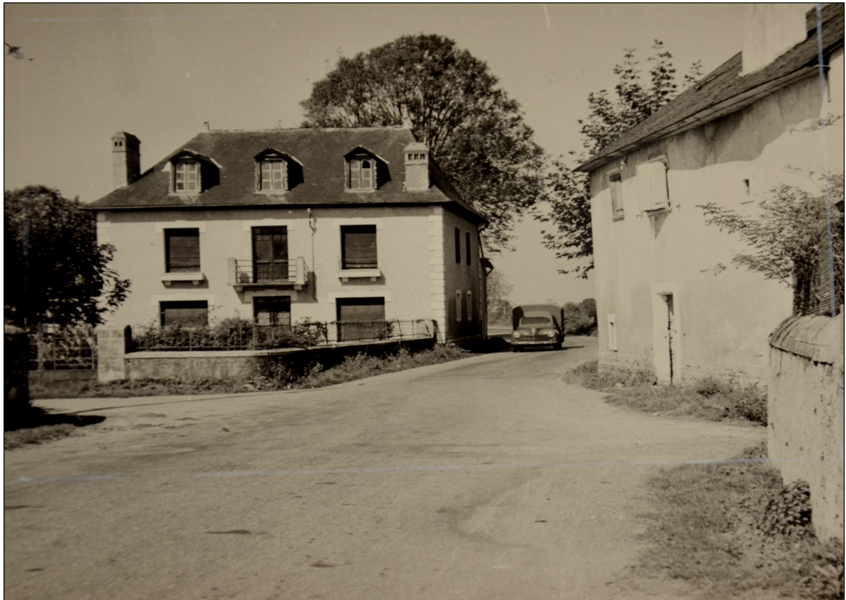
Figure 9: Photo d'une maison de Buziet. La couleur originale et la teinte ont été modifiées.

Voici un exemple de retouche photographique effectué sur un document d'archive.