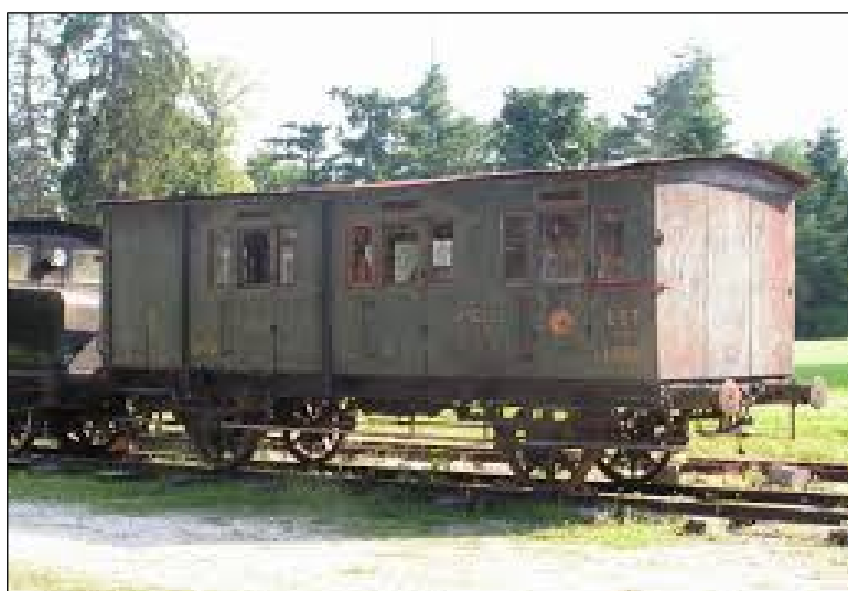
Figure 10: Exemple du genre de wagon que l'association TML recherche.

Au fil des années donc l'association TML cherche à enrichir ses projets en tentant de mettre en place de plus en plus d'actions dynamiques, au travers de projets de médiation culturelle de plus grande envergure.