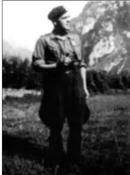
Figure 2: Un gradé de la 10ème Brigade.