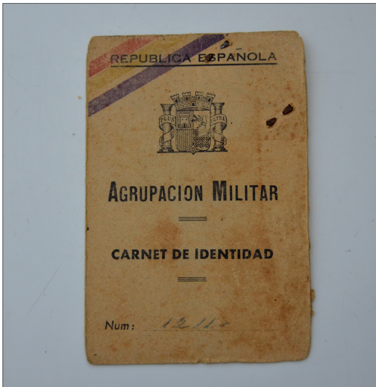
Figure 5: Document militaire de la République espagnole; source : Mme Roson.