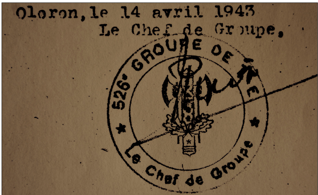
Figure 6: Sceau du 526 ème GTE.

La photo suivante présente le type de documents d'archives utilisés dans le cadre de cette exposition temporaire.