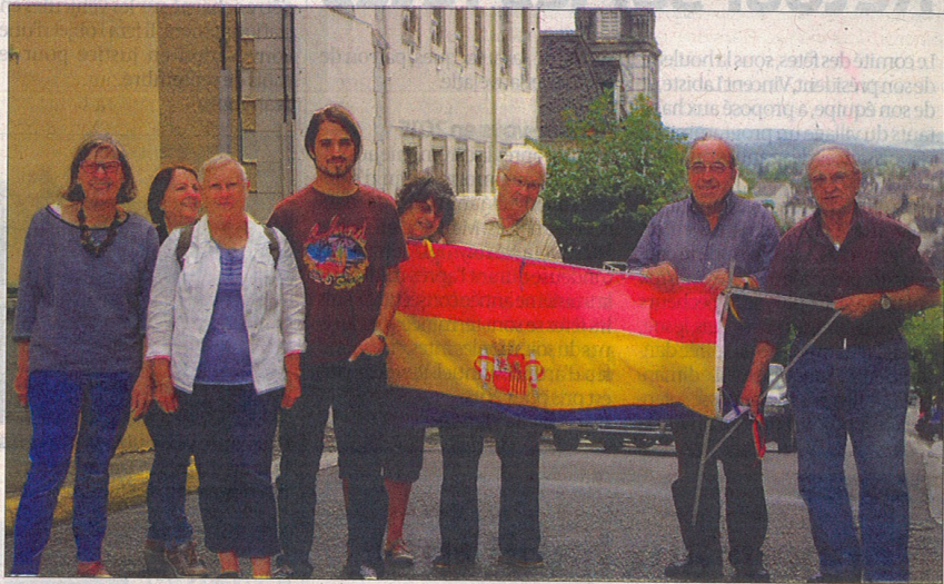
Terres de mémoire(s) et de luttes voulait marquer le 70 e anniversaire.

Une exposition aura donc lieu aujourd'hui à l'école de Buziet. Les recherches d'Antoine Quéréilhac se-