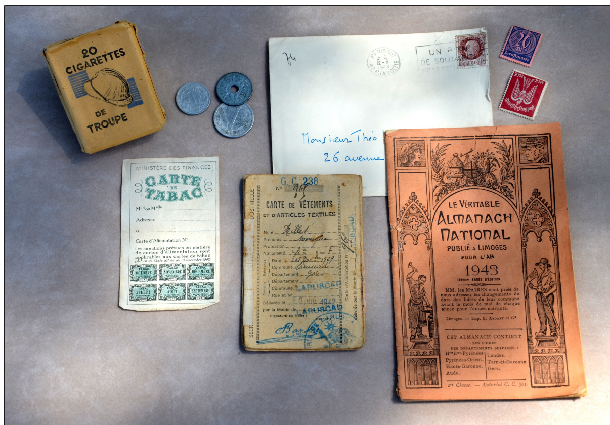
Figure 8: Montage photo avec documents et objets originaux.

Pour conclure toutes ces explications sur l'iconographie dans cette exposition temporaire, il faut aborder un dernier aspect de la méthode de travail utilisé : La retouche d'images. De manière à avoir des images relativement uniformes tout le long des différents panneaux de l'exposition, un travail de retouche d'images fut effectué. L'objectif était en premier lieu de disposer d'images nettes et bien cadrées, dans la mesure où ces images allaient être agrandies au moment de l'impression. Ensuite, pour les images en noir et blanc, plusieurs problèmes se posaient : d'une part la teinte de l'image et d'autre part son format. De manière à essayer d'uniformiser les images, la plupart furent retouchées pour la réalisation des panneaux de l'exposition. En accord avec les membres de l'association, j'ai choisi de mettre en valeur le côté ancien des images et des documents d'archives, en procédant à un vieillissement artificiel de certaine photo, notamment pour essayer d'obtenir un ton qui se rapproche du sépia. Ce choix fut effectué dans la mesure où la plupart des photos des années 1930 et 1940 ne sont pas vraiment en noir et blanc, mais plutôt dans une teinte intermédiaire entre ces deux couleurs. Ce processus fut également utilisé pour les photographies de document d'archives utilisés dans cette exposition.