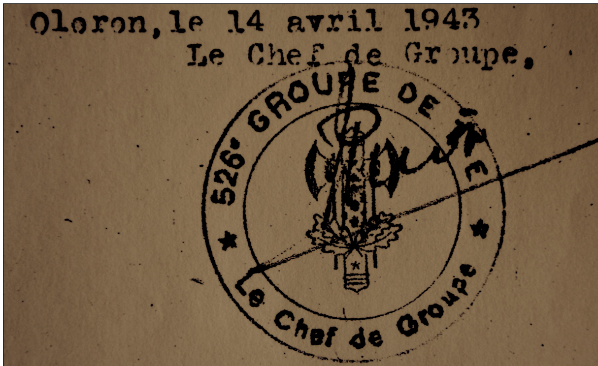
Figure 6: Sceau du 526 ème GTE.

La photo suivante présente le type de documents d'archives utilisés dans le cadre de cette exposition temporaire.