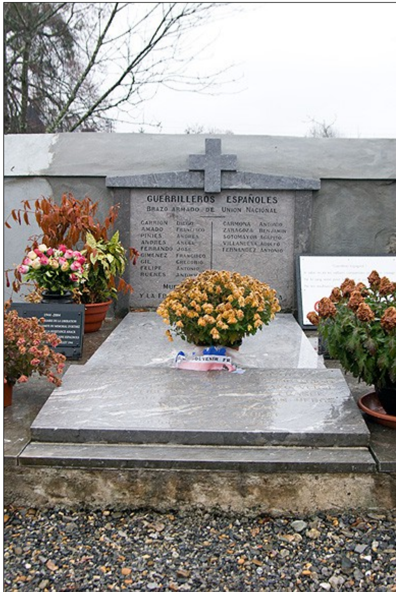
Figure 3: Mémorial de Guérilleros à Buziet (Photo A.Quereilhac).

Peu après la Libération, les Guérilleros espagnols ont choisi d'ériger un monument pour commémorer le sacrifice des quinze hommes tombés sous les balles nazies durant l'Occupation et les combats de la Libération. Financé en partie par la commune de Buziet, ce monument fut inauguré en octobre 1944 en présence des autorités militaires, politiques et religieuses. Le site ne fut pas choisi au hasard, car le village de Buziet fut le cadre du massacre du 17 juillet 1944. Pour les Guérilleros, ériger un monument avait une dimension commémorative et donc surtout mémorielle, pour que les générations futures n'oublient pas leurs sacrifices pour la Libération du Béarn. Sur place, cette mémoire est restée très vivace puisque depuis cette date, chaque année à lieu une cérémonie qui rend hommage à ces combattants.