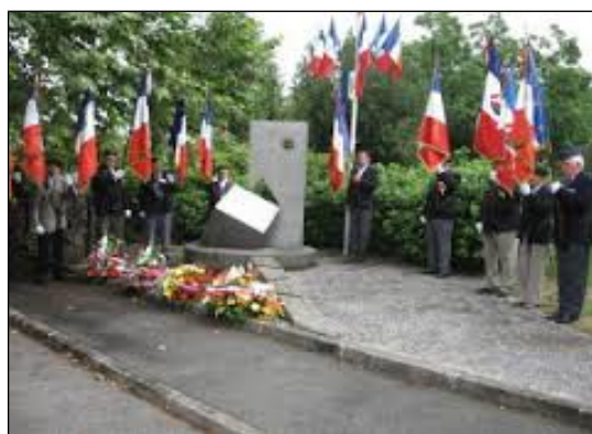
Figure 4: Cérémonie devant le mémorial de Buziet.

De plus, chaque année à lieu sur le site une commémoration. Proposer l'exposition ce jour fut une option que nous avons choisie pour permettre au public venant sur les lieux pour la commémoration d'avoir l'occasion d'en apprendre davantage sur l'histoire de ces hommes et de ces femmes qui choisirent la lutte dans l'exil pour combattre le fascisme.