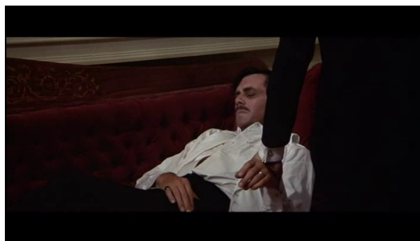
Et initie l'analepse