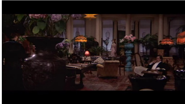
La mère de Tazio apparaît au loin en arrière-plan

belle femme incarnée par Silvana Mangano et appuyer la majesté de son déplacement.