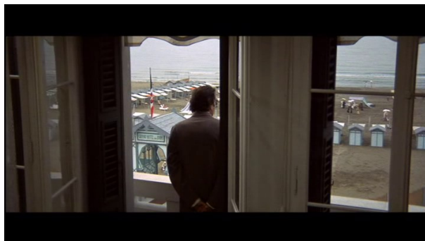
Gustav à la fenêtre de sa chambre

décor. Au cours du repérage des zooms dans Mort à Venise et le reste des films de Visconti, des récurrences sont apparues, comme des motifs de représentation produisant du sens au-delà des différences filmiques et narratives. Un de ces motifs a constitué sans doute le tournant de la recherche par le fait qu'il a conduit à chercher plus avant le sens de l'utilisation du zoom. Il n'est pas anodin que Gustav von Aschenbach soit l'objet du zoom à de nombreuses reprises et que le cadre dans lequel il est pris soit celui d'une surface particulière, d'une porte, d'une fenêtre, ou d'un miroir. Les miroirs, fenêtres et portes constituent en effet un morceau d'espace très présent dans le cadre.