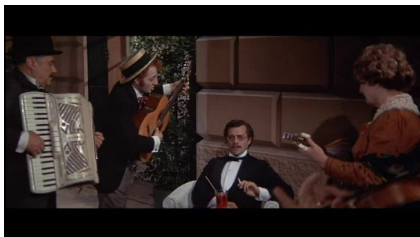
Les regards de Tadzio et Gustav qui se touchent, dans une quasi focalisation

Le contre-champ, dans le même axe, sur Gustav, transmet la réponse à ce regard.