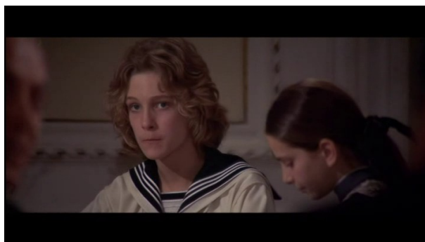
En contre-champ, Tazio, ou le visage de la Beauté

Le regard de Gustav semble être à ce moment à la fois pris dans le passé d'une conversation où deux conceptions s'affrontaient, et dans le présent de son regard, porté sur Tazio.