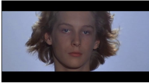
Une vision rêvée, à la fois proche et lointaine, de Tadzio

dernière condamnation du personnage sur son erreur de jugement 56 . Une dernière vision, à la fois proche et lointaine, dans l'esprit de Gustav mais purement fantasmée, de Tadzio s'invite sous le regard du musicien.