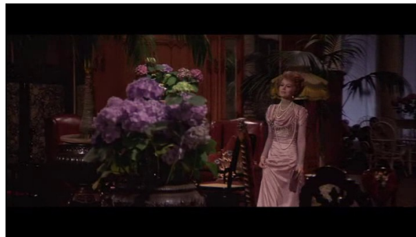
Le travelling compensé accompagne son arrivée et la rapproche de notre regard

Le zoom, par son mouvement, bien qu'il soit un non-mouvement, au contraire du travelling qui fait se déplacer la caméra, vient changer le régime de l'image en jouant sur les plans. Par son action de rapprochement (zoom avant) ou d'éloignement (zoom arrière), le zoom vient en effet relier les plans entre eux, dans une trame soigneusement étudiée et méticuleusement composée par Visconti. Rien n'est laissé au hasard, chaque élément qui est l'objet du zoom devient un détail à