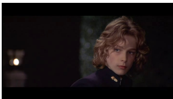
Le regard énigmatique de Tadzio sur Gustav

Au regard fasciné de Gustav répond celui, plus énigmatique, de Tadzio. Il est à noter que cette particularité tient à l'adaptation de Visconti, le personnage original de Thomas Mann ne répondant pas aux regards ni aux sourires de Gustav. Regarder dans Mort à Venise est aussi être regardé. Tadzio, objet du regard et du désir de Gustav, est l'objet du zoom dans le rapprochement de l'oeil de la caméra vers cet objet inaccessible. Mais Tadzio regarde aussi, et son regard s'affirme tout autant sous l'oeil de Visconti. Un exemple notable est à prendre en compte, c'est la scène où Gustav est assis à la terrasse de l'hôtel, quand le groupe de musiciens se met à jouer et chanter devant les touristes attablés. Un premier zoom avant se pose sur Tadzio 24 , dont le regard est légèrement décalé par rapport à la caméra. Il détourne les yeux, puis, alors que le zoom s'est arrêté pour cadrer uniquement son visage, Tadzio tourne de nouveau la tête dans un hors champ, celui où se trouve Gustav.