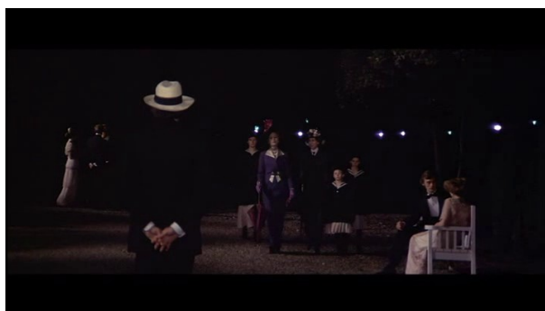
Le travelling compensé traduit l'impossible assouvissement du désir

façonné par la présence du zoom, qui piège les personnages dans cet entre-deux. Reflet de ce non-espace et de cet entre-deux intemporel, une scène particulière entre Gustav et Tazio vient ici appuyer ce sens. Cette scène suit le souvenir en analepse de la rencontre de Gustav avec la jeune prostituée, dont le lien a clairement été établi avec Tazio, par la présence commune de la mélodie au piano. La scène 31 se passe de nuit, et l'on voit d'abord, au loin, la famille polonaise au complet, se dirigeant en direction de la caméra, pendant qu'un zoom arrière fait apparaître Gustav dans le champ, se dirigeant lui dans la direction opposée.