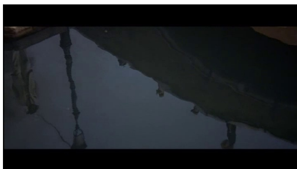
Un très court instant, les deux reflets se retrouvent ensemble dans le cadre

Puis le reflet de Tadzio apparaît dans le cadre et un panoramique dans l'autre sens les fait soudain apparaître ensemble dans le cadre mais de façon éphémère, comme pour appuyer l'idée de l'impossibilité de ce rapprochement.