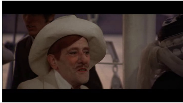
Le masque blanc de cet homme, préfigure de la mort?

Un autre rire vient résonner étrangement face à Gustav, celui du chanteur et musicien qui, à l'invitation de Gustav qui cherche à se renseigner sur les mesures d'hygiène prises à Venise, lui demande d'approcher 42 . Ce rire, loin d'amuser, semble être celui d'un mort : il rit à l'évocation de la maladie, semble s'amuser de l'inquiétude de Gustav, le zoom avant opéré sur lui accentuant encore davantage l'inquiétude de Gustav par contraste.