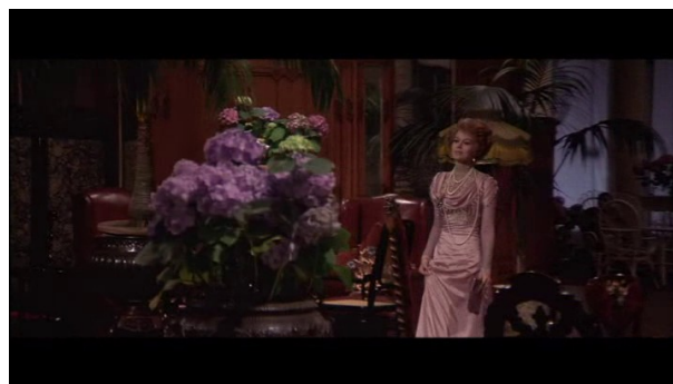
Le travelling compensé accompagne son arrivée et la rapproche de notre regard

Le zoom, par son mouvement, bien qu'il soit un non-mouvement, au contraire du travelling qui fait se déplacer la caméra, vient changer le régime de l'image en jouant sur les plans. Par son action de rapprochement (zoom avant) ou d'éloignement (zoom arrière), le zoom vient en effet relier les plans entre eux, dans une trame soigneusement étudiée et méticuleusement composée par Visconti. Rien n'est laissé au hasard, chaque élément qui est l'objet du zoom devient un détail à