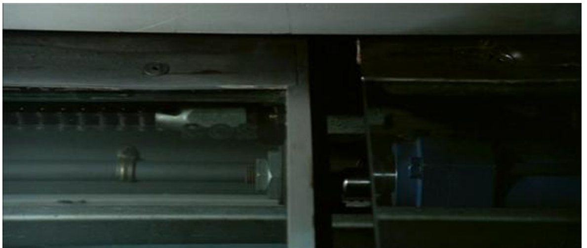
Le plan hyper-resserré sur le mécanisme des portes de Suspiria , au service de la survalorisation du détail

réalisme, mais [uniquement] une fonction de brouillage. Il fait événement en soi. » 68 Une illustration de ce dispositif est remarquable au début de Quatre mouches de velours gris , entre autres, quand, immédiatement après le drame du théâtre, la caméra vient s'attarder sur une série d'éléments sans importance ni signification, au rythme d'une musique à trois temps pourtant inquiétante et dans un montage cut : un immeuble au loin en plan d'ensemble ; une inconnue à sa fenêtre en plan moyen ; un boiteux qui rentre chez lui en plan de demi-ensemble ; à nouveau l'inconnue, cette fois en plan américain (le montage s'alternant et le cadre se resserrant comme pour mettre en tension les deux anonymes, alors que le spectateur ne reverra ni l'un ni l'autre) ; le tout culminant avec un lent panoramique latéral dans un jardin à peine discernable, se changeant ensuite en un long travelling avant qui finit par ne filmer qu'un chat, plein cadre, sur le canapé de Roberto Tobias.