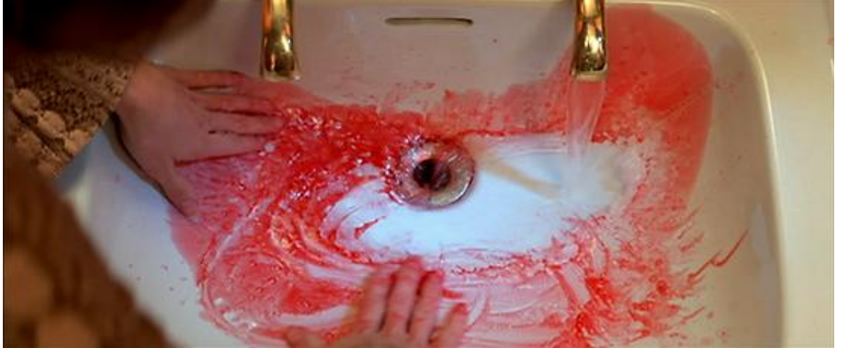
La texture du rouge, rendue sensible par son impression sur le blanc, dans Suspiria

lavabo, mais doit ensuite en effacer les traces en frottant laborieusement, et le rouge finit même par imprégner ses doigts.