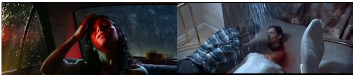
Excès et Grand-Guignol manifestent la jouissance de l'image, dans Suspiria et Trauma