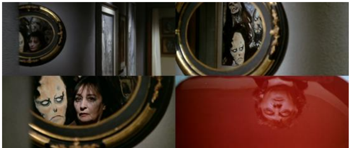
Le parcours didactique du regard dans Les Frissons de l'angoisse : travellings , zooms et reflets