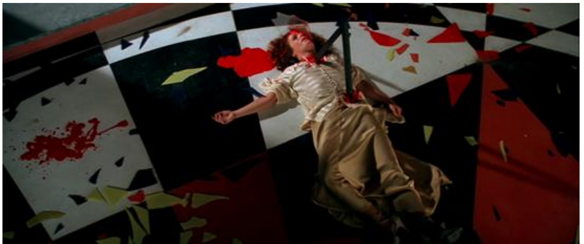
La caméra s'attarde sur un tableau macabre dans Suspiria

spectateurs impuissants et transis de crimes sauvages : on pense à Betty, la cantatrice de Terreur à l'opéra , ligotée à plusieurs reprises par un meurtrier qui la force à voir les homicides qu'il commet, à Marcus, dans Les Frissons de l'angoisse , qui assiste, figé de stupéfaction, à la mort de Helga Ulmann derrière une vitre, mais surtout au premier film du cinéaste, L'Oiseau au plumage de cristal , où le protagoniste Sam Dalmas, prisonnier de l'entrée d'une galerie d'art, voit s'y dérouler une agression parmi les sculptures et les peintures comme il regarderait une œuvre d'art.