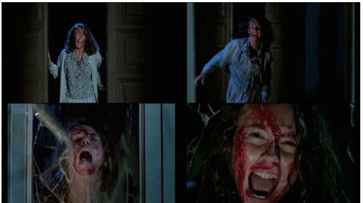
Le mouvement même du trauma perce le sur-cadre, l'écran et la psyché, dans Phenomena

du bâtiment ; la musique s'arrête subitement et nous repassons au champ pour reprendre le point de vue de Jennifer qui regarde par cette fenêtre ; le montage s'accélère alors soudainement et nous montre, en trois secondes et six plans, la camarade de chambre de la protagoniste, déjà couverte de sang, traverser la salle en courant, tomber sur la vitre la tête la première et la briser ; filmée de face, depuis derrière la vitre presque plein-cadre, sa tête paraît ainsi traverser l'écran ; de même, dans Les Frissons de l'angoisse , Marcus verra la tête de Helga Ulmann passer au travers d'une vitre, comme pour figurer la pénétration de l'évènement traumatique dans la psyché.