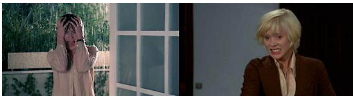
Manifestations physiques de l'hystérie de la névrose obsessionnelle dans Ténèbres et Quatre mouches de velours gris

Mais pour revenir à la « névrose obsessionnelle », dont la théorisation psychanalytique s'applique particulièrement bien au cinéma de Dario Argento, quoique toujours de ce point de vue de la direction des acteurs, il nous faut ici remarquer combien il est fréquent que le visage de l'assassin, au moment de sa mise à nue finale, se déforme d'une manière singulière, comme sous le coup d'une violente douleur trahissant une grande jubilation, ou bien, pour reprendre les termes de Sigmund Freud à propos de l'« Homme aux rats », adoptant « une expression complexe et bizarre, expression que je ne pourrais traduire autrement que comme étant l'horreur d'une jouissance par lui-même ignorée. » 170