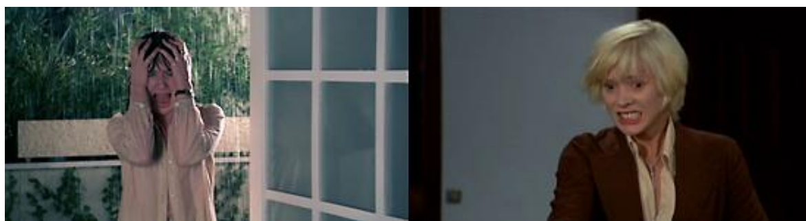
Manifestations physiques de l'hystérie de la névrose obsessionnelle dans Ténèbres et Quatre mouches de velours gris

Mais pour revenir à la « névrose obsessionnelle », dont la théorisation psychanalytique s'applique particulièrement bien au cinéma de Dario Argento, quoique toujours de ce point de vue de la direction des acteurs, il nous faut ici remarquer combien il est fréquent que le visage de l'assassin, au moment de sa mise à nue finale, se déforme d'une manière singulière, comme sous le coup d'une violente douleur trahissant une grande jubilation, ou bien, pour reprendre les termes de Sigmund Freud à propos de l'« Homme aux rats », adoptant « une expression complexe et bizarre, expression que je ne pourrais traduire autrement que comme étant l'horreur d'une jouissance par lui-même ignorée. » 170