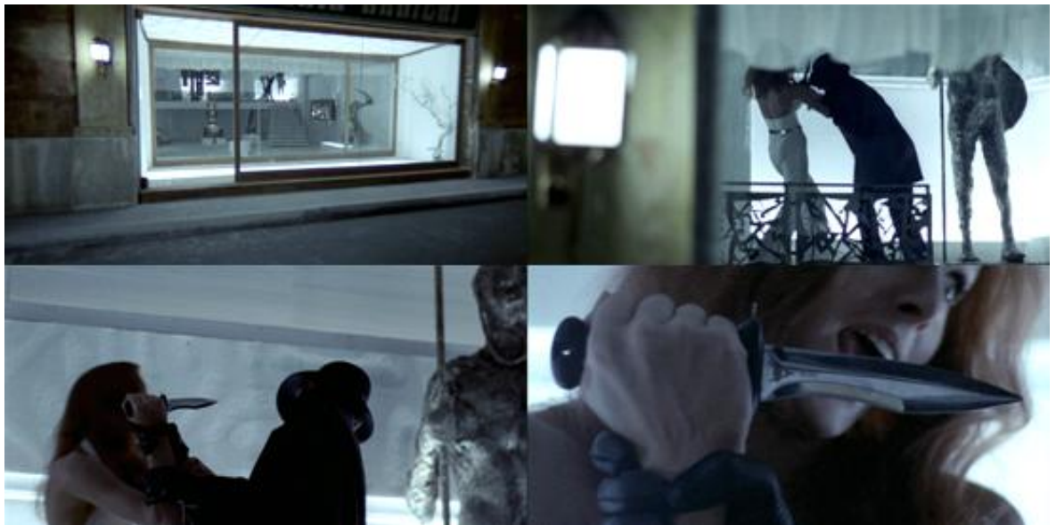
Reconstruire la vérité en examinant l'image, dans l'ultime flashback de L'Oiseau au plumage de cristal

criminels au lieu d'un grâce à l'analyse proprement cinématographique de son souvenir (la synchronisation du son sur les lèvres mouvantes de Berti), mais trop tard, et il est immédiatement tué à son tour. Dans Phenomena et Trauma , enfin, les protagonistes ne se remémoreront ce qu'elles ont vu qu'une fois prisonnières de l'antre du meurtrier.