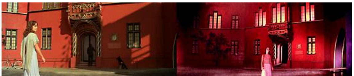
Le trajet accompli dans Suspiria : un vain retour au point de départ