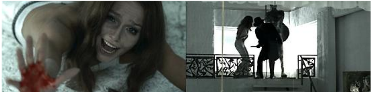
Temps forts de l'agression de L'Oiseau au plumage de cristal : essence du traumatisme et plaisir de l'écho