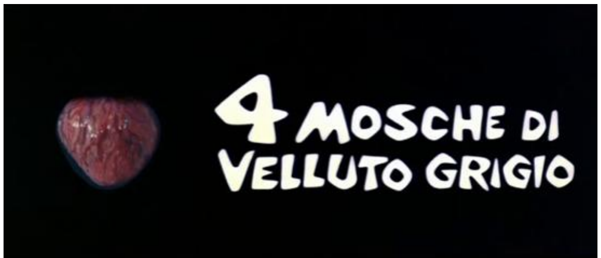
Le mouvement de la vie s'insinue dans le générique de Quatre mouches de velours gris