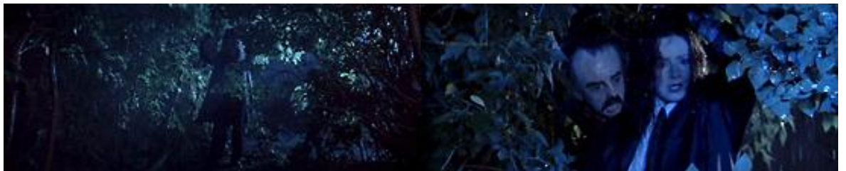
L'invisible trucage de Trauma dévoilé par le flashback