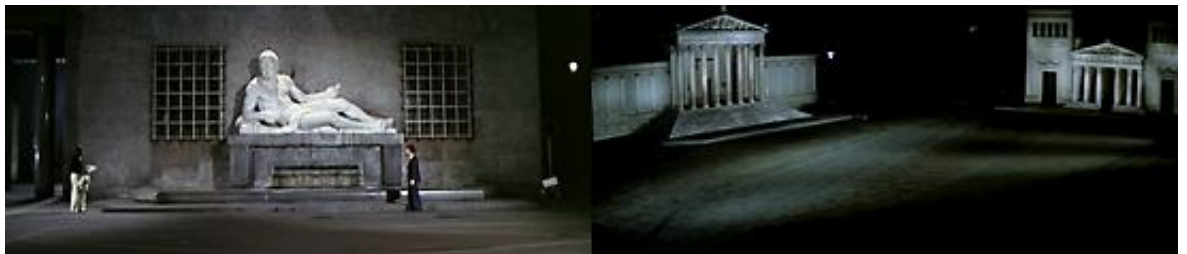
Des angles et des compositions travaillés révèlent les décors, dans Les Frissons de l'angoisse et Suspiria

colonne surmontée d'une statue dont j'ai su par la suite qu'elle était celle de l'Arioste. Vu dans cette perspective, entre ces deux parois de pierre noircies qui semblaient être les murs d'un sanctuaire antique, le monument se parait d'un je ne sais quoi de solennel, de sorte que le passant, même aucunement porté sur la métaphysique, se serait attendu à entendre monter du fond de la place les prédications d'un dieu. » 271 Argento l'a bien compris quand il joue jusqu'à l'étrange de la profondeur et des perspectives, à la fois accentuées et brisées, de la place sur laquelle est tué le pianiste Daniel, grâce à des éclairages complexes qui ménagent des zones d'ombre et de lumière isolées et irréelles, ou encore lorsque, au début des Frissons de l'angoisse , il cite clairement le célèbre tableau La Joie et les Énigmes de l'heure étrange de Giorgio de Chirico en filmant singulièrement une place à l'architecture saisissante (« avec ses arcades abondantes et ses perspectives écrasantes, et la "statue silencieuse" qui renvoie à son Ariane endormie » 272 ) : « l'objet pourvu de métaphysique doit être vu d'une certaine façon et sous un certain angle pour pouvoir apparaître dans sa véritable dimension. » 273 Alors seulement, « une révélation peut naître tout d'un coup », simplement « par la vue de quelque chose comme un édifice, une rue, un jardin, une place publique » 274 , mais pris d'une certaine manière bien précise.