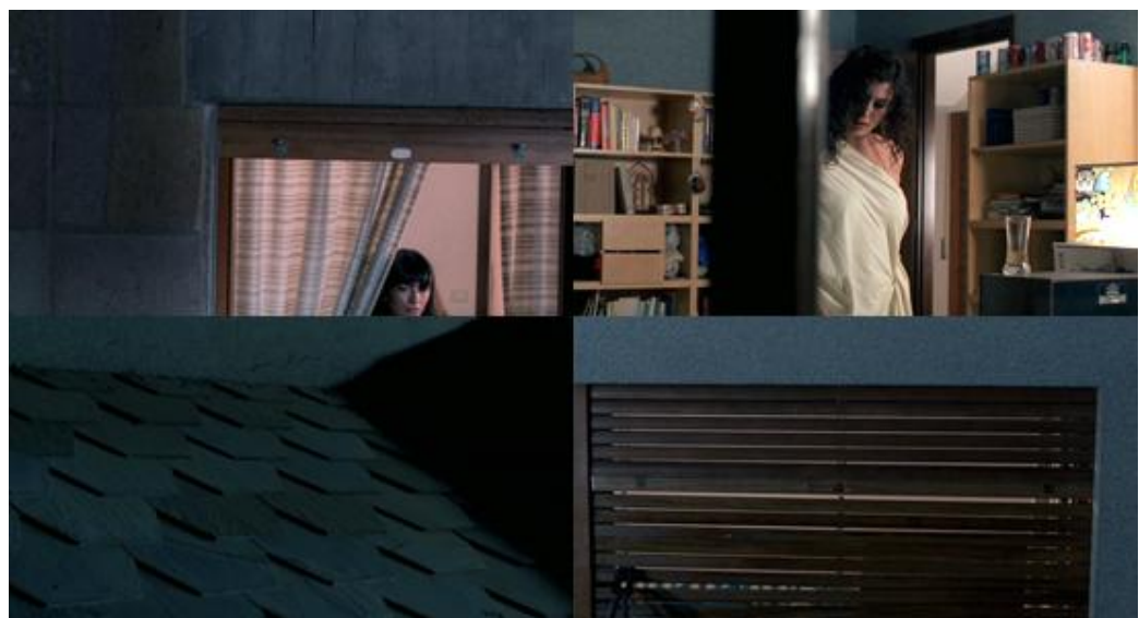
La complexité du travelling en Louma de Ténèbres

Après une dispute avec sa partenaire, la jeune journaliste féministe de Ténèbres , restée seule dans son salon, est alarmée par un bruit suspect. Alors qu'elle écarte les rideaux pour scruter les alentours de sa maison, un plan la présente de face, de l'autre côté de la fenêtre. Fixe un instant, la caméra entame aussitôt un long travelling tortueux de plus de deux minutes, quittant la journaliste par un mouvement ascendant en diagonale, déambulant ensuite lentement sur les murs et les volets pour retrouver sa compagne à l'étage, qu'elle abandonne presque immédiatement pour repartir dans un nouveau parcours complexe, qui, passant cette fois non seulement par la façade mais aussi par les tuiles du toit, s'arrêtera finalement sur les mains du tueur, occupé à couper avec des pinces les volets d'une fenêtre du rez-de-chaussée.