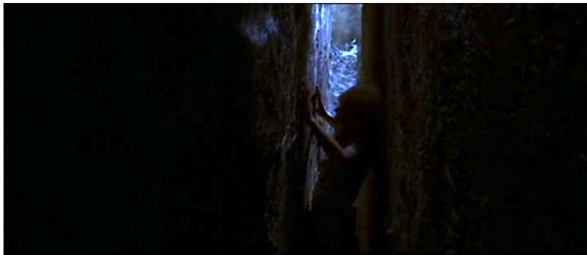
Une « diagonale dynamique », dans Quatre mouches de velours gris

buste en avant, la taille rompue » 37 , exactement comme le personnage de la bonne dans Quatre mouches de velours gris , qui, acculée par le meurtrier, tente de s'enfuir par un couloir dont les parois, plus resserrées au bout qu'à l'entrée, l'emprisonnent.