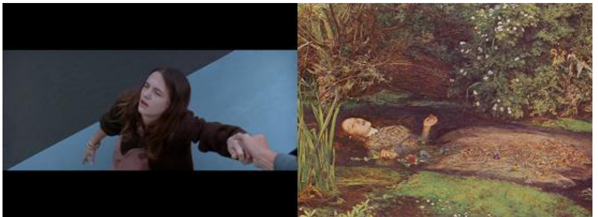
L'Ophélie dynamique et épurée de Trauma

dans laquelle elle a plongée, Argento épure la scène au maximum pour en exalter l'impression cinétique, résumant le cadre à deux lignes contraires, la diagonale du pont de béton et sa perpendiculaire, le courant ascendant des flots, qui menace de happer Aura. De manière plus flagrante encore, la photographie en demies-teintes de Suspiria se distingue nettement de l'éclairage expressionniste d'un Phenomena : loin de s'inscrire dans une simple dialectique du clair et de l'obscur, les jeux de lumière colorée et mouvante de Luciano Tovoli aboutissent à une véritable « couleur-mouvement » 28 , créant sans cesse de nouvelles formes géométriques et évoquant comme un tableau cubiste en mouvement. Ce « mouvement alternatif » 29 de la lumière trouvera son paroxysme dans la brève séquence où Suzy est éblouie par l'objet réfléchissant qu'agite la cuisinière de l'école de danse, l'éclairage général du couloir s'altérant au rythme du balancement du métal.