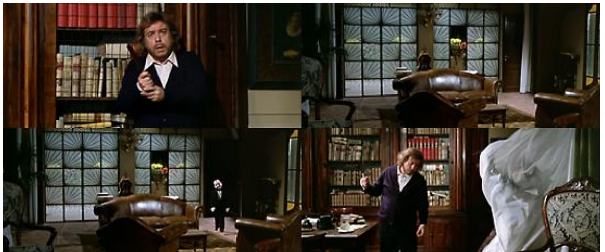
L'animation très humaine d'un décor foisonnant, dans Les Frissons de l'angoisse

professeur a bien le temps de lui administrer un lourd coup de couteau qui le met à terre. Pourtant, ce n'est pas de la porte ouverte sur laquelle était centrée la caméra que vient l'automate, mais de celle juste à côté de la première, fermée, qu'il ouvre comme magiquement. Et si le professeur rit d'abord de voir l'automate cassé se débattre sur le sol, un autre plan montre son visage qui s'assombrit et regarde, intrigué, la machine qui l'a attaqué comme de son propre chef. Finalement, la véritable meurtrière, cachée derrière un rideau, surprend Giordani en surgissant de sa gauche, et le frappe avec un tisonnier. Le plan moyen qui la montre se jeter sur lui prend d'abord une valeur de preuve objective que l'automate a bel et bien agi sans aide, et a donc eu l'intelligence d'ouvrir seul la porte ; mais plus encore, ce plan très bref, qui ne laisse voir au spectateur que le gonflement du rideau d'où point le tisonnier (sans qu'aucune main ne soit visible), donne l'impression que c'est presque le rideau lui-même, en tant qu'objet du décor animé de mouvements psychiques humains, qui vient tuer le Professeur Giordani.