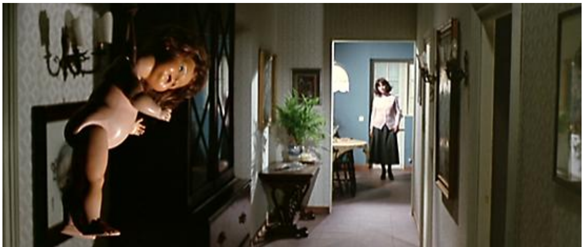
La poupée à l'image de l'humain : l'« inquiétante étrangeté » dans Les Frissons de l'angoisse

Dans les Frissons de l'angoisse , le travelling sus-décrit n'est pas le seul plan du film à s'attarder sur des fétiches chers à la mère de Carlo et associés à sa pulsion homicide : hantée par un univers puéril (qui correspond au cadre de son traumatisme originel, à savoir son premier meurtre, qui se déroula, à Noël, sous le sapin et les yeux de son enfant), la criminelle aime à précéder ses entrées, non seulement du son d'une comptine enfantine, mais aussi en disposant des jouets chez ses victimes. Avant d'être ébouillantée, Amanda Righetti découvre ainsi dans sa maison, en guise de signe macabre, une poupée pendue au bout d'une petite corde, et le Professeur Giordani, avant son meurtre sauvage, est attaqué par un automate très inquiétant qui, avançant à pas rapides, traverse, dans un plan fixe comme tétanisé, toute la profondeur du champ pour se rapprocher de la caméra. Cette inquiétude très particulière qu'on ne peut manquer de ressentir, Freud l'a méticuleusement analysée dans son essai L'Inquiétante étrangeté – sans doute celui de ses écrits à la portée la plus directement esthétique. Il y décrit notamment ce « sentiment étrangement inquiétant associé aux poupées et aux automates qui, affirme-t-il, trouve son origine dans la peur puérile que l'inanimé ne prenne vie, dans le souhait puéril que l'inanimé prenne vie, ou dans les deux. » 174