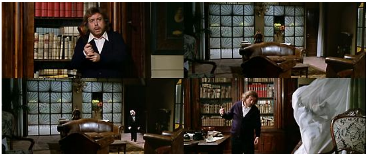
L'animation très humaine d'un décor foisonnant, dans Les Frissons de l'angoisse

professeur a bien le temps de lui administrer un lourd coup de couteau qui le met à terre. Pourtant, ce n'est pas de la porte ouverte sur laquelle était centrée la caméra que vient l'automate, mais de celle juste à côté de la première, fermée, qu'il ouvre comme magiquement. Et si le professeur rit d'abord de voir l'automate cassé se débattre sur le sol, un autre plan montre son visage qui s'assombrit et regarde, intrigué, la machine qui l'a attaqué comme de son propre chef. Finalement, la véritable meurtrière, cachée derrière un rideau, surprend Giordani en surgissant de sa gauche, et le frappe avec un tisonnier. Le plan moyen qui la montre se jeter sur lui prend d'abord une valeur de preuve objective que l'automate a bel et bien agi sans aide, et a donc eu l'intelligence d'ouvrir seul la porte ; mais plus encore, ce plan très bref, qui ne laisse voir au spectateur que le gonflement du rideau d'où point le tisonnier (sans qu'aucune main ne soit visible), donne l'impression que c'est presque le rideau lui-même, en tant qu'objet du décor animé de mouvements psychiques humains, qui vient tuer le Professeur Giordani.