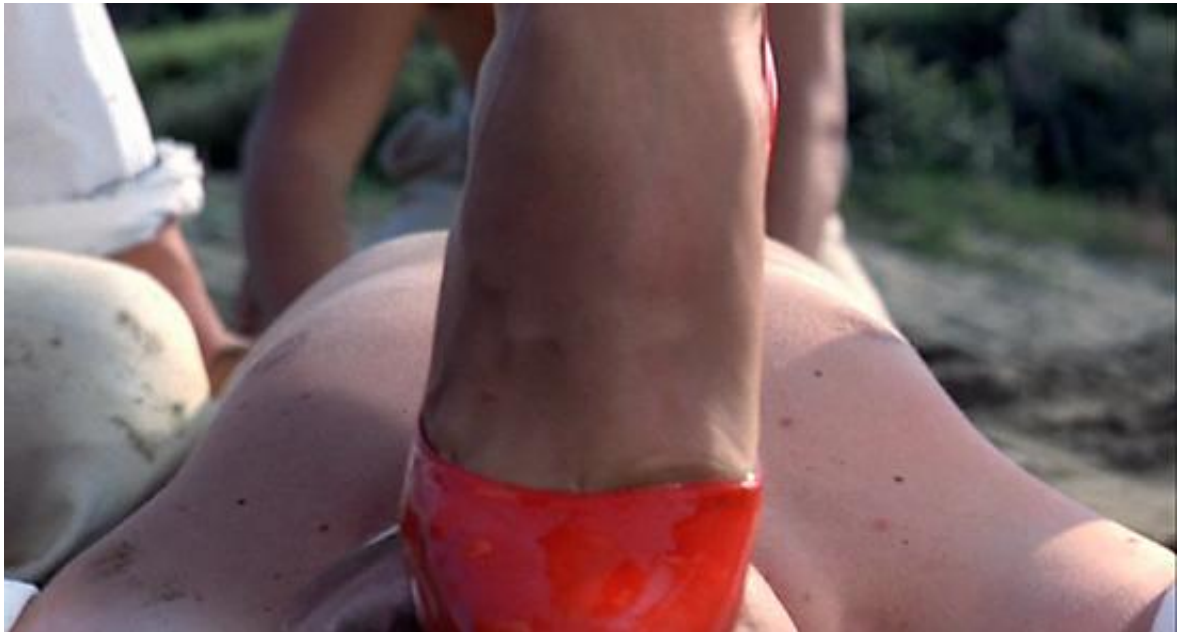
Puissance traumatique de l'image, dans le flashback de Ténébres

alors que le talon s'enfonce dans sa bouche ouverte). On voit bien ici à quel point Argento excelle à communiquer une souffrance physique à son spectateur : qu'il s'agisse de l'alternance du rythme qui met en relief la brutalité des temps forts, du montage et du cadrage qui accentuent la violence des coups, ou du choix des accessoires et décors (la chaussure à talon et l'empreinte dans le sable) qui rendent plus sensibles l'action, tout apparaît bien au service d'une esthétique du traumatisme.