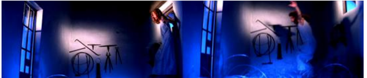
Le basculement, en un panoramique descendant, d'un espace indécidable, dans Suspiria

papier peint de l'amie de Pat Hingle), comme ce travelling qui abandonne progressivement Suzy et le Professeur Milius au profit de leur reflet sur une baie vitrée, dans « une sorte de phénoménologie du latent » 97 , comme, enfin, l'image finale des Frissons de l'angoisse , gardant Marcus Daly captif de son propre reflet dans une flaque de sang qui, filmée plein-cadre, joue de cette permutabilité de l'image réelle et de son double.