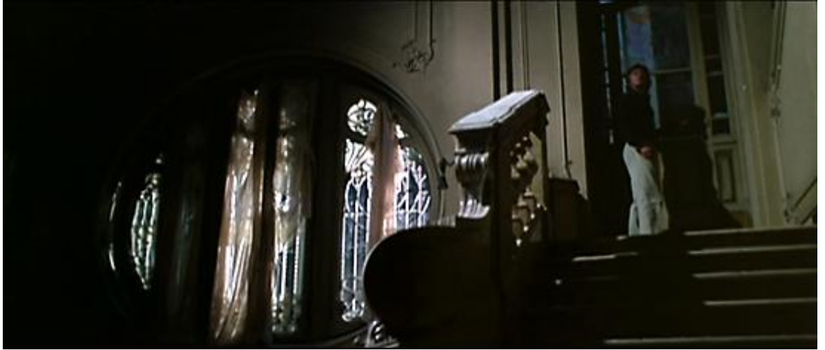
Le protagoniste relégué à la marge d'un décor puissant, dans Les Frissons de l'angoisse