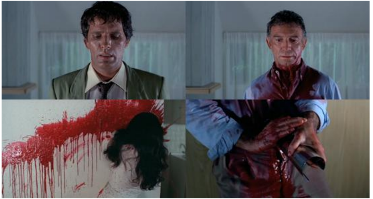
Trois aspects du travail créatif du cinéaste : la réflexivité, le sang comme peinture et l'art meurtrier

Il n'est pas anodin, d'ailleurs, que ce soit presque toujours les mains du réalisateur qui doublent celles des criminelles dans ses films, lui permettant ainsi d'affirmer sans crainte qu'il est « franchement expert dans ce domaine » et qu'il ferait « sans doute un bon meurtrier » 81 (des propos sur lesquels Argento est revenu depuis les années 1980, à force de critiques stipulant que « si les spectateurs sont exposés à suffisamment d'images d'horreur, ces images les contamineraient prétendument d'un désir d'accomplir des actes de violence réelle » 82 ; des blâmes contre lesquels Ténèbres en 1982 et Terreur à l'opéra en 1987 sont directement dirigés : « si quelqu'un est tué avec un revolver Smith & Wesson, allez-vous interroger le président de Smith & Wesson ? », demande l'écrivain Peter Neal à l'inspecteur de Ténèbres ). Affirmant toujours plus sa proximité avec les psychopathes et leur mode de pensée, le cinéaste italien assure également que « tout au fond de lui, [il] aime [ses criminels] » 83 . Et c'est ainsi presque comme un psychopathe que cet esthète de l'homicide choisit les victimes de ses films, comme en témoigne cet aveu singulier : « j'aime les femmes, et particulièrement les belles femmes ; si elles ont un beau visage et une belle silhouette, je préférerais de loin les voir se faire assassiner plutôt qu'une