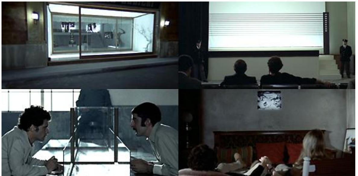
L'obsession visuelle du motif du rectangle redouble l'écran dans L'Oiseau au plumage de cristal