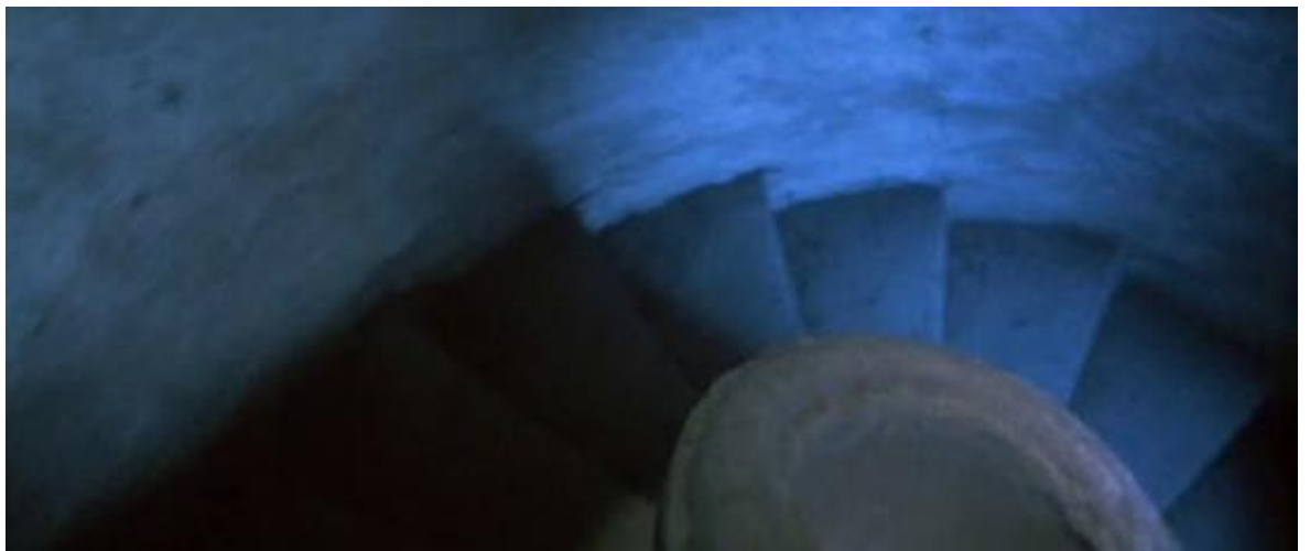
Vertige et sensibilité, une image de la cruauté, dans Terreur à l'opéra