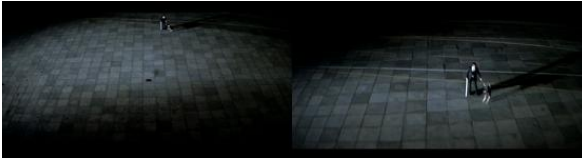
La caméra suspendue survole la place, dans Suspiria

lequel l'équipe du film a dû laisser glisser la caméra le long d'un câble, et la faire remonter juste avant qu'elle ne heurte le sol, donnant finalement cet effet de survol effréné de la place. 16