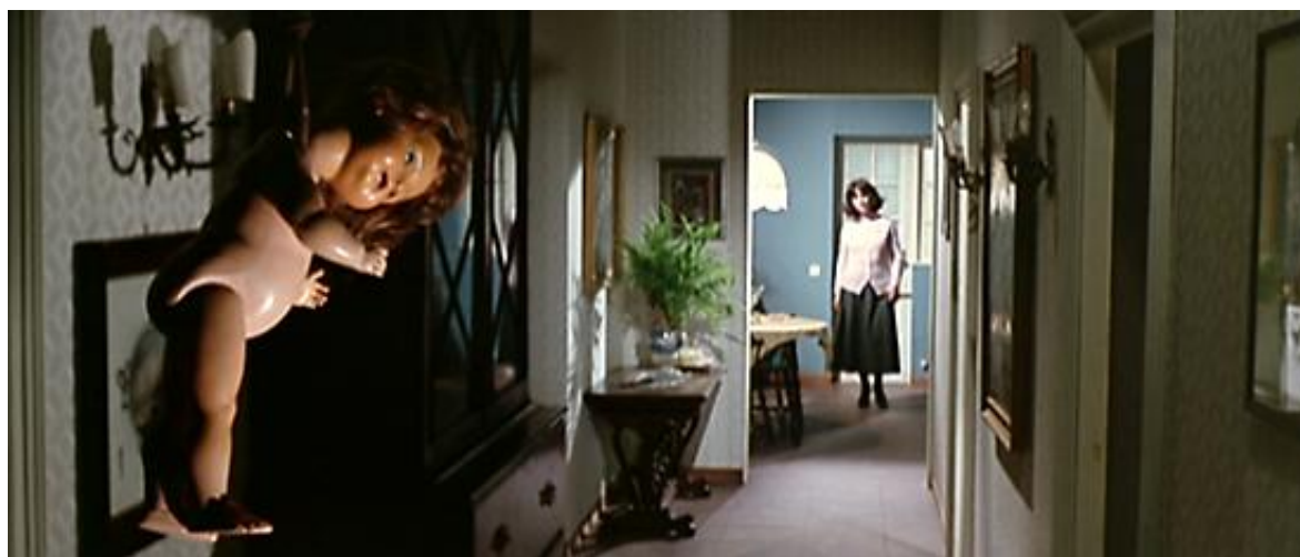
La poupée à l'image de l'humain : l'« inquiétante étrangeté » dans Les Frissons de l'angoisse

Dans les Frissons de l'angoisse , le travelling sus-décrit n'est pas le seul plan du film à s'attarder sur des fétiches chers à la mère de Carlo et associés à sa pulsion homicide : hantée par un univers puéril (qui correspond au cadre de son traumatisme originel, à savoir son premier meurtre, qui se déroula, à Noël, sous le sapin et les yeux de son enfant), la criminelle aime à précéder ses entrées, non seulement du son d'une comptine enfantine, mais aussi en disposant des jouets chez ses victimes. Avant d'être ébouillantée, Amanda Righetti découvre ainsi dans sa maison, en guise de signe macabre, une poupée pendue au bout d'une petite corde, et le Professeur Giordani, avant son meurtre sauvage, est attaqué par un automate très inquiétant qui, avançant à pas rapides, traverse, dans un plan fixe comme tétanisé, toute la profondeur du champ pour se rapprocher de la caméra. Cette inquiétude très particulière qu'on ne peut manquer de ressentir, Freud l'a méticuleusement analysée dans son essai L'Inquiétante étrangeté – sans doute celui de ses écrits à la portée la plus directement esthétique. Il y décrit notamment ce « sentiment étrangement inquiétant associé aux poupées et aux automates qui, affirme-t-il, trouve son origine dans la peur puérile que l'inanimé ne prenne vie, dans le souhait puéril que l'inanimé prenne vie, ou dans les deux. » 174