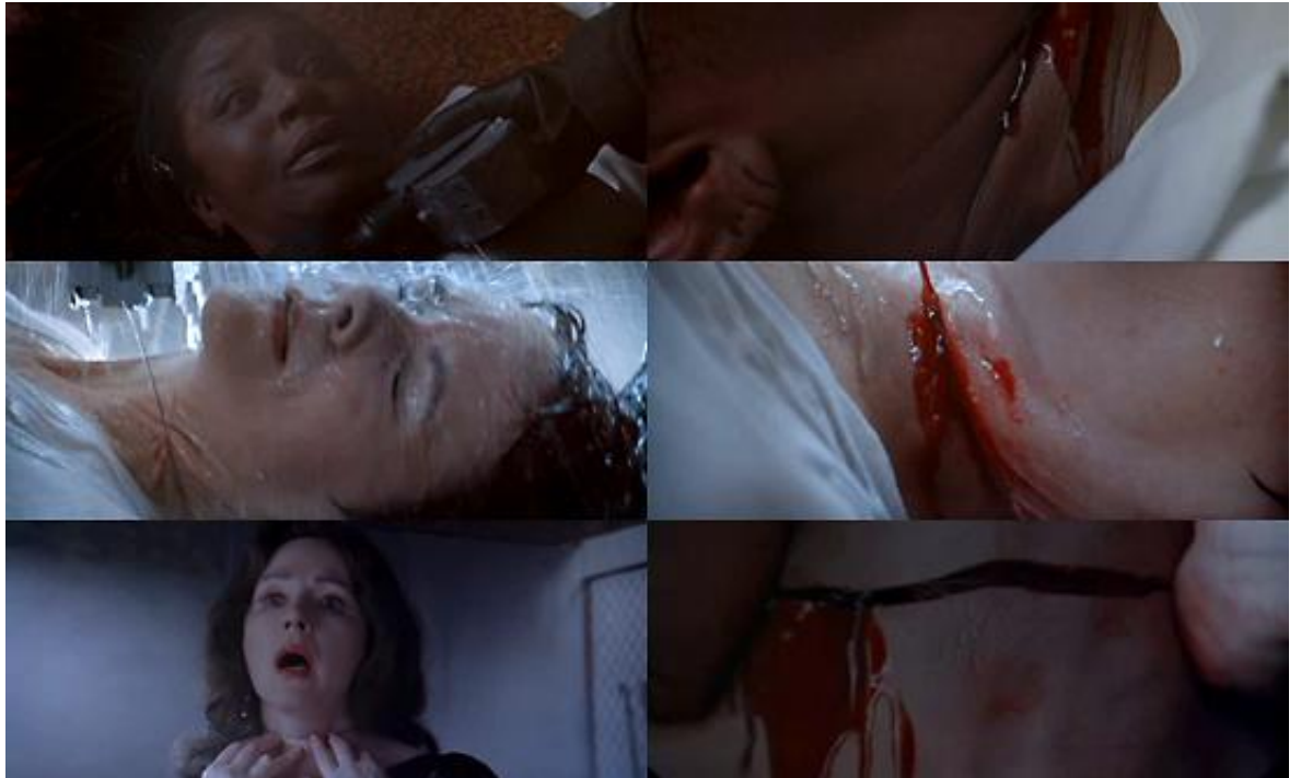
Répéter la mort à l'identique pour mieux l'appréhender, dans Trauma