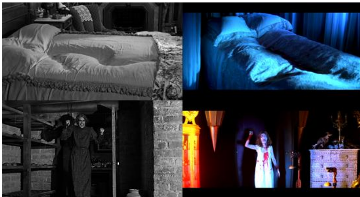
Citations et inversions de l'œuvre d'Hitchcock dans Suspiria

Norman Bates et son fils occupe celle de Mrs. Bates » 55 . En somme, à force de fascination pour la schizophrénie, c'est comme si le jeu d'échanges et d'inversions cher à Argento s'emballait, inspirant la névrose et sa confusion à une pure imitation scénographique d'Hitchcock elle-même.