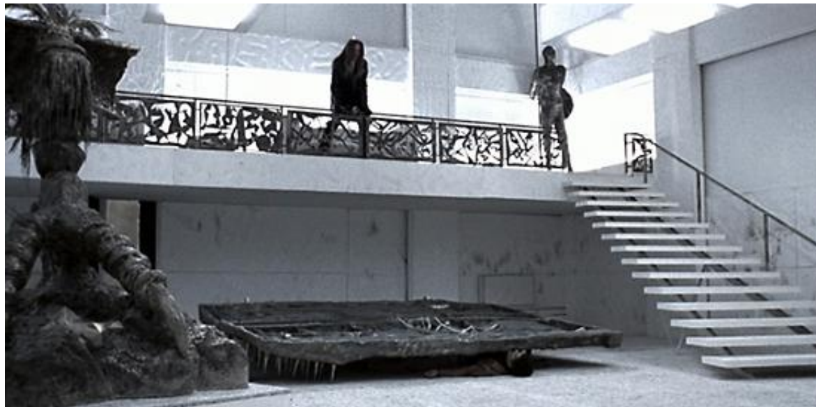
L'œuvre d'art écrasante dans L'Oiseau au plumage de cristal : une métaphore de l'alourdissement du rythme

dans le final de Ténèbres » 149 , à une métaphore de cette pesanteur écrasante qui, autant que la rapidité des mouvements de la diégèse « actuelle », caractérise le film de Dario Argento.