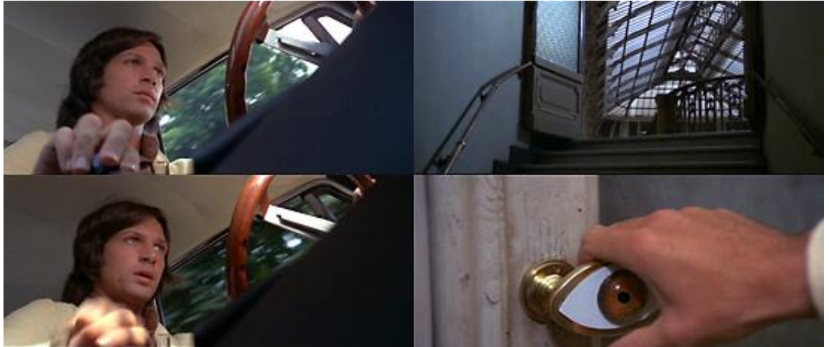
Le montage par recouvrements successifs de Quatre mouches de velours gris

ce que métaphorise cette image du détective en train de repeindre les murs de son bureau quand Roberto ouvre sa porte.