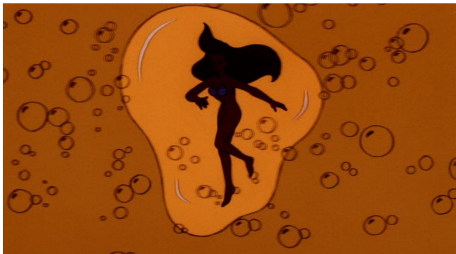
The Little Mermaid