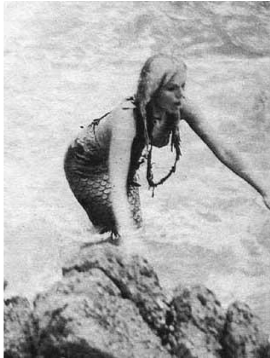
Beach Blanket Bingo