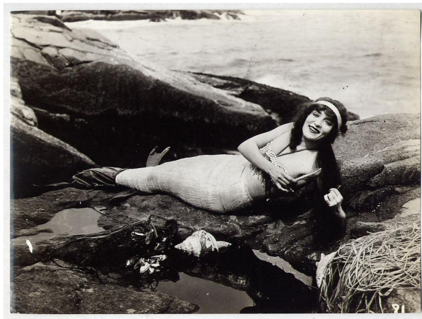
Siren of the sea avec Annette Kellermann