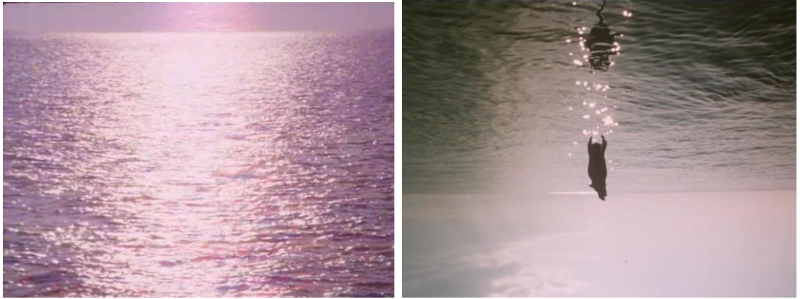
Malá Mořská Víla