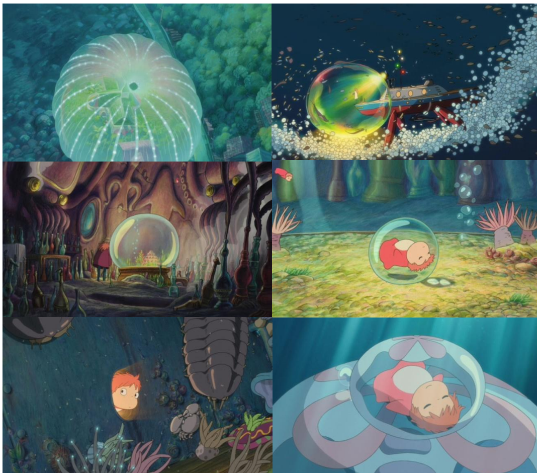
Gake no ue no Ponyo