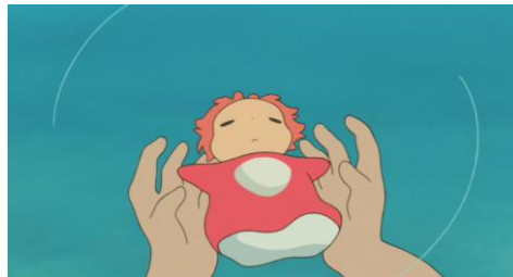
Gake no ue no Ponyo