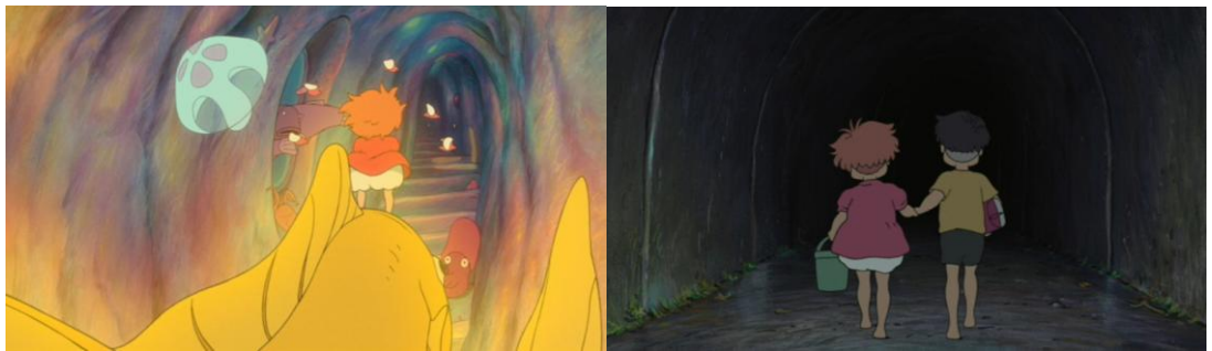
Gake no ue no Ponyo