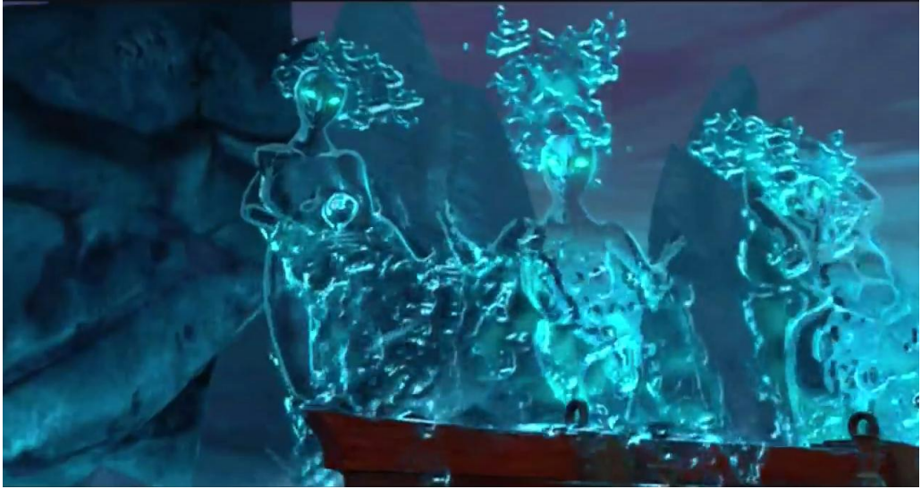
Sinbad : Legend of the Seven Seas