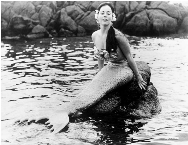
Mermaids of Tiburon