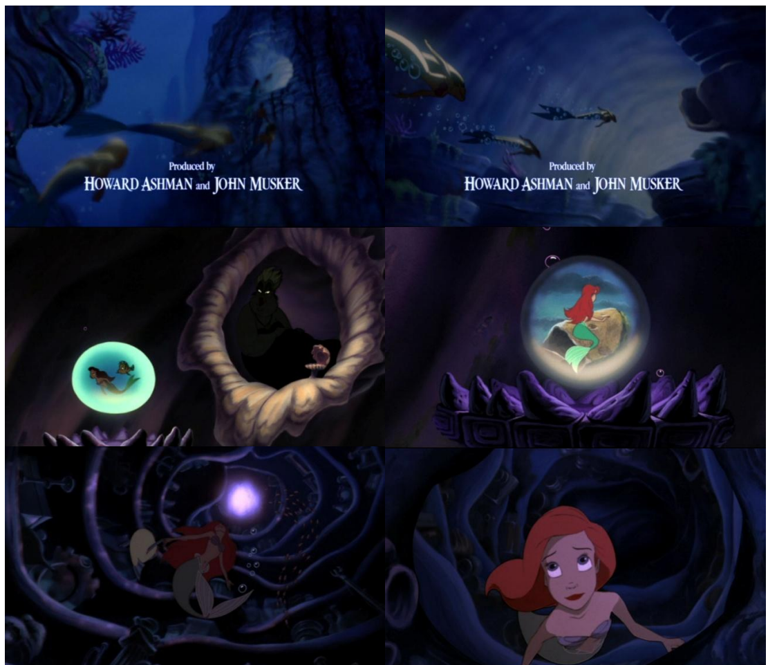
The Little Mermaid