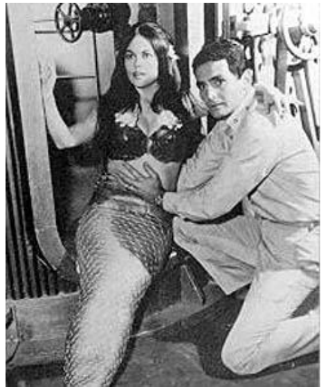
Voyage to the bottom of the sea