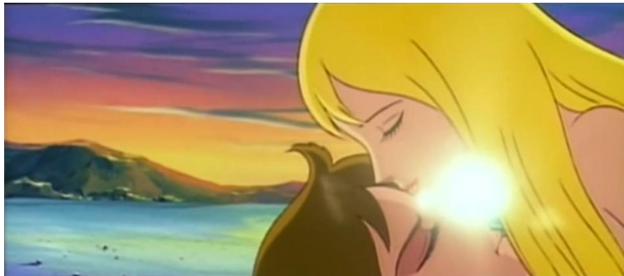
Andasen dōwa ningyo-hime