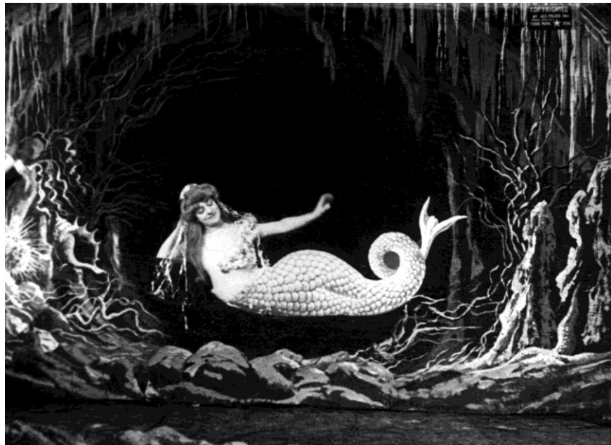
La sirène de Georges Méliès