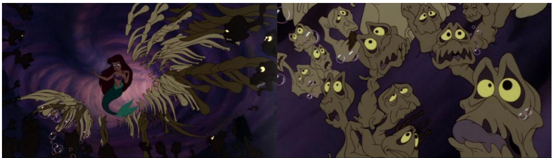
The Little Mermaid