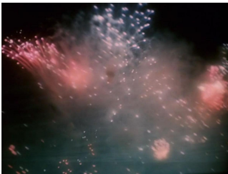
Malá mořská víla