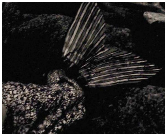
La sirène d'Auderville