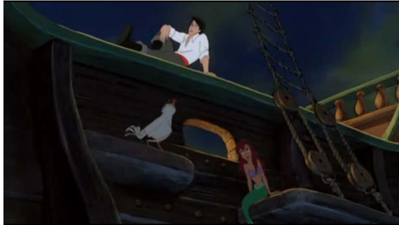
The Little Mermaid