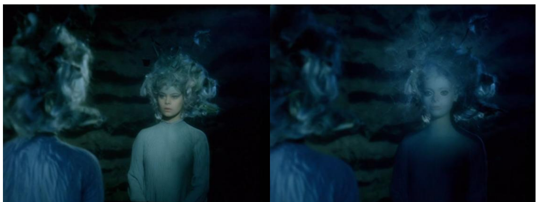
Malá Mořská Víla