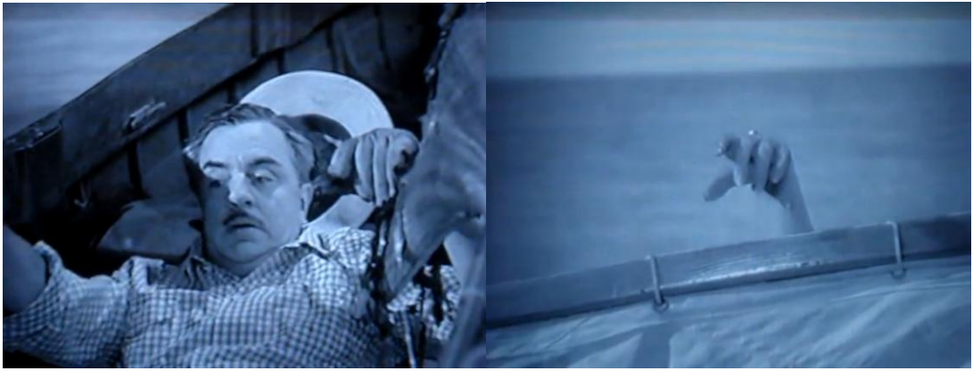
Mr Peabody and the mermaid