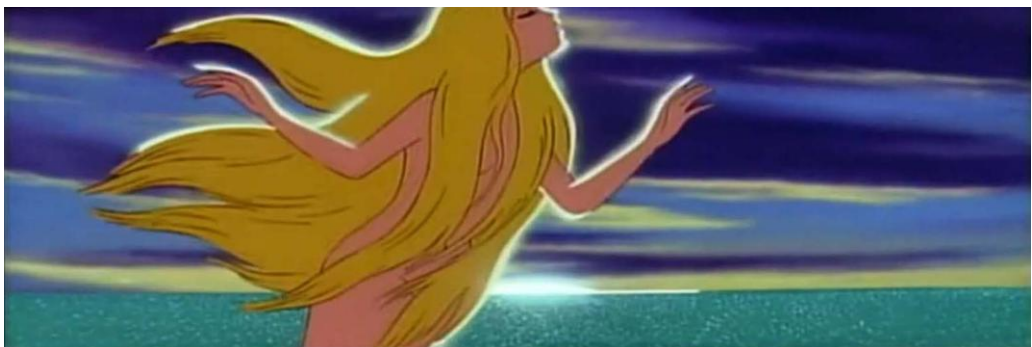
Andasen dôwa ningyo-hime