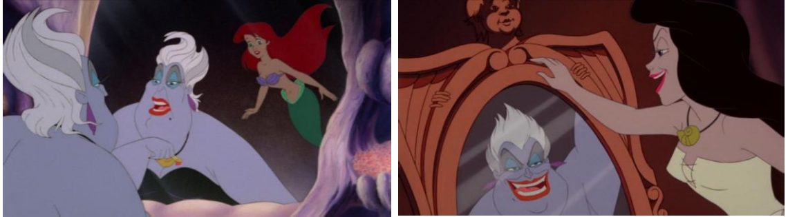
The Little Mermaid