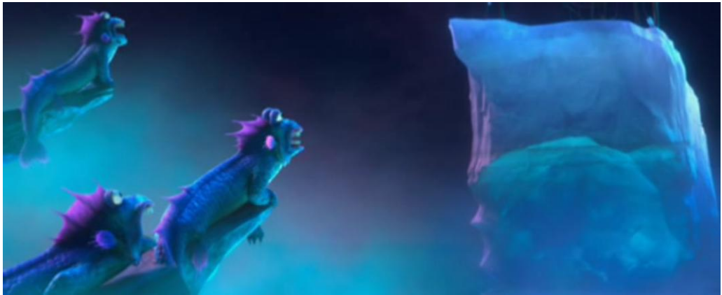
Ice Age: Continental Drift