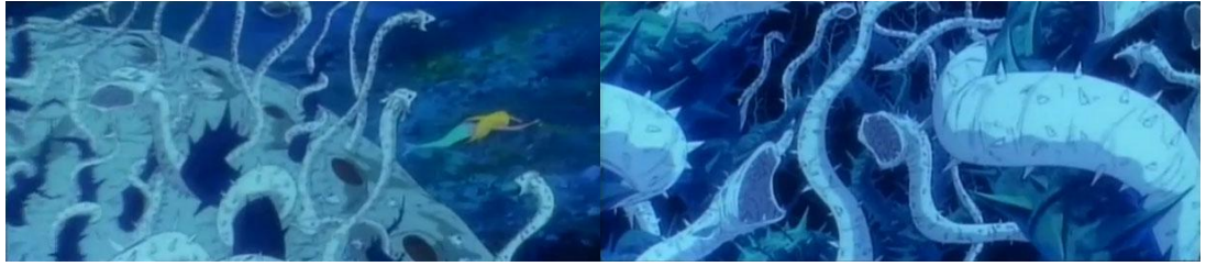
Andasen dôwa ningyo-hime