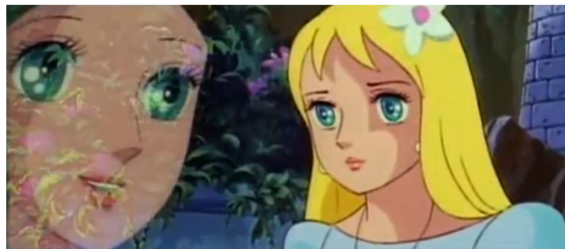
Andasen dôwa ningyo-hime