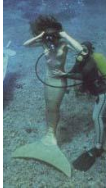
Un amour plein d'arêtes