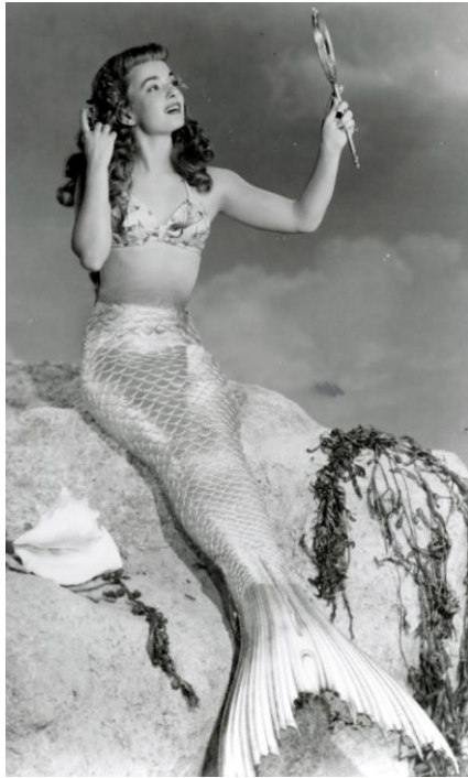
Mr Peabody and the mermaid