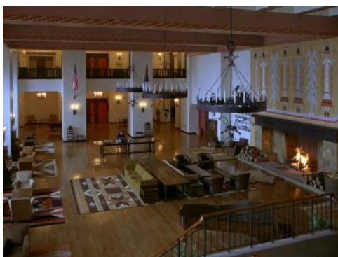
Ci-contre, quelques représentations des Indiens au sein du film.

Les objets de l'hôtel semblent également connoter la folie grandissante des pensionnaires hivernaux. Progressivement, Jack abandonne ses habitudes de travail et se tourne vers le divertissement commun aux fantômes de l'Overlook Hotel. Si ceux-ci sont les invités de réceptions fastueuses, l'hôtel ne semble pas les inciter au travail. Ainsi, si Jack Torrance joue avec une balle de tennis dans de grandes pièces, c'est qu'il est détourné de l'esprit laborieux dans lequel il se trouvait à son arrivée, déterminé à écrire une nouvelle œuvre littéraire. Il s'abandonne au divertissement, abandon dont la cristallisation est rendue effective dans les deux images finales du long-métrage : dans l'homme gelé dans la neige, ainsi que dans la photographie mémorielle du bal annuel du 4 juillet 1921. Il change, tâtonne, oscille tout comme la balle va et vient entre le mur et les mains de Jack, avant de se perdre parmi les fantômes de l'hôtel auquel il finit par appartenir lui aussi.