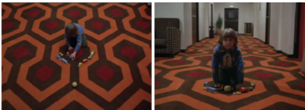
Ci-dessus, mise en valeur du motif ouvert/fermé de la moquette, lors de l'arrivée de la balle aux pieds de Danny.

psychédélique a un caractère hypnotique auquel succombent les protagonistes. Il renvoie au parcours déambulatoire de Danny sur son tricycle dans l'hôtel, et à pieds à l'intérieur du labyrinthe. Les espaces se répondent de façon symétrique, et se referment sur l'un ou l'autre personnage.