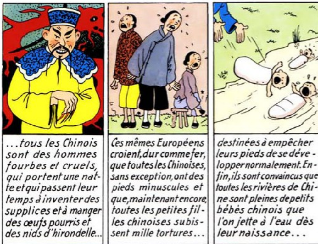
Extrait de l'album Tintin et le Lotus Bleu (1946)

En 1958, néanmoins, on se montre plus prudent : certes la Chine est une alliée de la Seconde Guerre Mondiale, mais elle est également une ennemie potentielle durant ce contexte de Guerre Froide lors de l'écriture du manuel, tandis que le Japon est repassé du côté du bloc de l'Ouest. De cette manière, on trouve des explications justifiant l'impérialisme japonais pendant la première partie du XX e siècle, à savoir « des causes stratégiques », « des causes économiques » et « des causes psychologiques ». En outre, il est précisé, lors de la prise de Port-Arthur au nord de la Chine par les Japonais en 1895, que les Russes convoitaient également, que si la France a soutenu la Russie face au Japon, elle l'a fait « à contre-cœur, par simple fidélité pour l'alliance » tandis que « l'Angleterre n'intervient pas (« le Japon est une puissance d'avenir », déclare lord Rosebery) ».