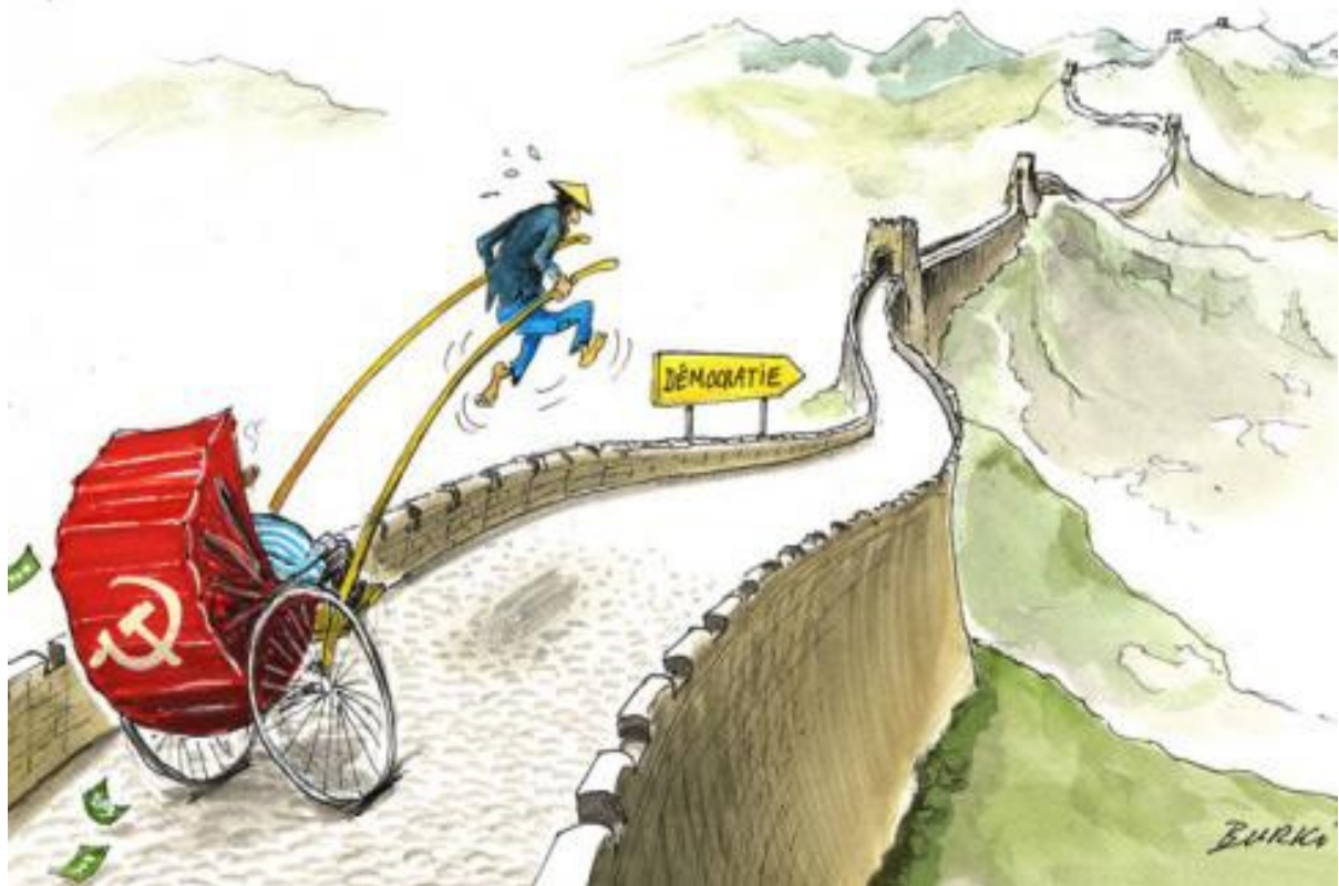
Caricature de Raymond Burki dans Le Courrier International de janvier 2014