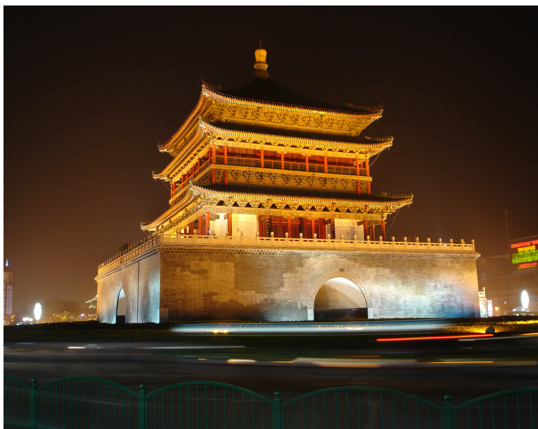
Tour de l'Horloge, Xi'an, province du Shaanxi