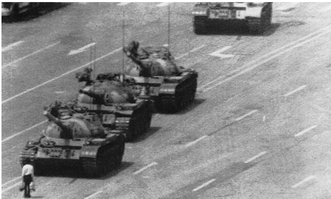
Événements de Tian An Men en 1989