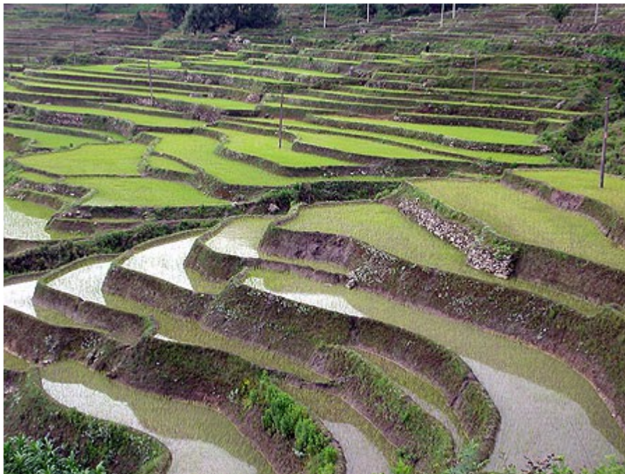
Rizières dans le Sud de la Chine

Et d'ajouter que « La côte est devenue un gigantesque atelier qui fournit au pays des devises, des savoir-faire et un nouvel art de vivre ». Pourtant, le manuel scolaire Hachette de 1989 souligne l'existence d'une « Chine à deux vitesses ». En effet, les auteurs exposent le « boom » que connaît l'industrie chinoise en 1988, à côté des calamités que connaît l'agriculture du pays la même année.