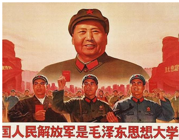
Affiche de propagande maoïste contre le révisionnisme

En 1984, le discours sur la politique chinoise est, à l'inverse, sans concession. Par exemple, on trouve des affiches de propagande chinoise contre le révisionnisme parmi les documents d'Histoire. D'autre part, bien que l'on décrive une commune populaire ainsi : « Elle possède des écoles primaires dans toutes les brigades, 17 écoles secondaires (...) et une école technique agricole, un hôpital de 29 chambres (...) », on affirme par ailleurs que « Le « Grand Bond en avant » aboutit finalement à un échec ». Quant à la Révolution Culturelle, déclenchée en 1966, son « bilan est lourd : de un à deux millions de morts, une production désorganisée, la fermeture des écoles et des universités ».