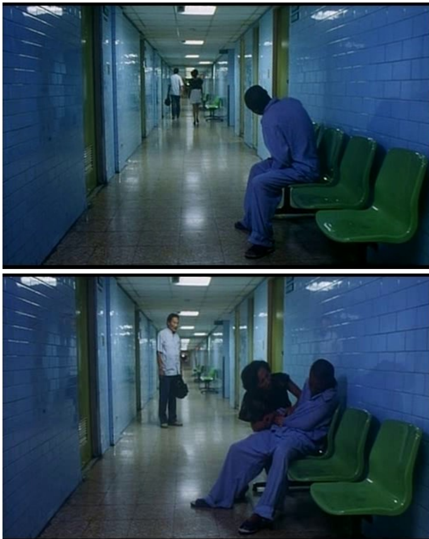
Les parents passent devant leur fils, sans le reconnaître ( la Rivière ).

Si on retrouve, chez Tsai Ming-liang, l'influence de tous types de cinémas liés au corps, qu'il s'agisse de comédie musicale ( The Hole, La Saveur de la pastèque ), du cinéma érotique ou de son revers pornographique ( La Saveur de la pastèque ), c'est probablement du côté du burlesque que s'impose la filiation la plus évidente.