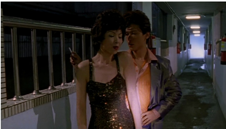
La comédie musicale, mouvement de révolte contre le quotidien ( The Hole ).