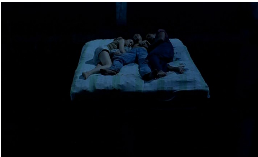
Projections multiples ( I don't want to sleep alone ).