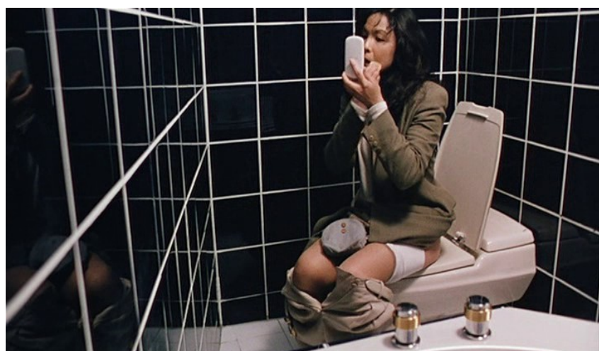
Salles d'eau ( La Saveur de la pastèque, Vive l'amour ).