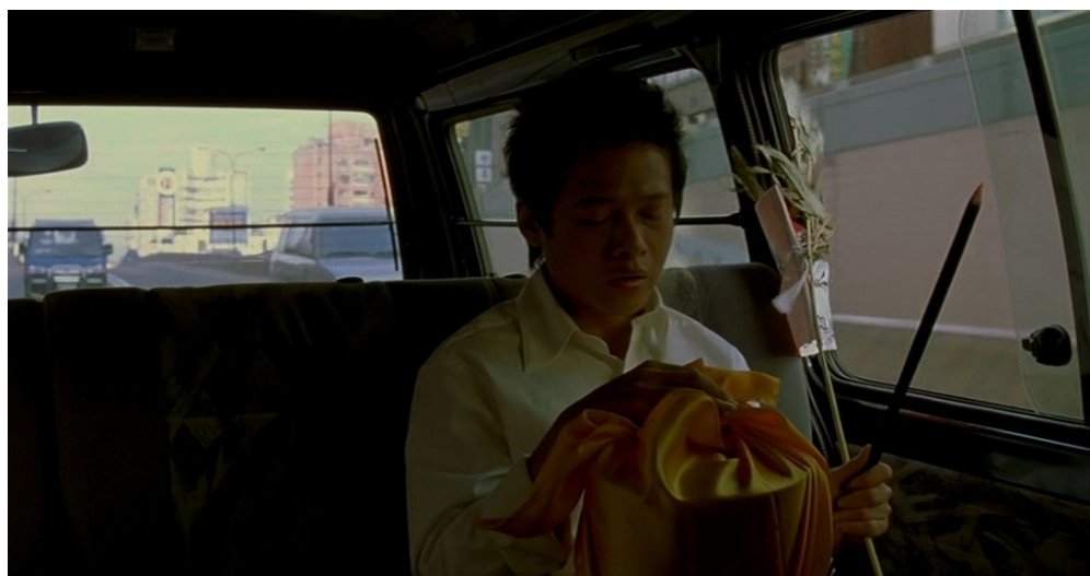
Les 2 premiers plans d' Et là-bas quelle heure est-il ? : disparition progressive du père, et deuil.