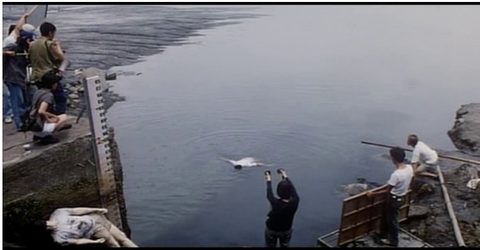
Un corps jeté à l'eau ( la Rivière ).

Le cinéaste raconte comment, à l'époque des dramatiques télé, il avait un jour forcé un comédien à sauter dans un fleuve : "il a pris un bouillon qui l'a rendu malade plusieurs jours à cause de la pollution" 16 , le pire étant qu'il ne garda finalement pas la séquence au montage (ce qui rendit, de droit, le comédien furieux). L'accident, qui le hanta longtemps, trouve évidemment son écho, plus tard, dans la Rivière . Dans ce film, le fleuve pollué fonctionne aussi comme une métaphore de la vie. Paisible et lisse en surface, mais pleine de microbes en profondeur, porteuse de mille germes, ce qui semble annoncer le Taipei apocalyptique de The Hole , dans lequel les gens en sont réduits à faire bouillir l'eau avant d'envisager de la consommer.