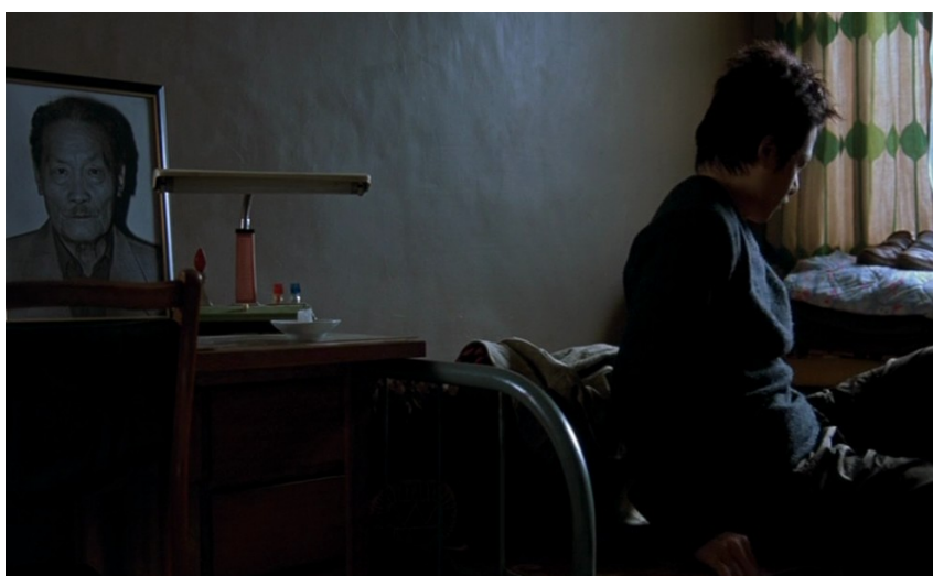
Trois solitudes ( Et là-bas quelle heure est-il ? )

La pluie incessante, dans The Hole , pouvait être vue, on l'a dit, comme l'expression plastique des limites du cadre ; elle bouche et assombrit en permanence l'espace, isolant les personnages. Pour la première fois dans ce film, Tsai passe de la figure du trio, du faux triangle amoureux de ses films précédents (ce même triangle qui donnait parfois le sentiment d'assister à des situations de "vaudeville muet"), à l'idée d'un duo. Une + une solitudes, dans un monde qui semble débarrassé, sauf rares survivances, de toute contingence humaine. C'est tout son cinéma qui s'est comme vidé, épuré, simplifié, au profit d'une équation nouvelle, d'une intrigue et d'un espace encore plus resserrés.