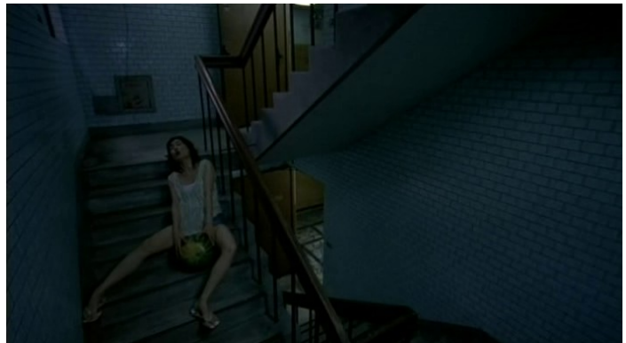
Amours de pastèque ( La Saveur de la pastèque ).