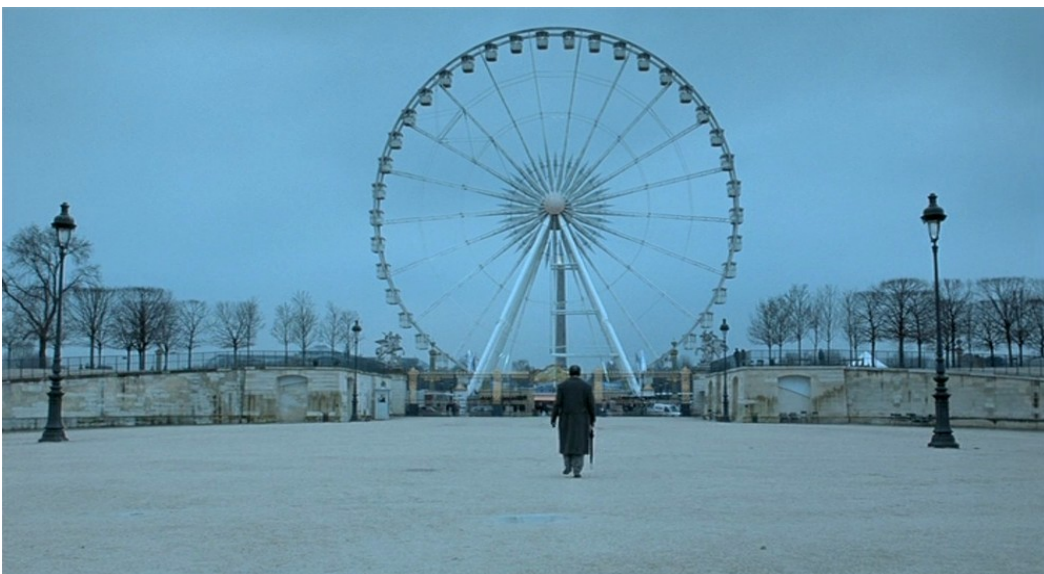
La grande roue du temps (Et là-bas quelle heure est-il ?)