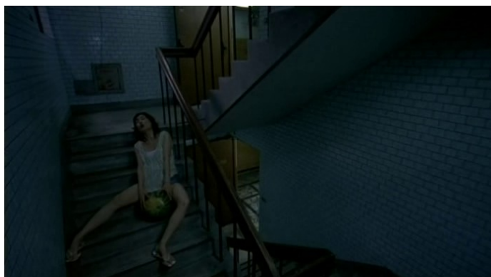
Amours de pastèque ( La Saveur de la pastèque ).