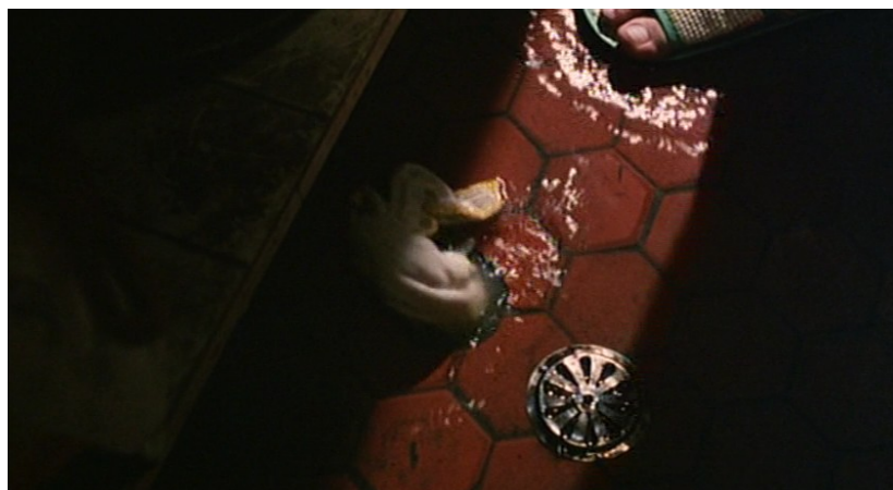
Fuites ( la Rivière, Vive l'amour, Les Rebelles du dieu néon ).