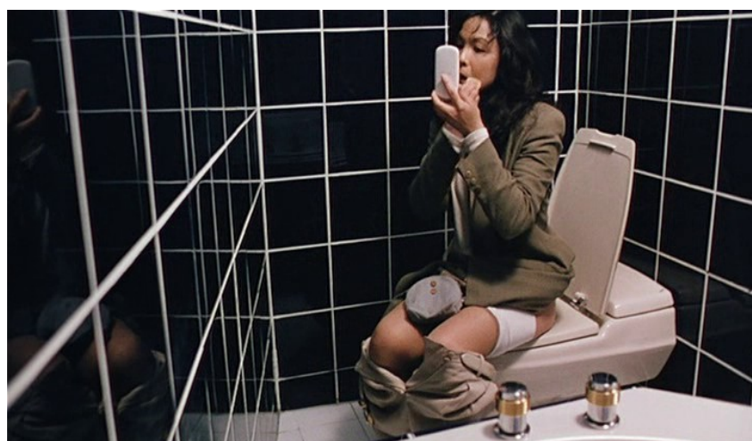
Salles d'eau ( La Saveur de la pastèque , Vive l'amour ).