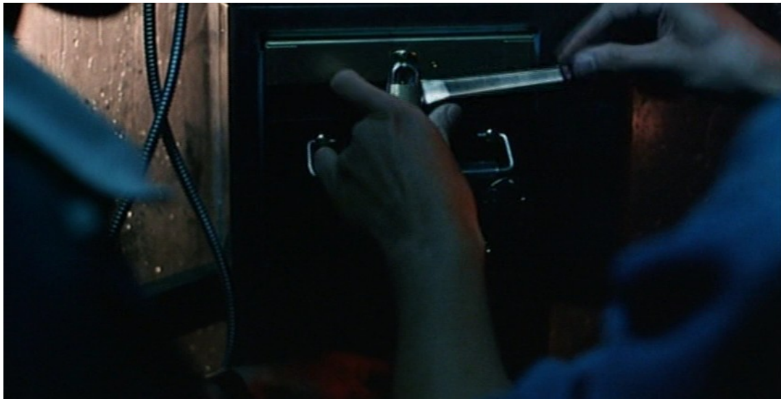
Explorer la machine ( Les Rebelles du dieu néon ).

Tsai montrait, dès Vive l'amour , un univers contaminé par le virus de l'uniformité, un monde comme privé de contours, de substance, où tout semble se répondre et se reproduire à l'infini selon une même loi d'indifférence. La communication amoureuse, dans cet univers factice, est dépoétisée par le réseau des signes matériels qui la traversent : cabine téléphonique, ascenceurs, appartements à louer, couches successives de vêtements que l'homme et la femme enlèvent laborieusement, chacun de leur côté... Les pleurs de la jeune femme de Vive l'amour surviennent alors au terme de l'ennui, de l'inertie, et du vide ; c'est tout le film qui semble se vider, en dernier lieu, via ce plan final. Vive l'amour , déclaration ambiguë, ironique, qui semble être l'écho du cri intérieur, poussé, film après film, par les personnages du cinéma de Tsai Ming-liang, ces corps qui voudraient aussi, à leur manière, aimer et être aimés.