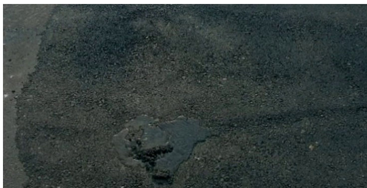
Rencontre, puis jaillissement d'une source ( La Saveur de la pastèque ).