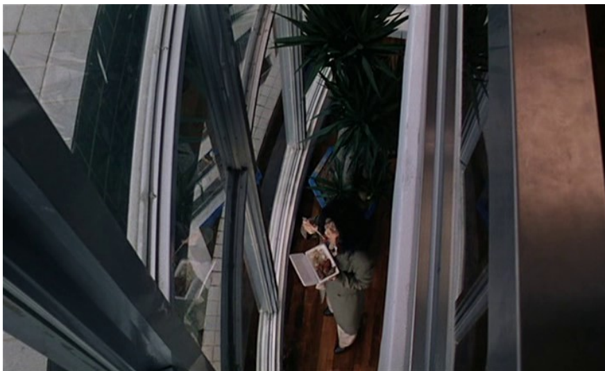
Géométrie de l'enfermement ( La Saveur de la pastèque, Vive l'amour ).