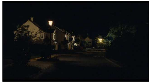
Panoramique gauche/droite situé à 10 min 36 du film.

Ces plans de rue, comme en témoigne notamment ces deux photogrammes tirés d'un panoramique situé en début de film, n'en sont pas moins inquiétants que la forêt précédemment montrée. C'est plus généralement la nuit qui est porteuse de ce sentiment de danger. Les espaces boisés demeurent un décor particulièrement efficace pour mettre en place le doute et la peur, mais Fabrice Gobert parvient tout de même, en filmant la ville, à recréer ceci. Il faut alors souligner le travail important apporté à l'éclairage, qui isole presque chaque habitation les unes des autres, et rend la route quasiment imperceptible. Chaque maison deviendrait alors un décor indépendant, la rue représenterait une succession de possibilités qui renverrait à la construction en puzzle du film : il y a autant de résolutions possibles que de points de vue.