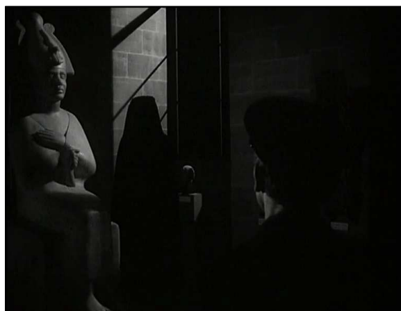
Le gardien est « écrasé » par la statue et le fantôme.

La mise en scène joue tout de même d'une envie certaine de faire « peur ». Le fantôme, qui donne son nom à la série, nous sera ainsi révélé par un zoom arrière. Un choix de mise en scène qui vient d'ailleurs, d'une certaine manière, contredire le procédé de narration. En effet, ce flashback est le souvenir du gardien, nous devrions logiquement adopter son point de vue dans la réalisation, or nous découvrons l'apparence du fantôme après lui par l'utilisation de ce travelling . Un choix qui finalement se justifie par l'effet produit : la surprise. Le spectateur découvre pour la première fois celui qui sera au cœur de la série télévisée. Son apparence reste néanmoins difficile à décrire, une sorte d'ombre noire s'inscrivant dans le décor troublant en noir et blanc du Louvre. Une seconde fois, Claude Barma, le réalisateur, fera utilisation du travelling optique arrière. Il ne s'agit plus ici tant de créer la surprise mais d'inscrire dans un même cadre le fantôme, la statue qui se trouve sur à la gauche (qui est celle de Belphégor) et le gardien de dos sur la droite. Un moyen « d'écraser » Gautrais dans le cadre, le rendre moins important, plus petit que la statue et le fantôme qui paraissent aller de pair. Cette similitude sera renforcée de suite : le gardien tire sur ce fantôme, qui ne bougera nullement, aussi statique que l'œuvre d'art à côté de lui.