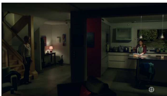
À gauche Claire, à droite Camille.

La séparation entre ces êtres, et par la même de ces deux mondes, se met spécifiquement en avant avec, à plusieurs reprises dans la série, une fragmentation plastique du cadre. Ainsi, une barrière physique créée par un élément du décor vient empêcher le rapprochement de ces deux univers. En voici deux exemples, tirés du pilote de la série :