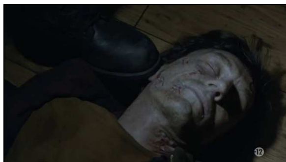
Un mort-vivant dans Zombie (1978) de George Romero. / Le zombie ayant attaqué Thomas dans Les Revenants .