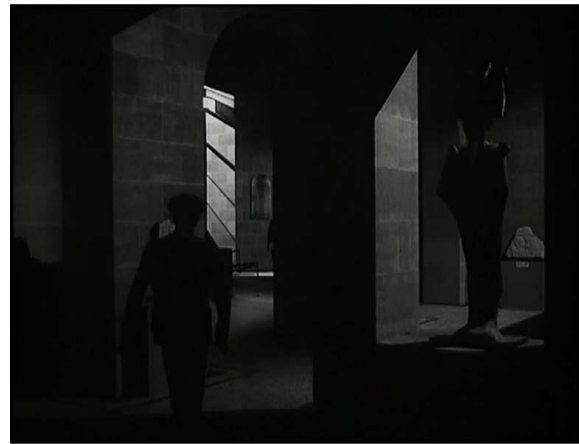
Le fantastique de Belphégor s'instaure notamment par la manière de filmer le Louvre.

La série jouera néanmoins sur un certain effet de surprise, le metteur en scène ayant recouru à un travelling arrière dans le plan suivant. Ce n'est finalement pas à un face-à-face avec le fantôme comme on s'y préparait, mais finalement la révélation de l'assassinat de Sabouret, le gardien qui avait disparu. Le lien avec le fantôme présenté auparavant devient alors évident. En plus d'être un être fantastique, ce fantôme est un meurtrier, un monstre d'horreur qui hante le Louvre durant la nuit. Les deux plans terminant la séquence déjouent alors un peu la tension, Gautrais partant en courant prévenir ses collègues de sa découverte. La vitesse dont caméra et personnage font preuve vient s'opposer au rythme plutôt lent de la première partie de séquence, nous sortons alors de l'atmosphère « angoissante » mise en place précédemment.