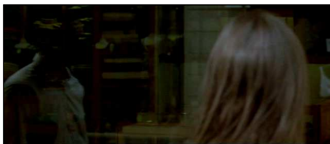
Rachel découvre Mathieu d'abord par son reflet.

Il serait tout de même faux de nier toute approche personnelle du retour des morts dans le film de Robin Campillo. Le réalisateur porte ainsi une attention particulière au personnage de Rachel, qui partage d'ailleurs quelques points communs avec le personnage d'Adèle de la série télévisée. Toutes deux ont perdu l'amour de leur vie, et doivent se faire à leur retour. Rachel, comme Adèle, ne semble pouvoir, au départ, se décider à affronter le retour de celui qu'elle aime. Il faudra attendre la 32 ème minute du long-métrage pour que Rachel et Mathieu, son ancien petit-ami, se rencontrent enfin. On peut d'ailleurs noter que Mathieu apparaît d'abord à Rachel comme un simple reflet, une sorte d'ombre. Elle le voit ainsi dans le reflet d'une fenêtre. Plutôt qu'un mort-vivant, cette image rappelle une autre créature emblématique du genre fantastique : le fantôme.