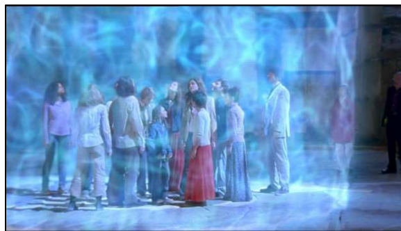
Photogramme extrait de la séquence finale de la série.

Si les sagas estivales ont souvent joué avec les limites du genre fantastique, Mystère est la première à s'y confronter totalement avec ce récit autour d'enlèvements par des extraterrestres. Didier Albert, réalisateur des 12 épisodes de la saison, avoue ainsi avoir été séduit par le thème de la série : « L'histoire nous amène, dans tous les sens du terme, à naviguer dans d'autres sphères. Elle parle de phénomènes qui peuplent notre imaginaire » 63 . Il est ainsi intéressant de soulever l'utilisation des effets spéciaux, notamment lors de l'ultime séquence de la série. Le fantastique devient alors totalement « visible », il « éclate » véritablement à l'écran et n'est plus seulement frôlé comme dans de nombreuses autres sagas de l'été. Avoir choisi de faire voir aussi délibérément l'aspect surnaturel du récit, accepter complètement de faire apparaître le fantastique qui forge la série, fait de Mystère une série à la marge des autres productions françaises de genre.