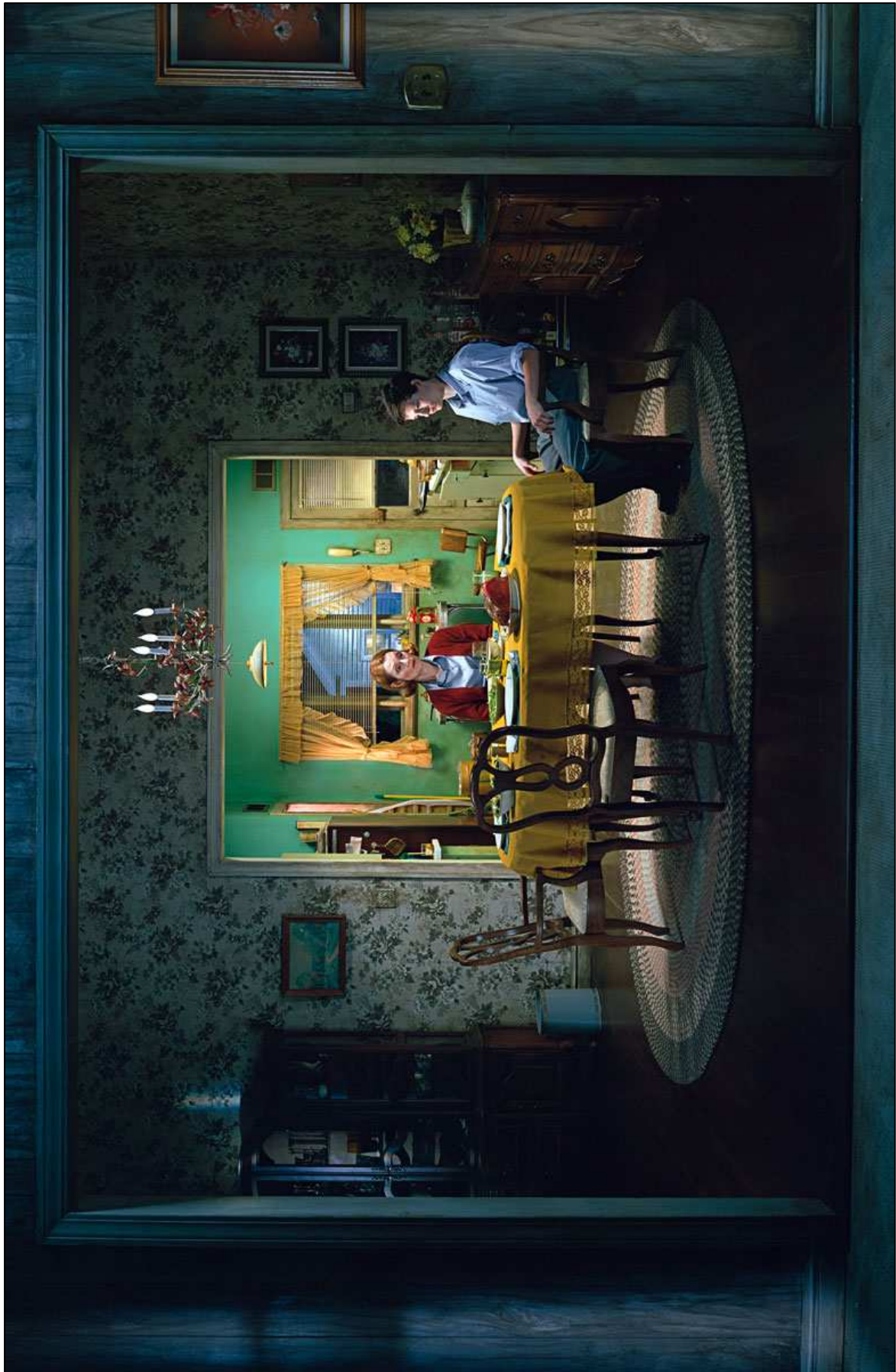
Deux photographies issues de sa série Beneath The Roses ( Sous la surface des roses ), 2003-2007.