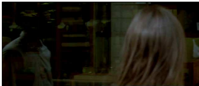
Rachel découvre Mathieu d'abord par son reflet.

Il serait tout de même faux de nier toute approche personnelle du retour des morts dans le film de Robin Campillo. Le réalisateur porte ainsi une attention particulière au personnage de Rachel, qui partage d'ailleurs quelques points communs avec le personnage d'Adèle de la série télévisée. Toutes deux ont perdu l'amour de leur vie, et doivent se faire à leur retour. Rachel, comme Adèle, ne semble pouvoir, au départ, se décider à affronter le retour de celui qu'elle aime. Il faudra attendre la 32 ème minute du long-métrage pour que Rachel et Mathieu, son ancien petit-ami, se rencontrent enfin. On peut d'ailleurs noter que Mathieu apparaît d'abord à Rachel comme un simple reflet, une sorte d'ombre. Elle le voit ainsi dans le reflet d'une fenêtre. Plutôt qu'un mort-vivant, cette image rappelle une autre créature emblématique du genre fantastique : le fantôme.