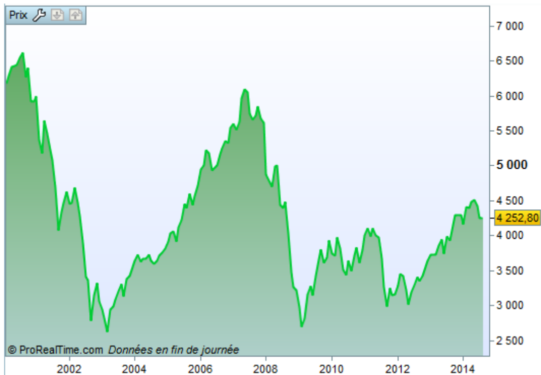
Illustration de la volatilité du CAC 40 depuis l'an 2000

La Vie Entière présente l'avantage d'être décorrélée de la volatilité des marchés financiers; une fois le contrat mis en place, ni le client, ni le conseiller n'a à s'inquiéter des fluctuations de la bourse. Cela ne changera ni les cotisations que l'assuré doit verser, ni la rémunération que va toucher le conseiller. C'est un gage de sérénité pour les deux parties.