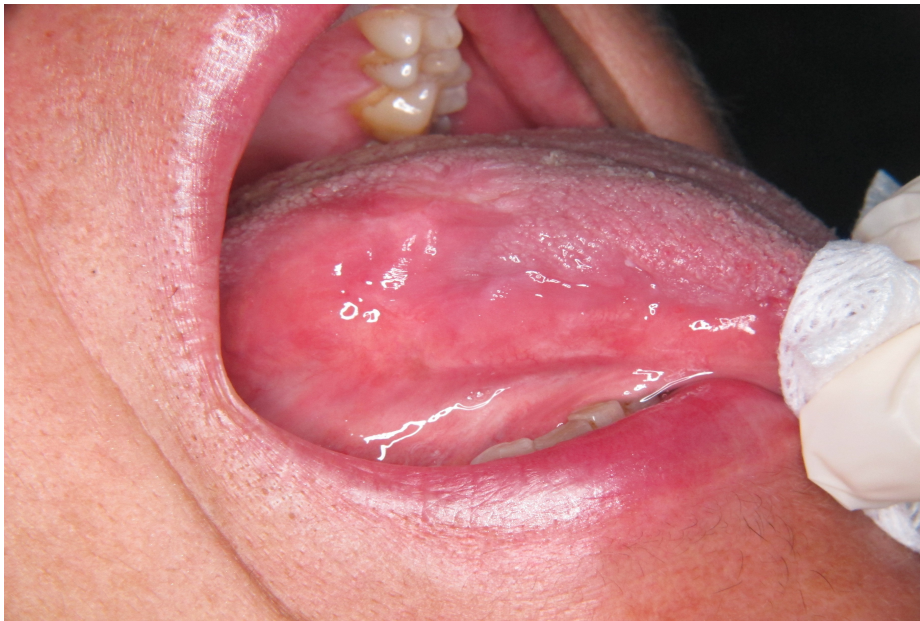
Figure 7 : Photo montrant l'éradication totale de la leucoplasie ( JC Fricain)