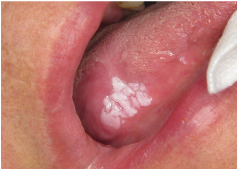
Figure 5: Photo montrant une éradication partielle (JC Fricain)