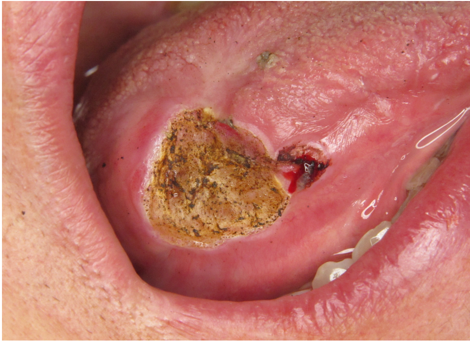
Figure 6 : Photo Post-Opératoire de la deuxième chirurgie (JC Fricain)