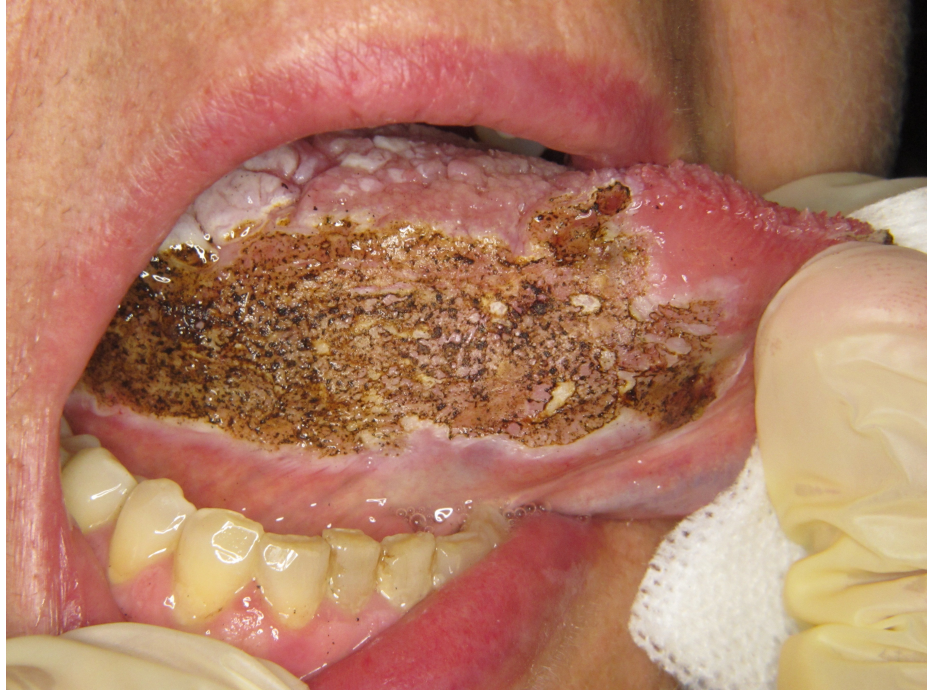
Figure 4 : Vue post-opératoire de la première chirurgie (JC Fricain)