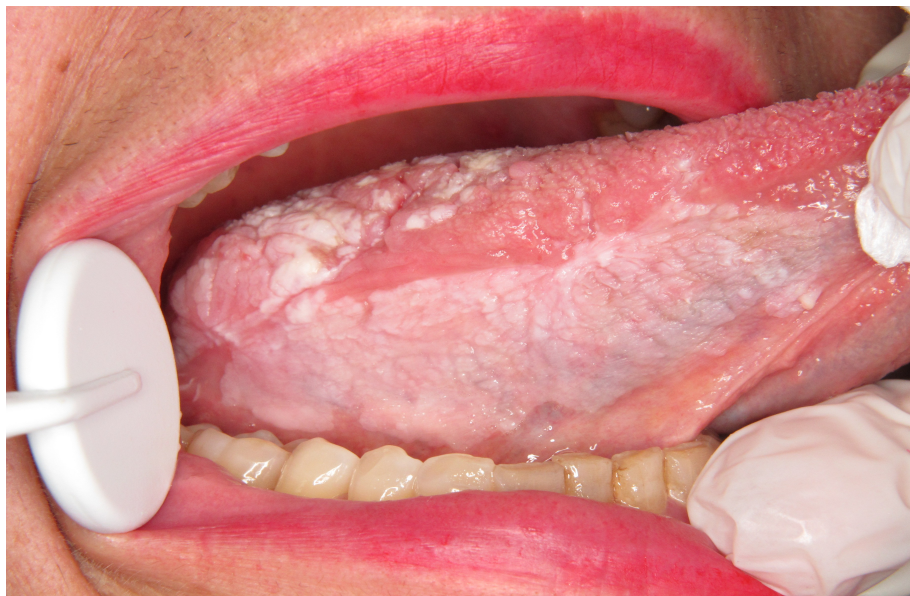
Figure 3 : Leucoplasie étendue bord latéral et face dorsale langue (JC Fricain)

Comme pour l'excision, le contour de la lésion est d'abord tracé en mode pulsé. Le laser est ensuite défocalisé en éloignant la pièce à main du tissu augmentant ainsi le diamètre de spot (ou point). Le rayonnement défocalisé est ensuite balayé sur la lésion en plusieurs tirs adjacents en dessinant plusieurs "U" [10]. Après le premier passage, la profondeur de pénétration est évaluée. Cette dernière peut être augmentée ou diminuée en agissant sur la puissance, la vitesse de balayage du faisceau et la taille du spot. Les images dessous montrent une leucoplasie étendue sur le bord latéral de la langue et sur la face dorsale à différents étapes du traitement.